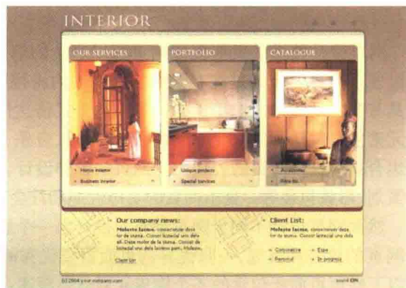
图 1-2-4 室内装饰设计 \index.html