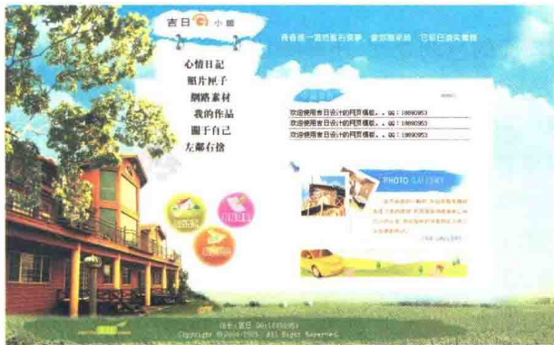
图 1-4-11 吉日小居个人主页 \index.htm