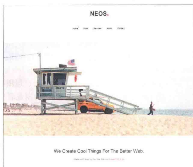
图 1-4-14 neos \index.htm