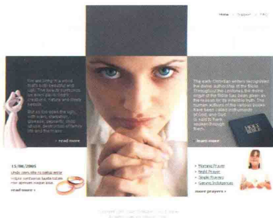
图 1-4-3 女性网页 \index.html