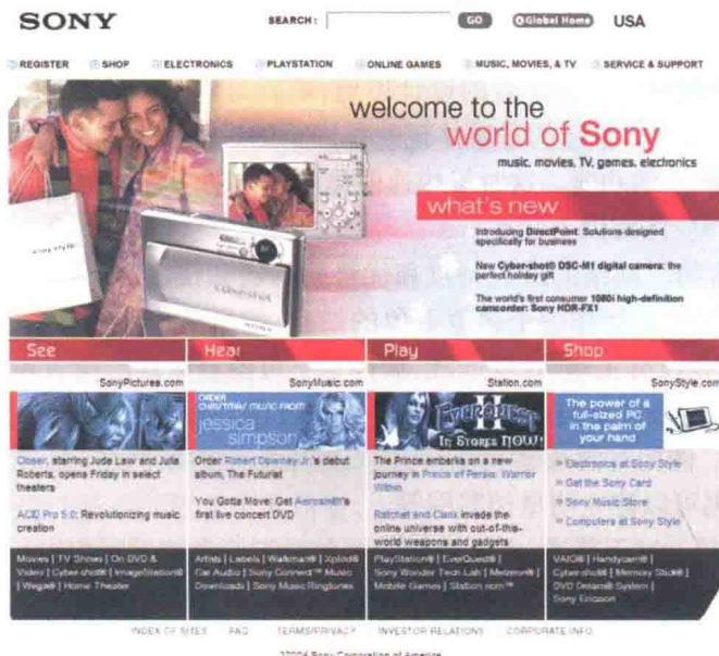
图 1-3-1 CI 形象 1(注意网页中左上角的 SONY 标志)