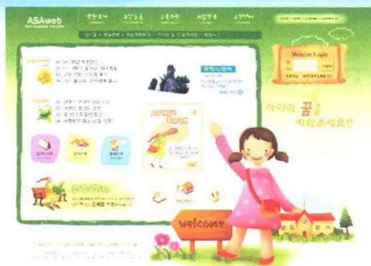
图 1-2-1 儿童娱乐天地 .tif