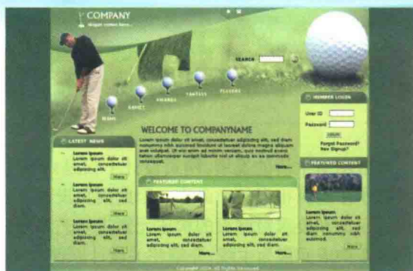
图 1-2-2 高尔夫球运动 \index.html