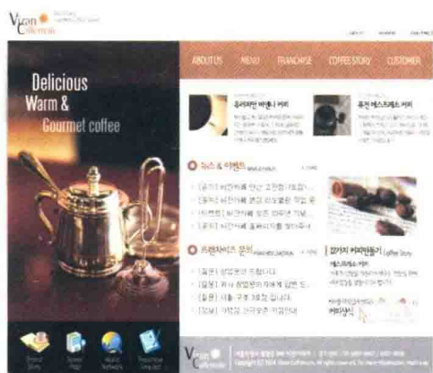
图 1-2-3 精美咖啡文化 .tif