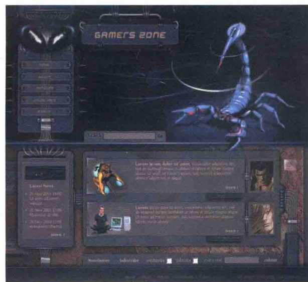
图 1-4-16 游戏玩家 \index.html