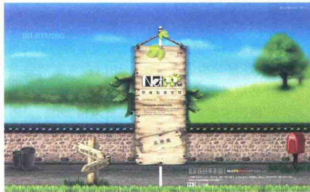
图 1-4-12 思维创意空间 \index.htm