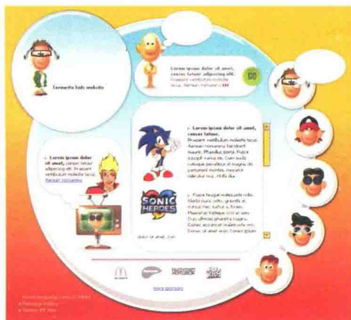
图 1-4-2 动漫地带 \index.html