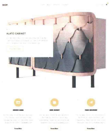
图 1-4-13 办公家具 \index.htm