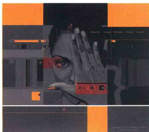
图 1-4-4 视觉设计工作室 \index.html