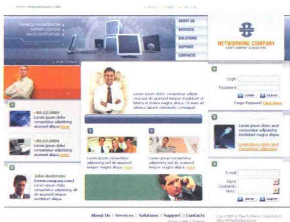
图 1-4-1 软件公司 \index.html