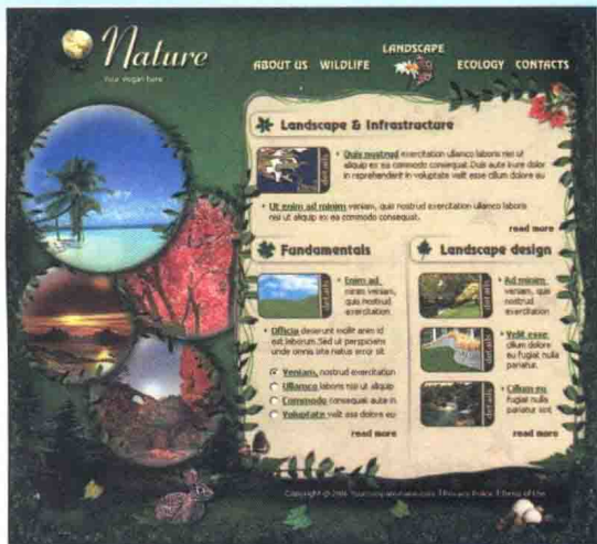
图 1-2-6 技能拓展 \2\html\index.html