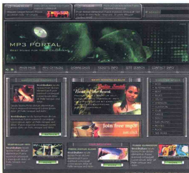
图 1-4-15 音乐歌曲 \index.htm