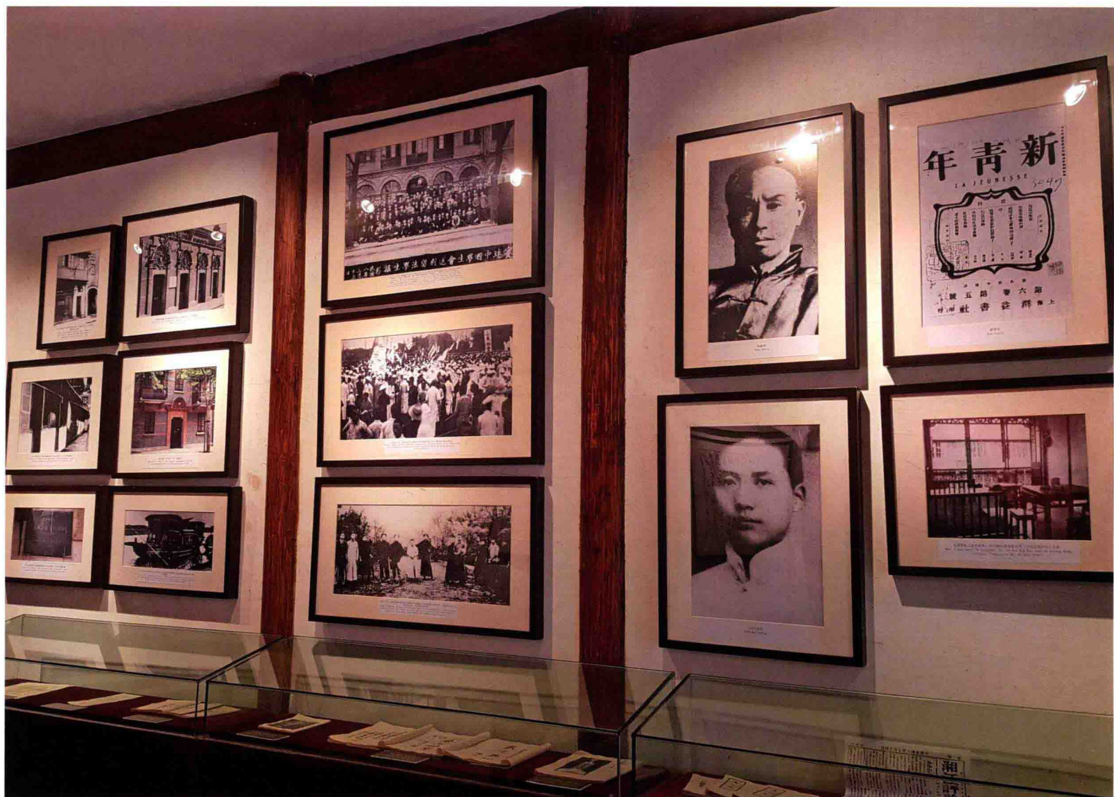
1920年毛泽东寓所旧址内图片展览