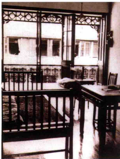
1920年毛泽东寓所旧址内景