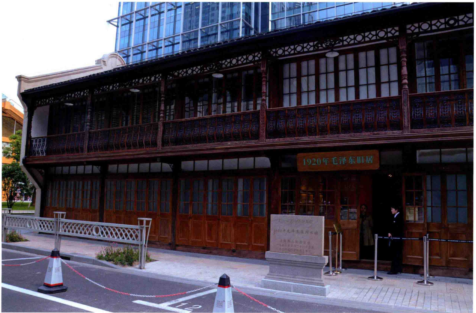
上海市静安区安义路63号1920年毛泽东寓所旧址外景