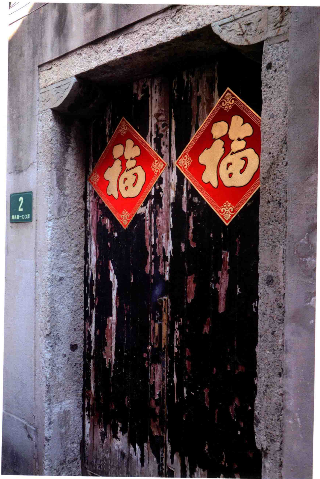
上海市黄浦区(原卢湾区)南昌路100弄2号 陈独秀寓所暨《新青年》编辑部旧址