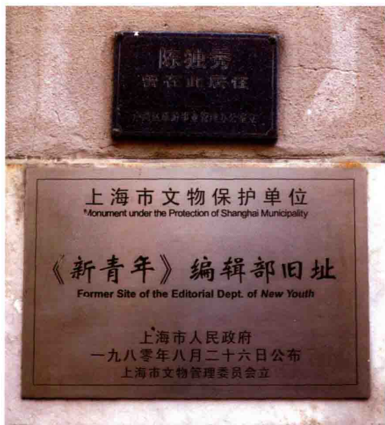
陈独秀寓所暨《新青年》编辑部旧址（铭牌）

上海共产党早期组织是中国的第一个共产党组织，习惯上称为中国共产党上海发起组。她诞生于陈独秀的上海寓所，也即《新青年》编辑部。1917年陈独秀应北京大学校长蔡元培之邀出任北京大学文科学长，并将《新青年》编辑部迁至北京。1920年2月下旬，陈独秀来到上海，后住在法租界环龙路老渔阳里2号（今南昌路100弄2号），《新青年》编辑部也迁至这里。1920年5月陈独秀在此发起建立了秘密团体——马克思主义研究会；6月陈独秀、李汉俊、俞秀松、施存统、陈公培等五人在陈独秀寓所开会，确定建立中国共产党。选举陈独秀为领导人（书记）。中国共产党上海发起组成立后即成为创建全国统一的无产阶级政党的中心。1920年12月陈独秀离沪赴广州任广东省