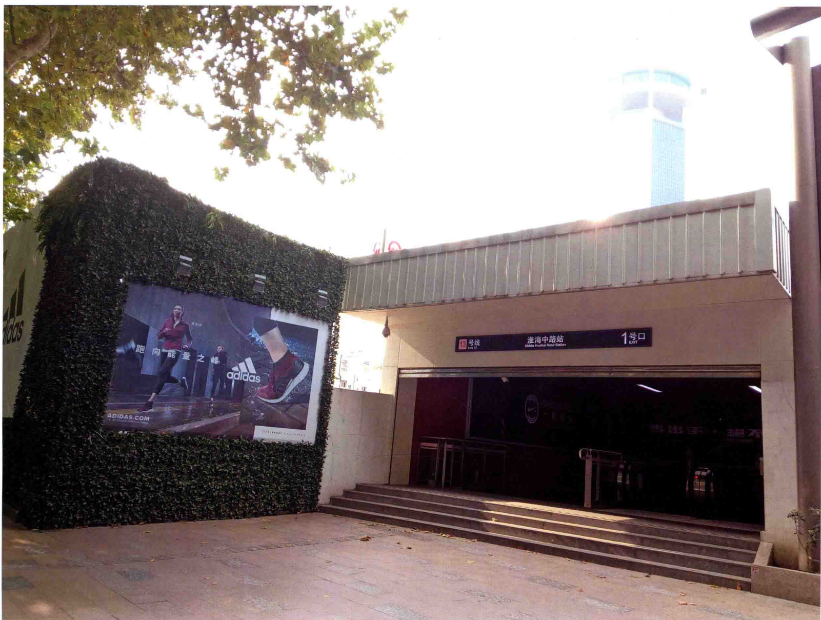
上海市黄浦区（原卢湾区）淮海中路瑞金一路轨交13号线淮海中路站1号口