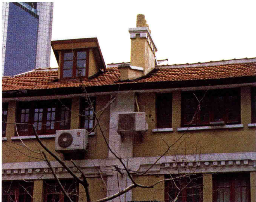
上海市淮海中路716号维经斯基寓所（历史照片）