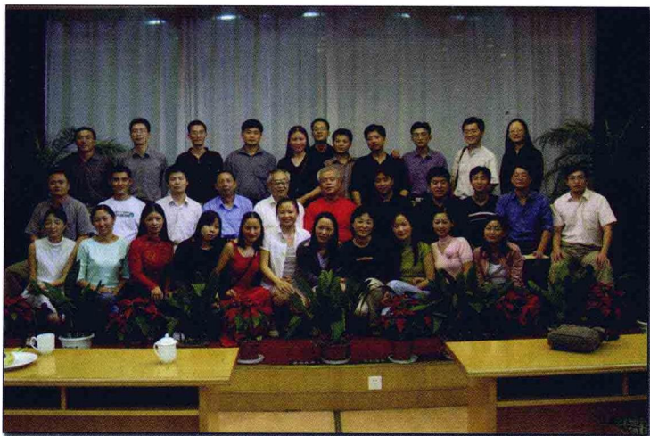
与凤凰语文网友们合影