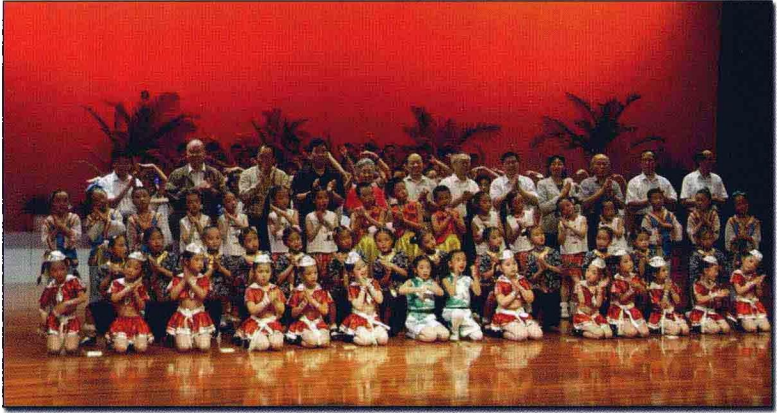
常熟培训会开幕式现场