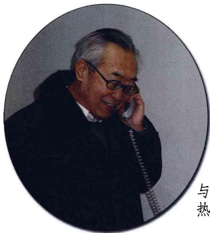
与实验区老师 热线交流