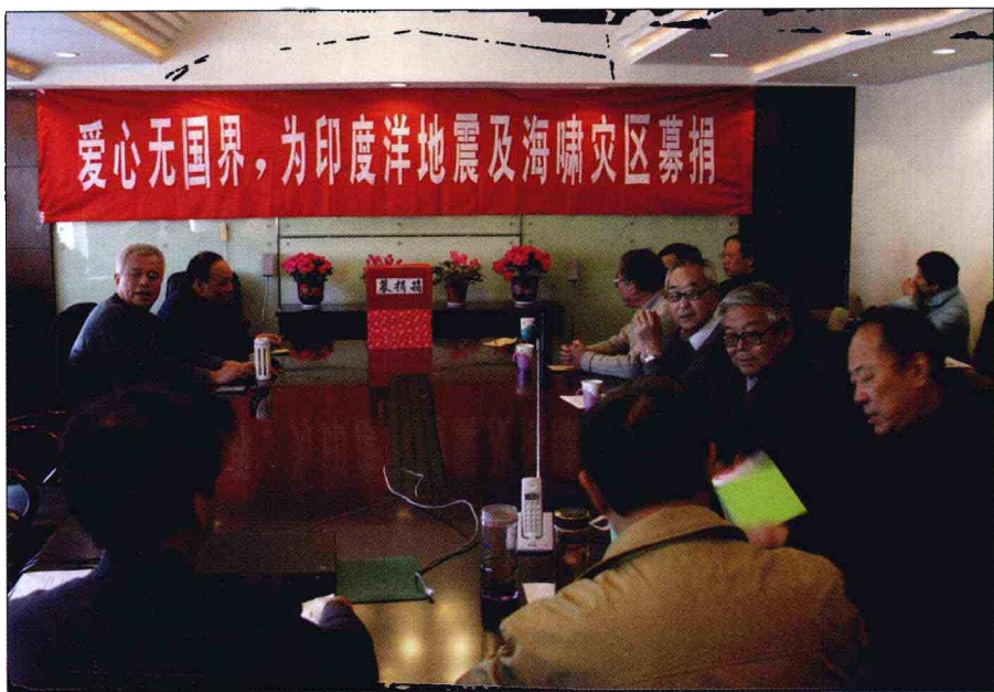
与凤凰母语教育科学研究所员工共同为灾区捐款