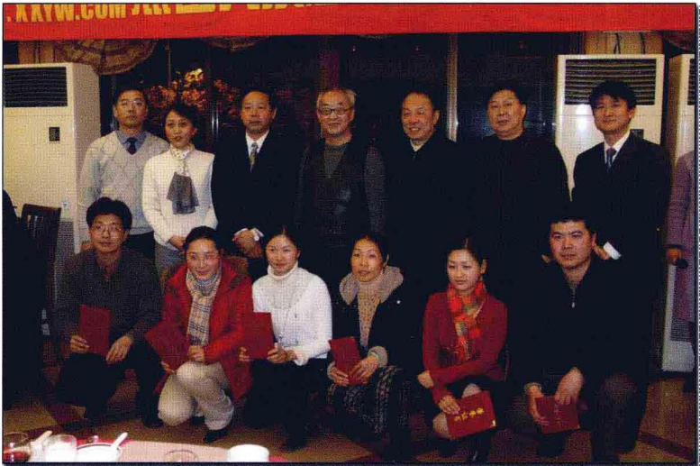
在凤凰语文网10万点击庆祝酒会上