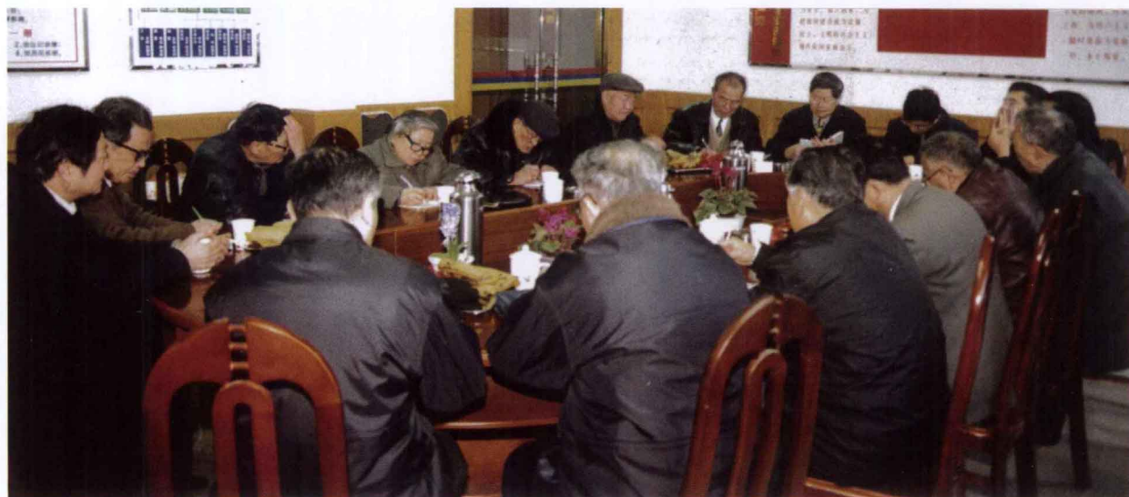
2001年2月9日，在梅湖农场举行三届七次理事会议。