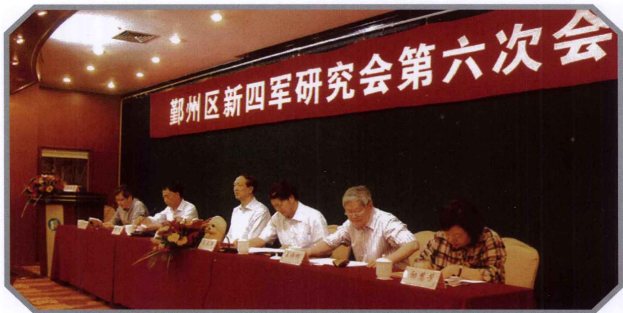
区委副书记毛春阳，市新四军历史研究会会长郁义康、常务副会长励慧芳，会长胡广良，名誉会长王雅根在主席台上。