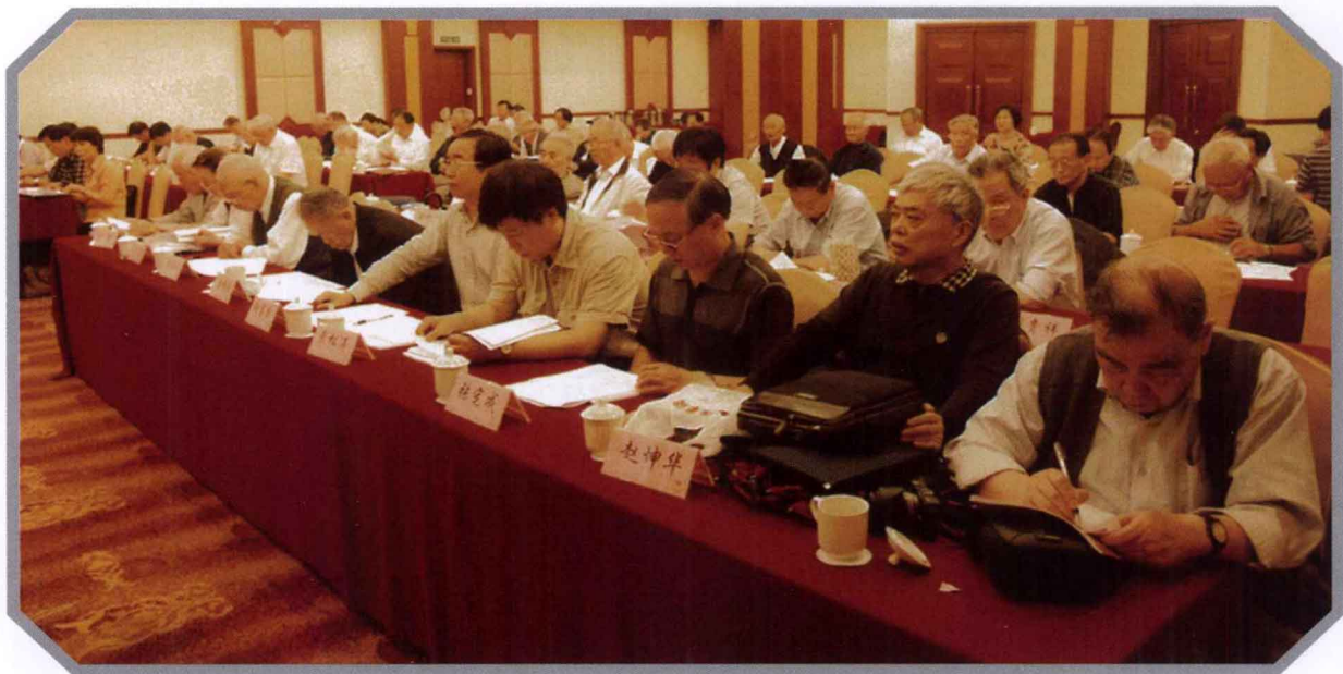
第六次会员大会会场一角