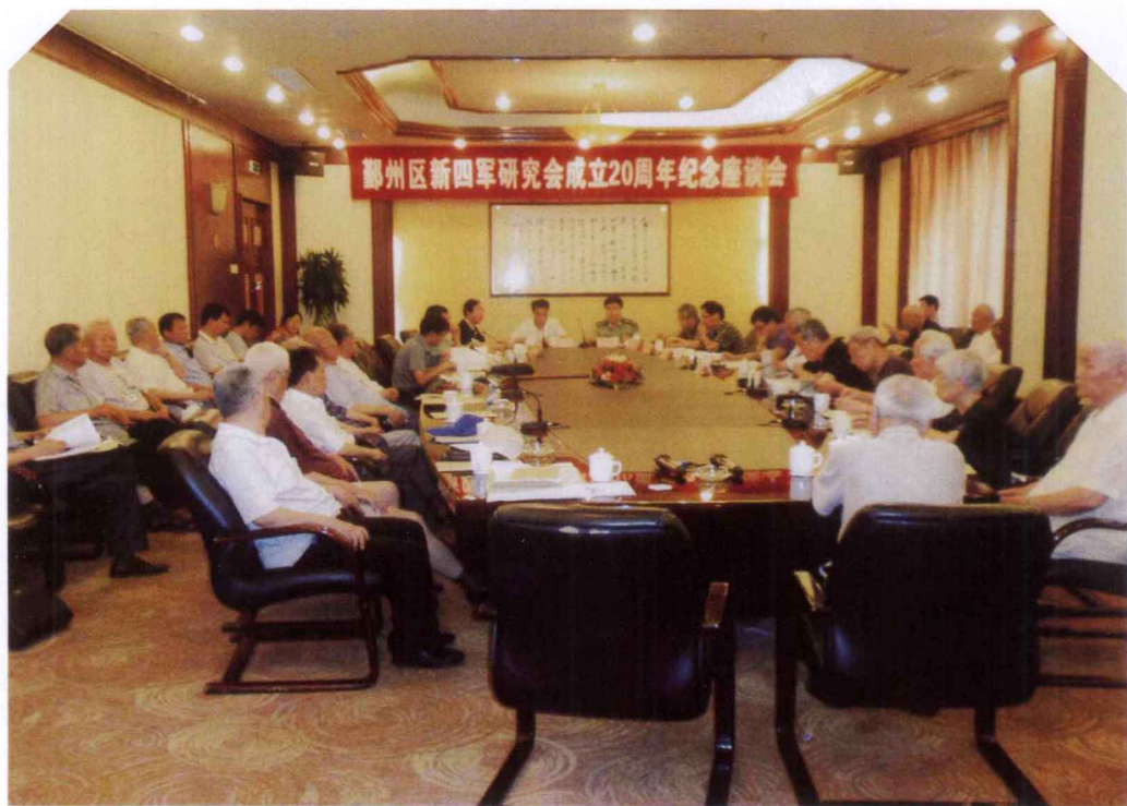
鄞州区新四军历史研究会于2012年7月27日举行成立20周年纪念座谈会