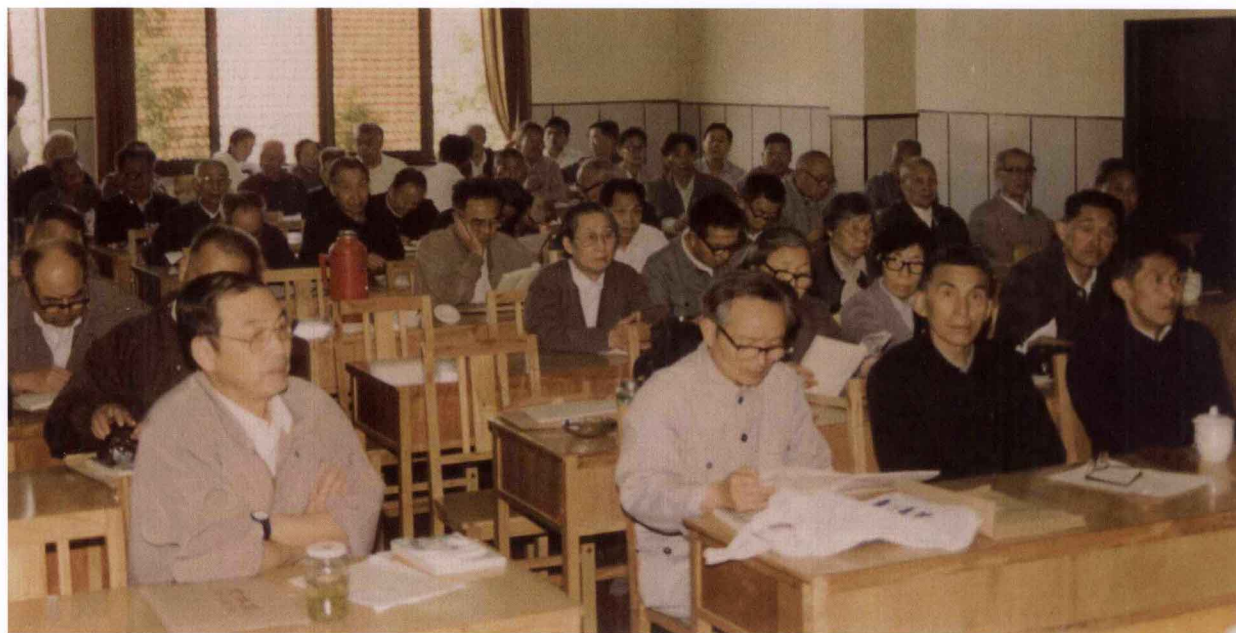
第二次会员大会会场一角