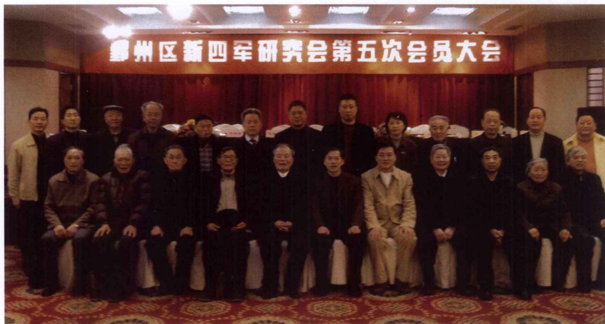
区委领导与区新四军历史研究会五届理事会成员合影