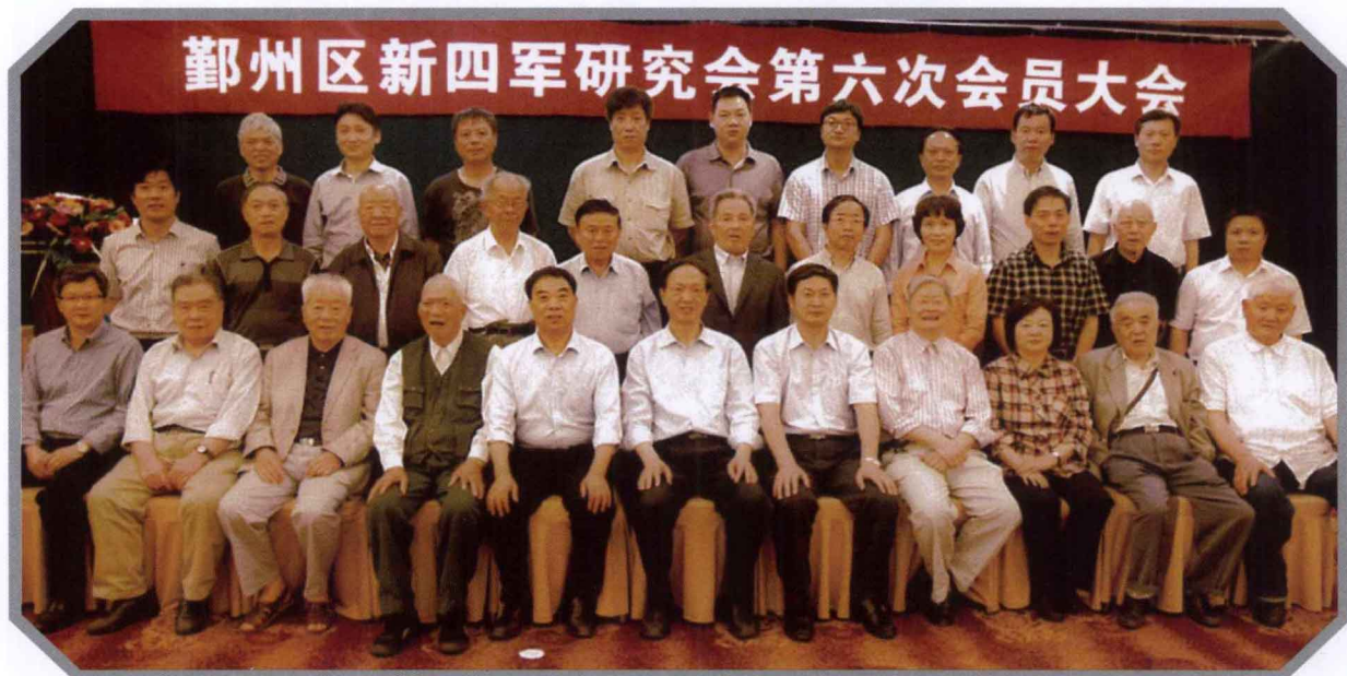
市、区领导与区新四军历史研究会六届理事会成员合影。