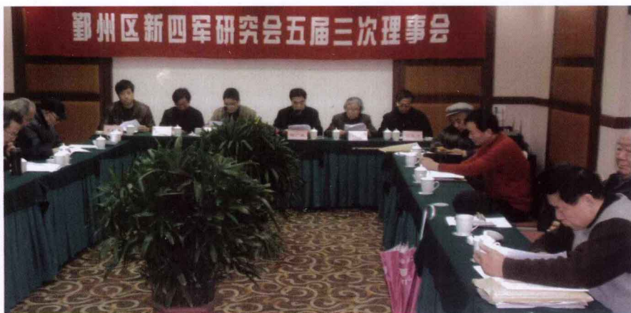
2009年3月3日，五届三次理事会在甬港饭店文泰厅举行。