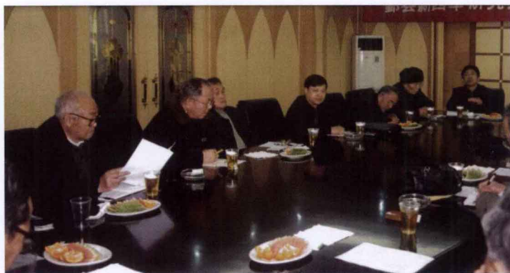
2002年2月21日，四届二次理事会在蛟口水库西山阁宾馆举行。