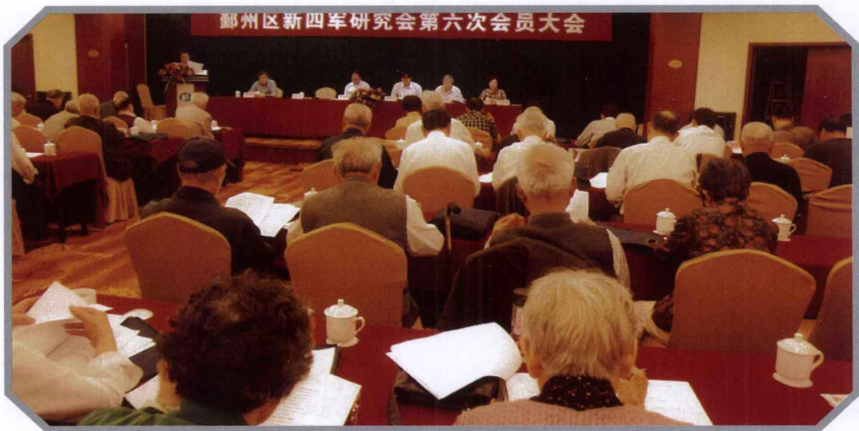
鄞州区新四军历史研究会第六次会员大会，于2012年5月30日在新舟宾馆举行。