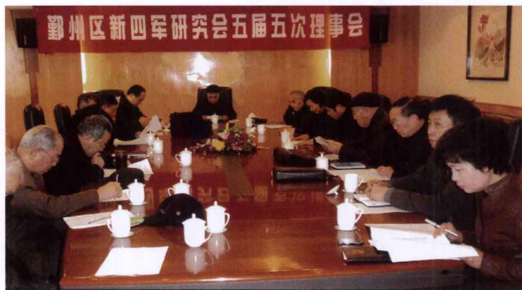
2011年3月10日，五届五次理事会在甬港饭店文津厅举行。