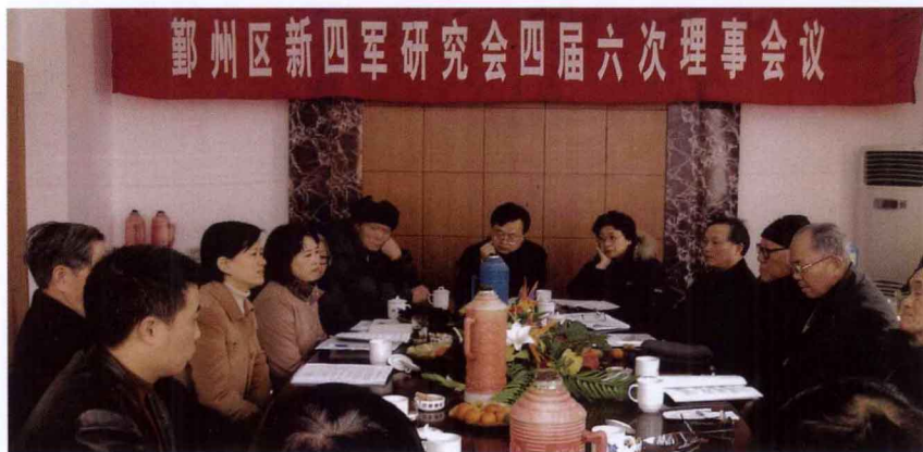
2005年1月26日，四届六次理事会在咸祥镇威达西服厂举行。