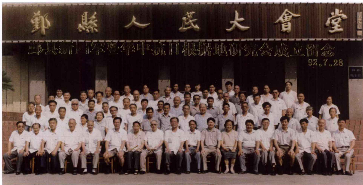
参加鄞州区（县）新四军历史研究会成立大会全体同志合影