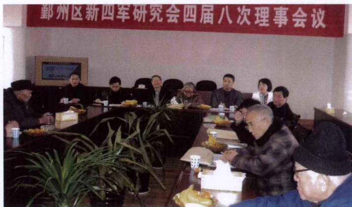
2007年2月6日，四届八次理事会在区委老干部局举行。