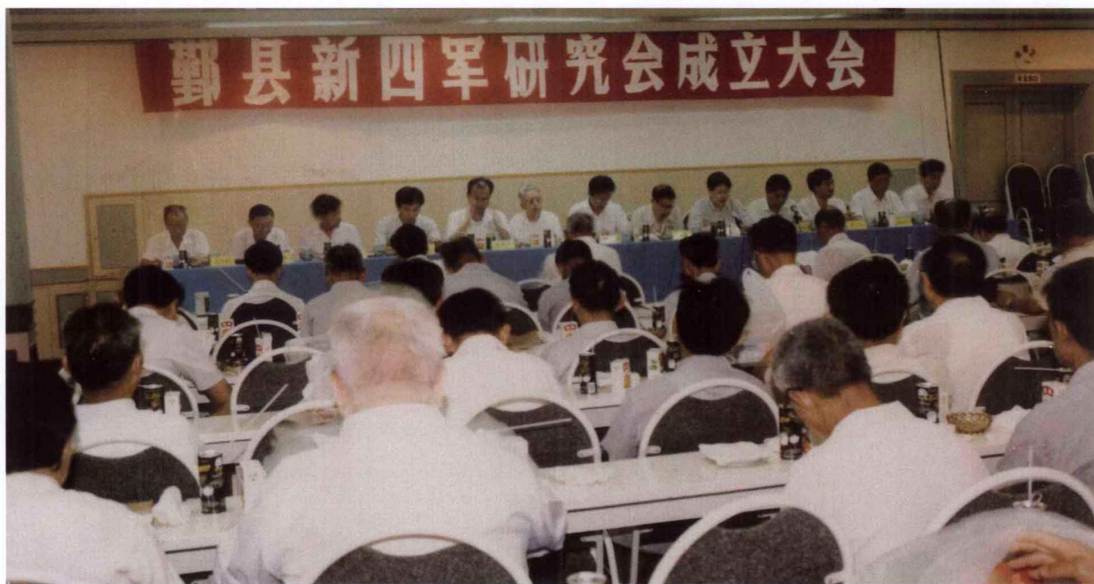
鄞州区（县）新四军历史研究会成立大会，于1992年7月28日 在鄞县人民大会堂举行。