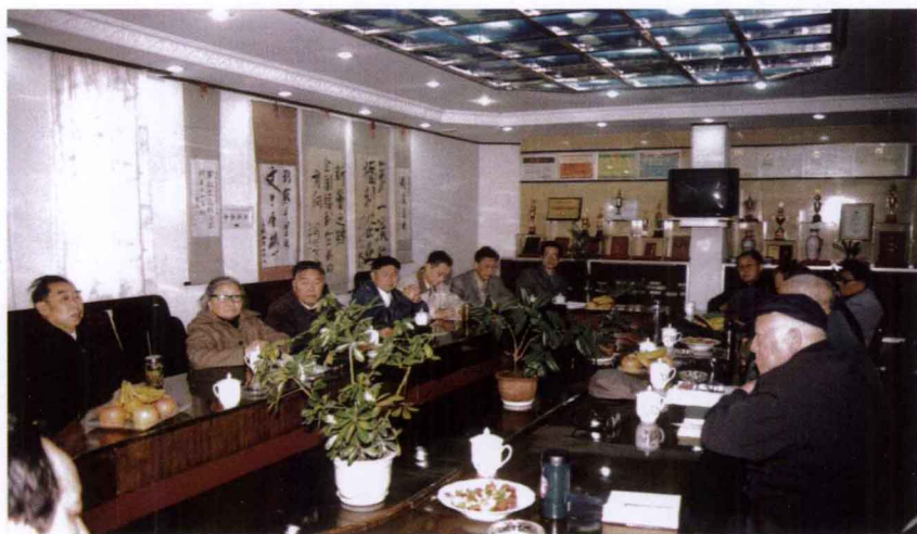
1998年12月23日，在 鄞江镇宁波新蕾集团 举行三届五次理事会议。