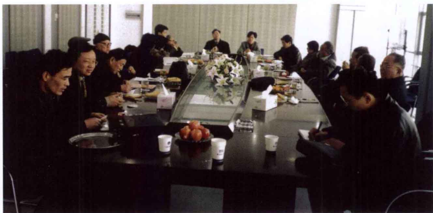
2003年2月21日，四届三次理事会在东钱湖福泉山茶场举行。