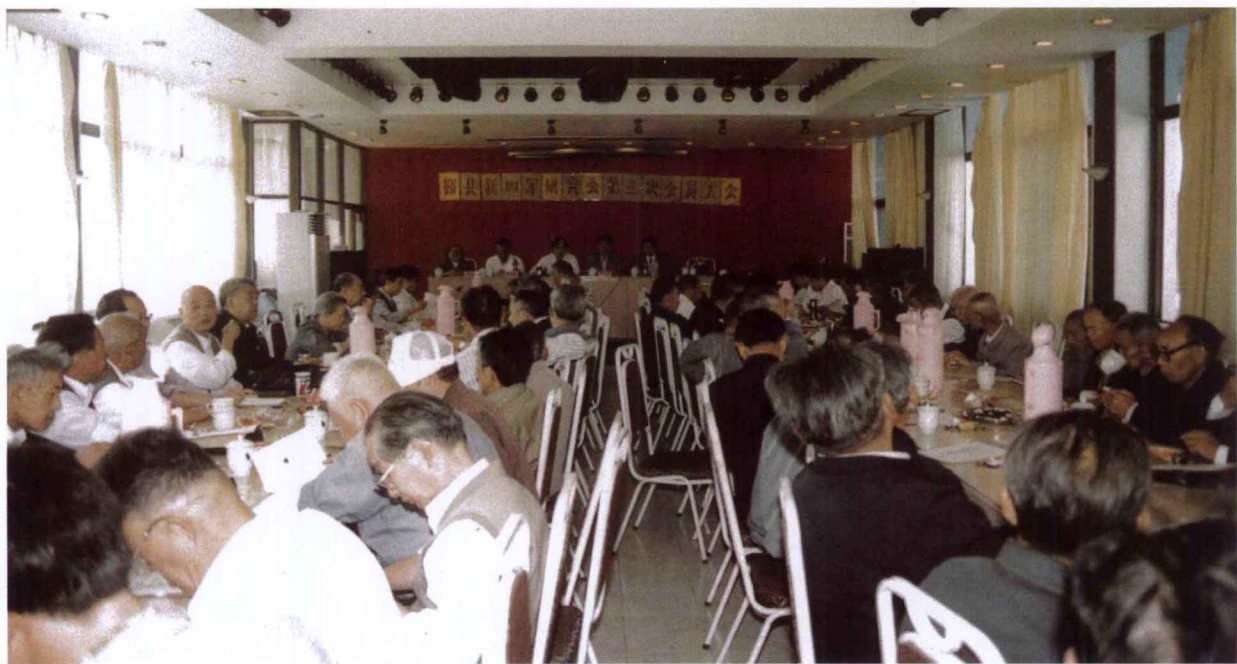
鄞州区（县）新四军历史研究会第三次会员大会，于1996年5月21日在皎口水库西山阁举行。