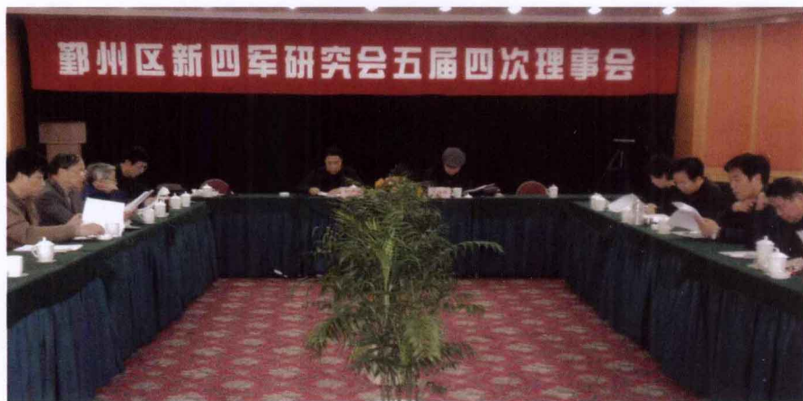
2010年3月16日，五届四次理事会在甬港饭店文渊厅举行。