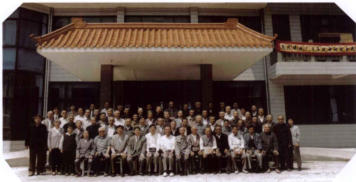
出席鄞州区（县）新四军历史研究会第三次会员大会全体会员合影