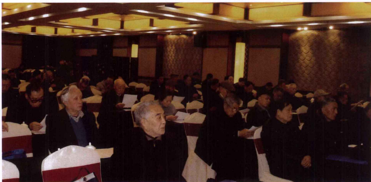
鄞州区新四军历史研究会第五次会员大会会场一角