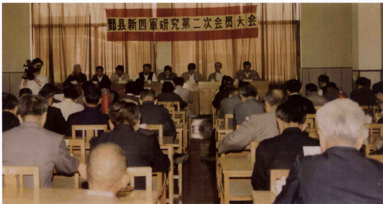
鄞州区（县）新四军历史研究会第二次会员大会，于1994年5月17日至18日在县委党校举行。