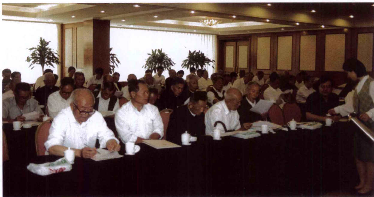
鄞州区新四军历史研究会第四次会员大会会场一角