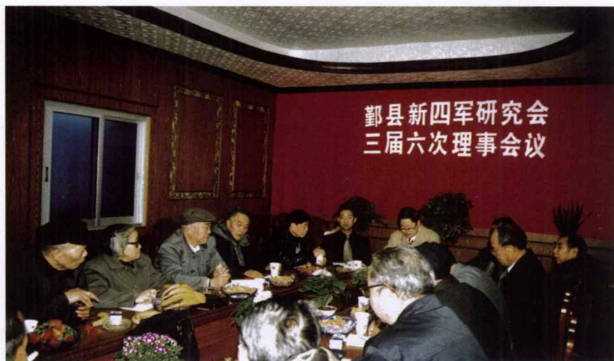
2000年1月11日，在 咸祥镇宁波威达西 服厂举行三届六次 理事会议。