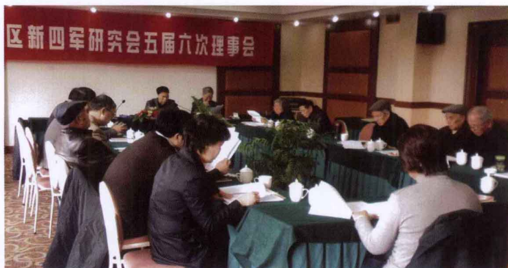
2012年3月22日，五届六次理事会在甬港饭店文泰厅举行。