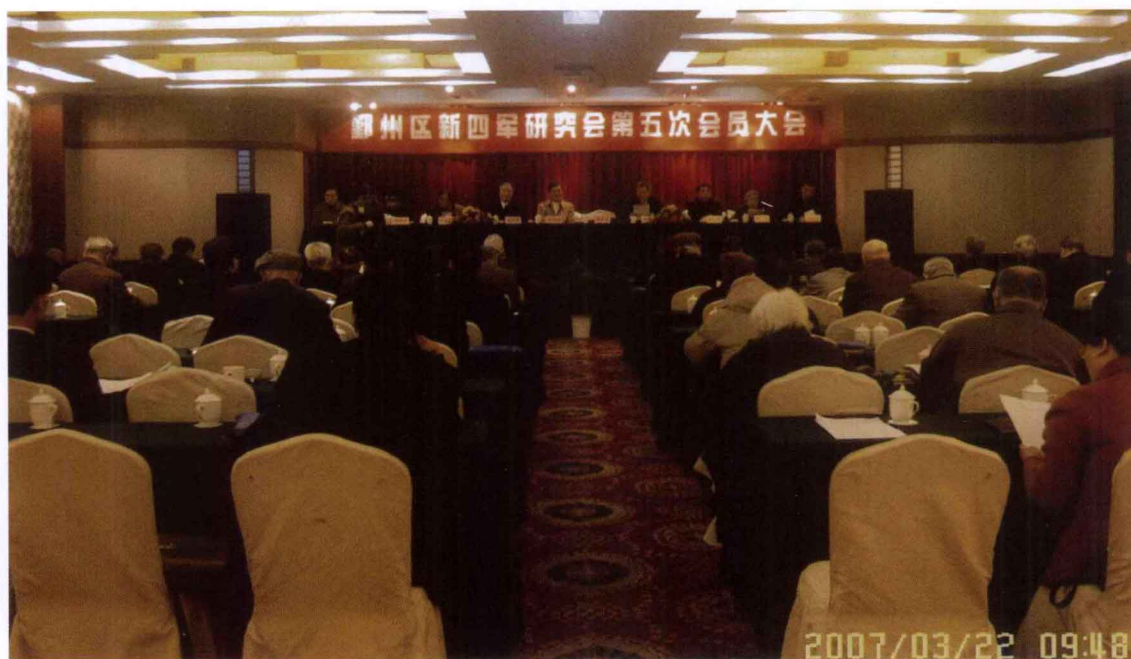
鄞州区新四军历史研究会第五次会员大会，于2007年3月22日在甬港饭店举行。