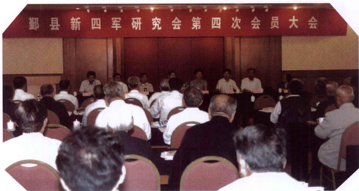
鄞州区（县）新四军历史研究会第四次会员大会，于2001年6月7日 在东港大酒店举行。