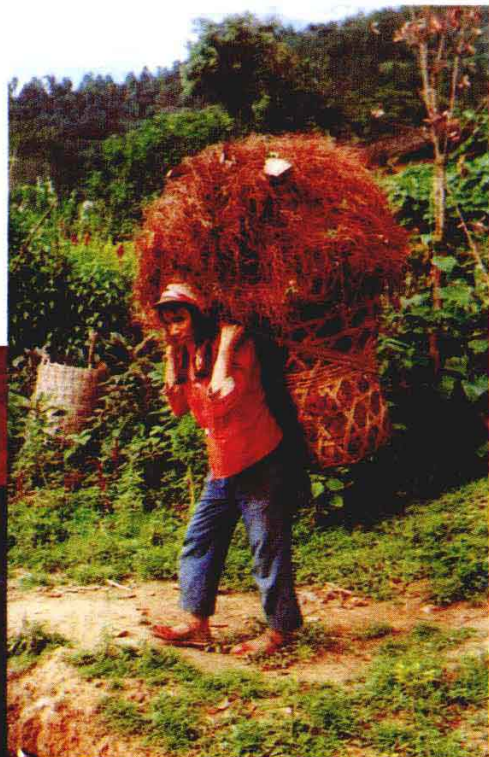
▲ 图10 摩哈苜的姑娘早晨背草回家。