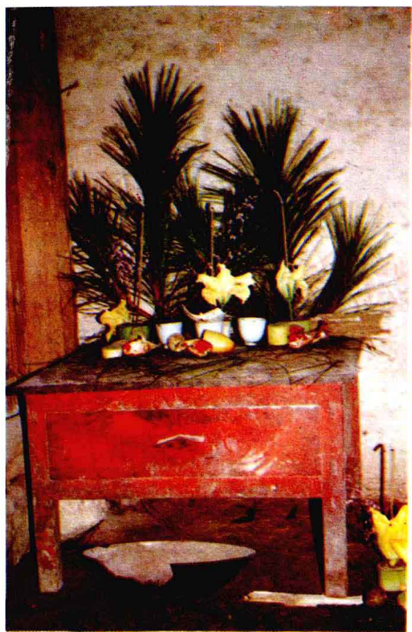
◀ 图2 摩哈苜张新荣家 1995 年 8 月 9 日（农历七月十四日）接祖时的供桌。