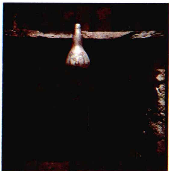
▲ 图3 摩哈苜 40 年代举行大祭时门前悬挂的“虎头葫芦瓢”。