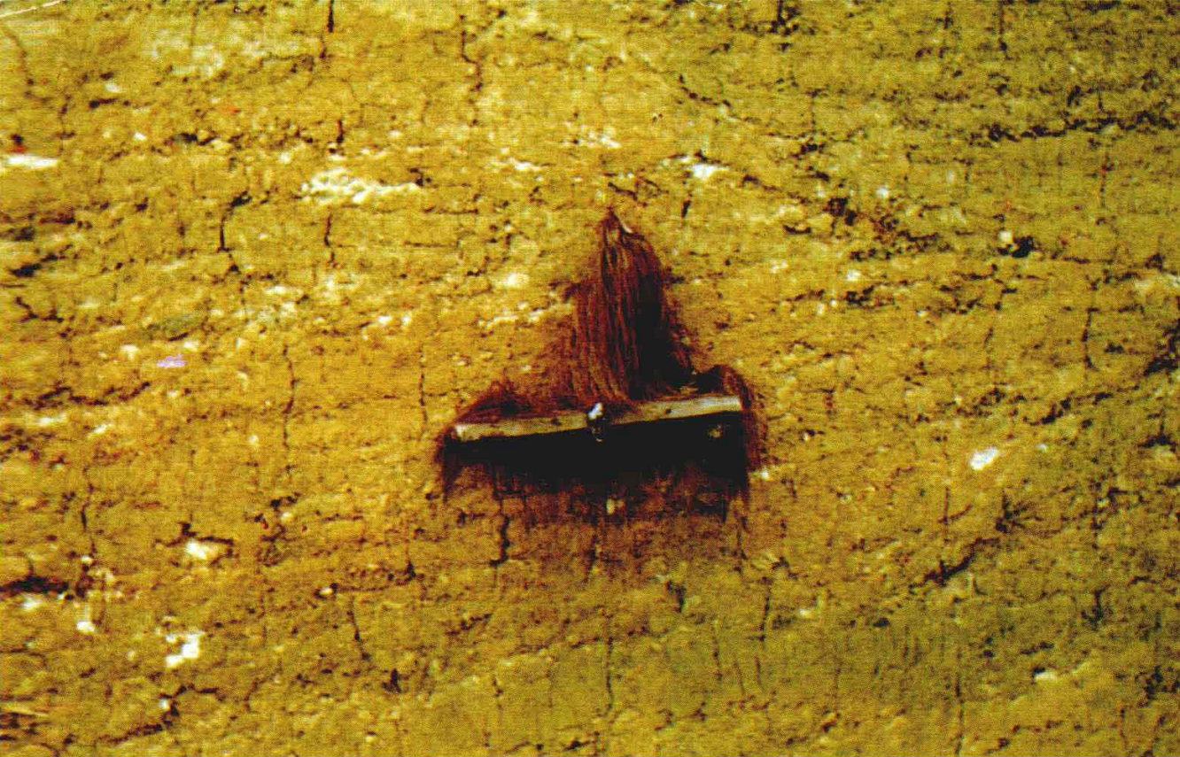
▲ 图4 摩哈苜的“土主神”位。