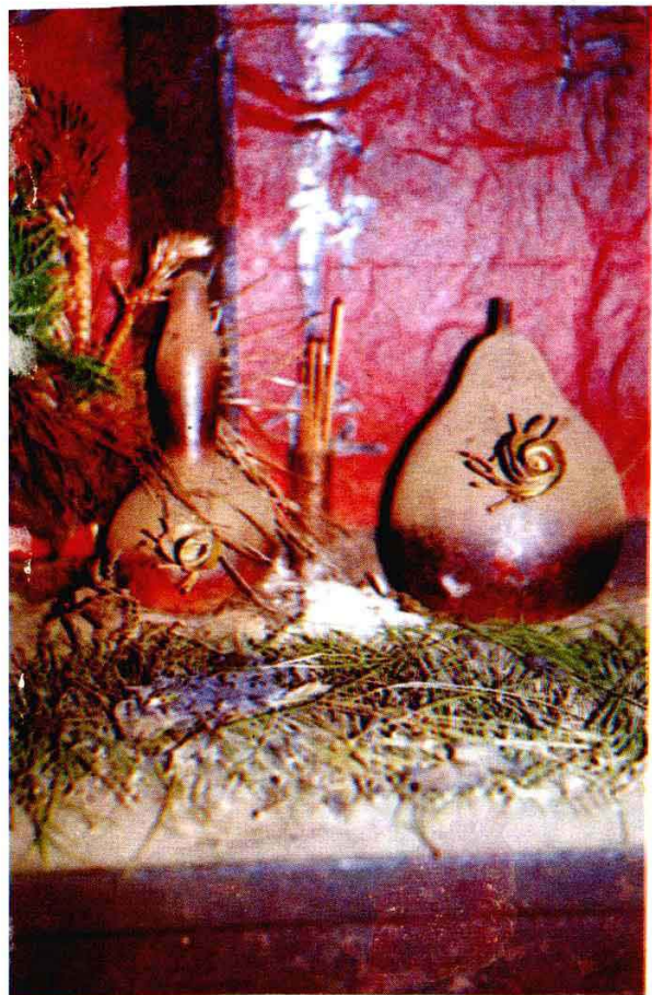
◀ 图1 摩哈苜李发有家供奉的祖灵葫芦。