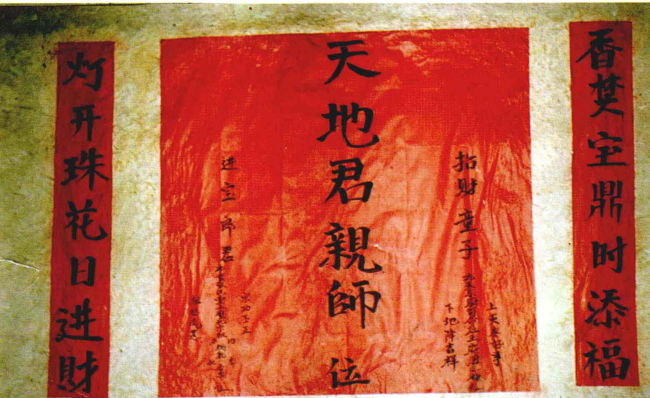
▼ 图5 摩哈苜的家神。