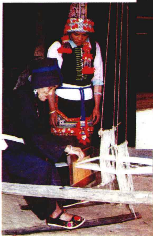
▼ 图11 摩哈苜人在织麻布。