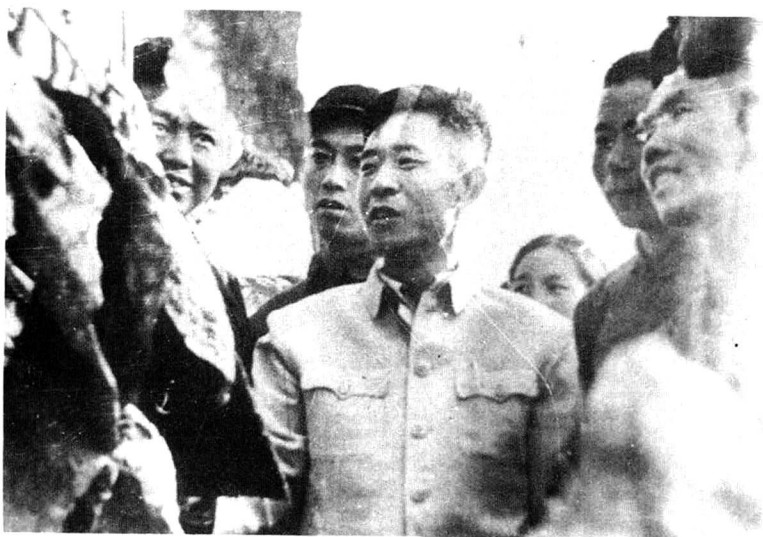
1958年9月28日，胡耀帮（前排中） 视察城关烟田。