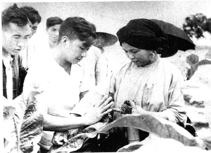
1958年，全国烟叶生产会议云南少数民族代表在襄城县。