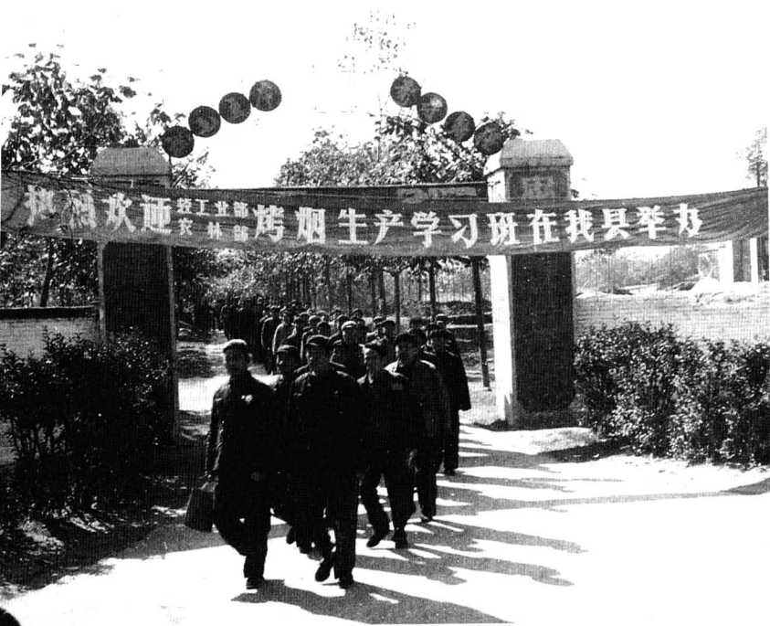
全国烤烟生产学习班成员在襄城