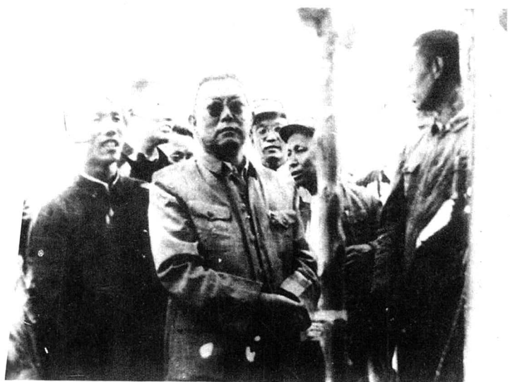
1958年8月21日，李先念（前排中） 视察城关一大队烟田。