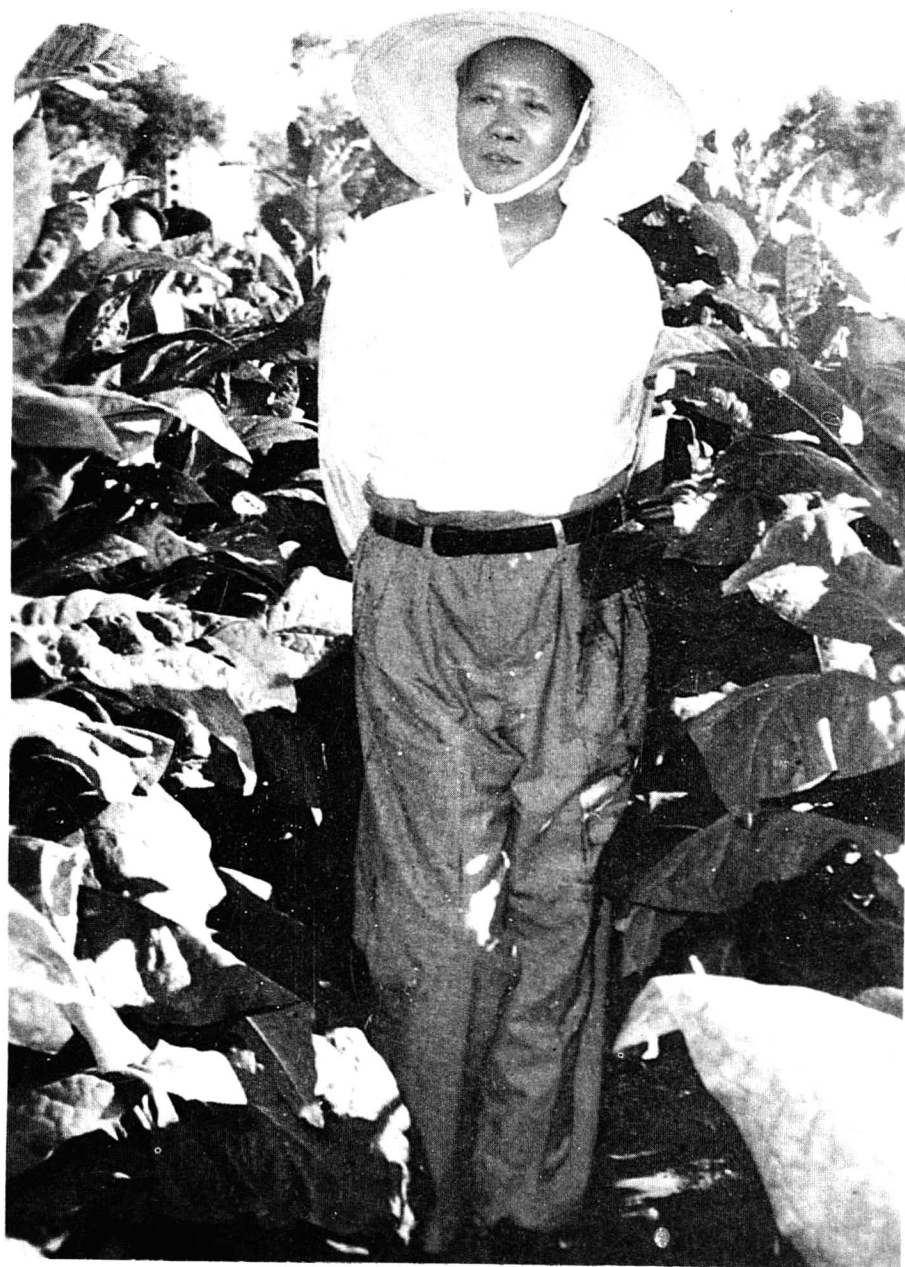
1958年8月7日，毛泽东主席亲临襄城烟区视察，并称赞说：“你们这里成了烟叶王国了。”