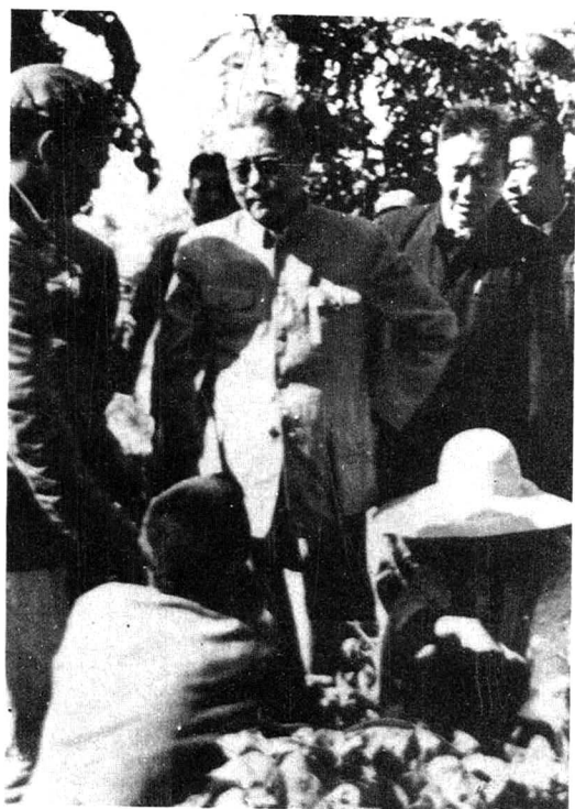
1958年8月21日，李先念（中）视察 城关试验场烟田。