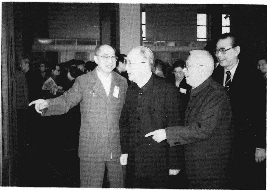
陪同薄一波同志观看云南老干书画展（1991年5月）