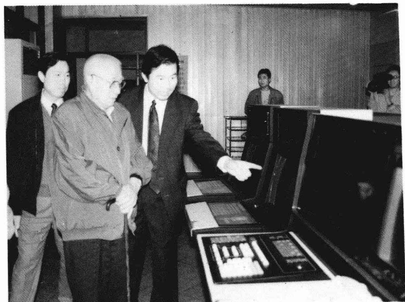
参观云南天然气化工厂（1995年）