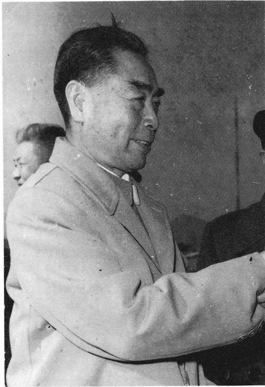
周恩来总理的亲切接见（1962年在昆明）