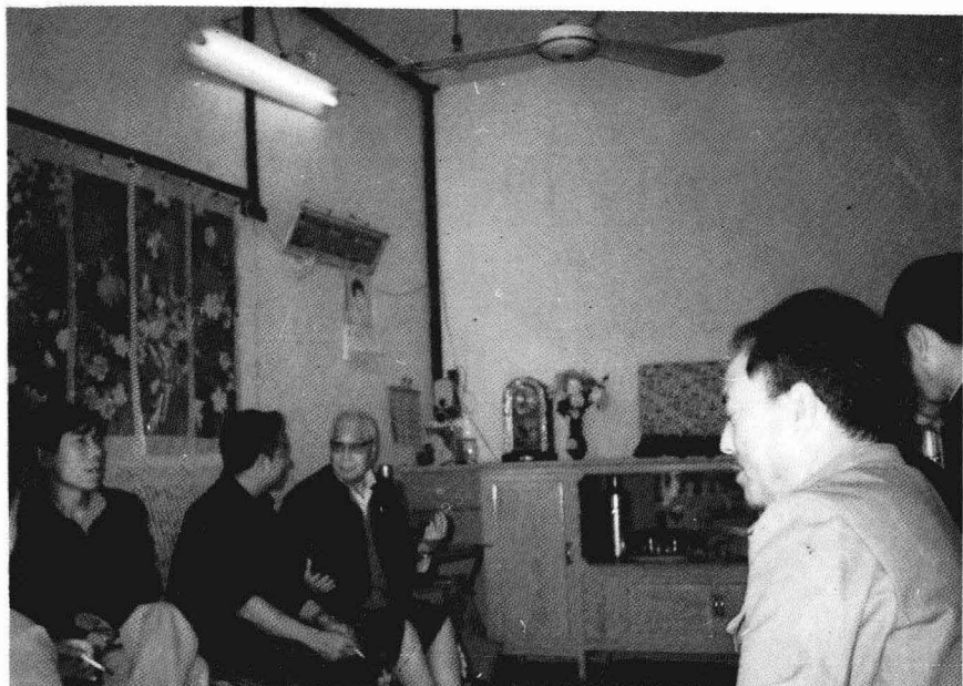
1986年在峨山县回民家座谈