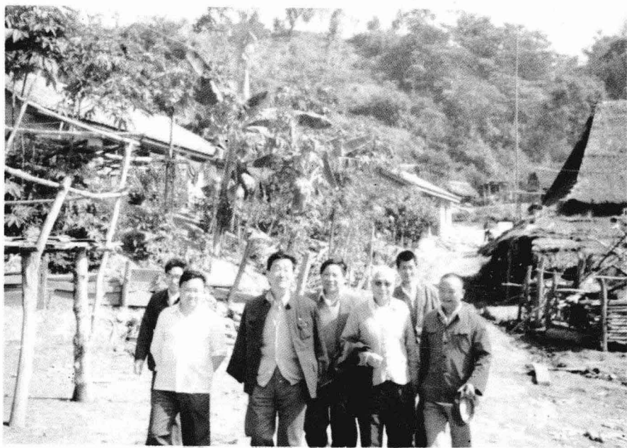
视察基诺族地区义务教育（1987年）