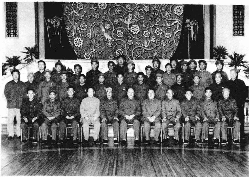
1981年陪同乌兰夫同志接见云南边防战士