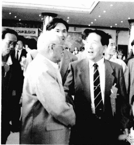
一九九三年与秦基伟同志在昆交会上