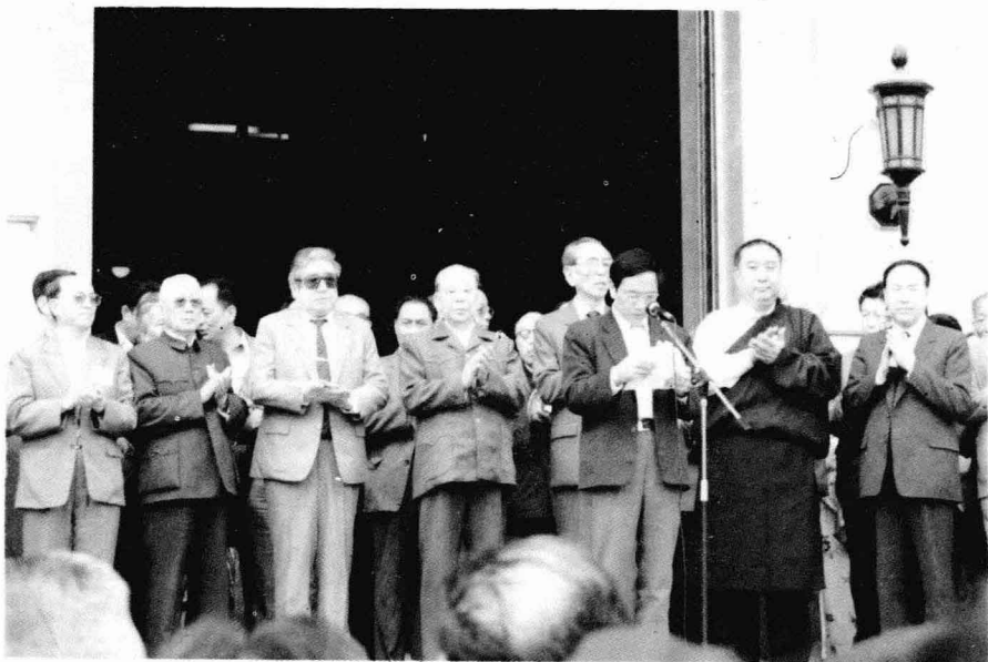
国务院表彰民族团结先进个人、集体代表会（1988年）。右起：司马义·艾买提、班禅、阿沛·阿旺晋美、彭冲、杨静仁、孙雨亭