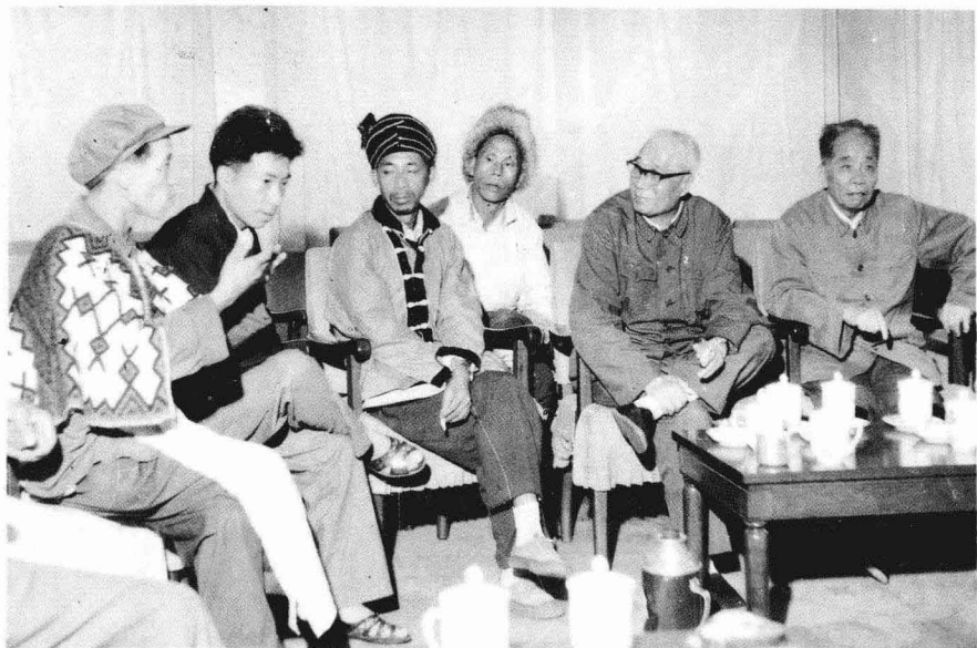
在省人大会议上与少数民族代表座谈（1982年）