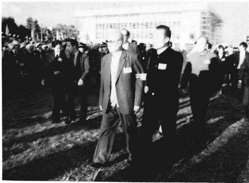
1987年参加景颇族目脑纵歌节