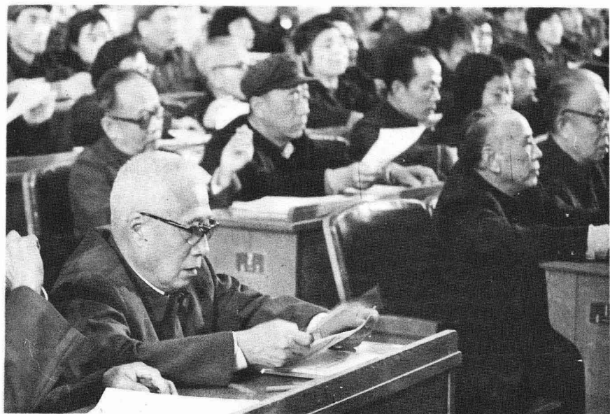
出席第五届全国人民代表大会（1982年）