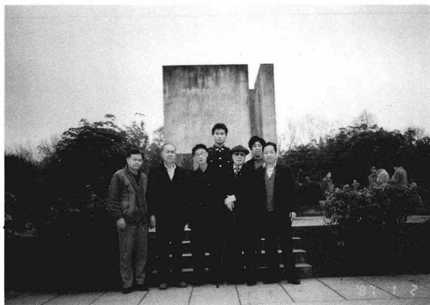
参观周恩来总理1962年与缅甸吴努总理会谈纪念碑