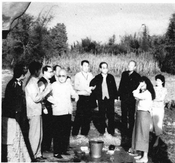
考察中缅边界少数民族生活（1987年）