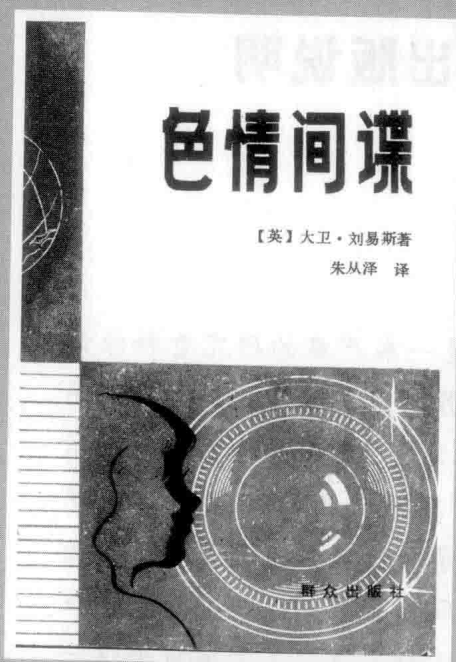
《色情间谍》 群众出版社1979年出版