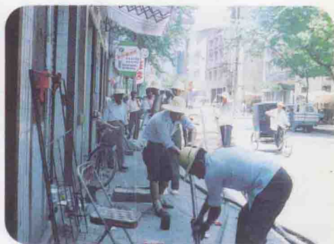
▲全体干部职工铺放市话电缆