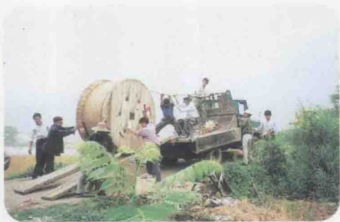
▲津洋口支局电话村建设