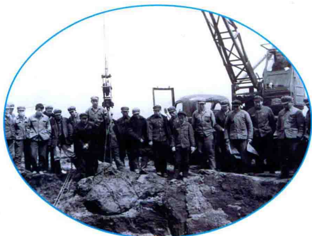
1976年3月8日，陨石雨降落在永吉县桦皮厂镇靠山村的田地里。一号陨石穿过1.7米冻土层，埋在深6.5米的土层中，净重1 770公斤。