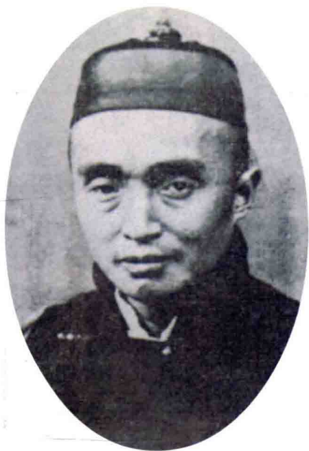
1905年牛子厚(35岁)开办京剧科班“喜连成”时的照片。