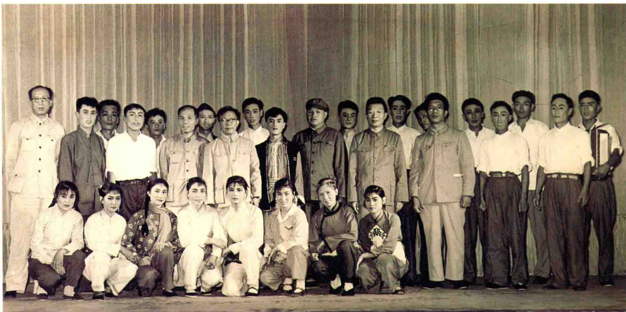
1965年12月，中共中央政治局委员、书记处书记、国务院副总理、中宣部部长陆定一来吉林视察，在观看吉林市群众艺术馆文化工作队演出时合影。