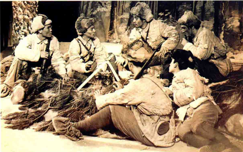
1959年1月，吉林市话剧团演出话剧《杨靖宇》剧照。