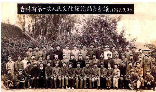
1951年7月30日，吉林省第一次人民文化馆站长会议全体代表合影。