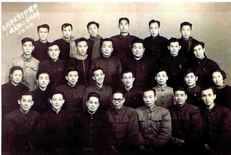
1960年12月15日，吉林市文艺干部训练班(戏剧班)全体合影。