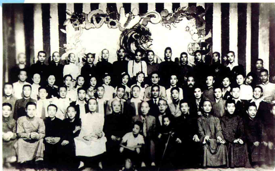
1954年1月，唐韵笙第六次来吉林演出，与吉林京剧院全体演职员合影。