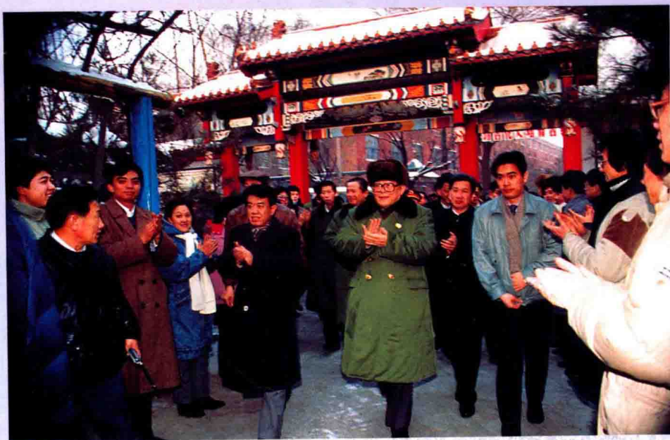
1991年1月10日，中共中央总书记、国家主席江泽民参观文庙博物馆。