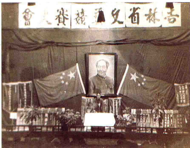
1950年吉林省文艺竞赛大会会场。