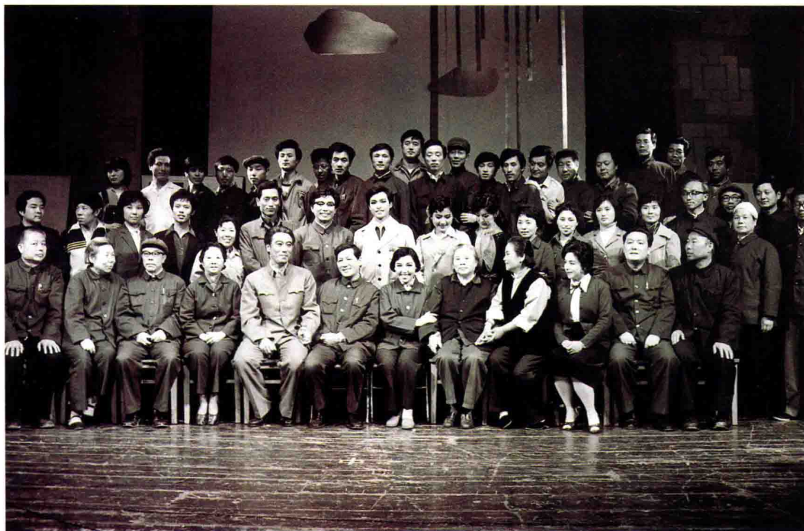
1982年5月，吉林市评剧团进京在中南海演出评剧《邻居》，康克清、倪志福等接见剧组演员。