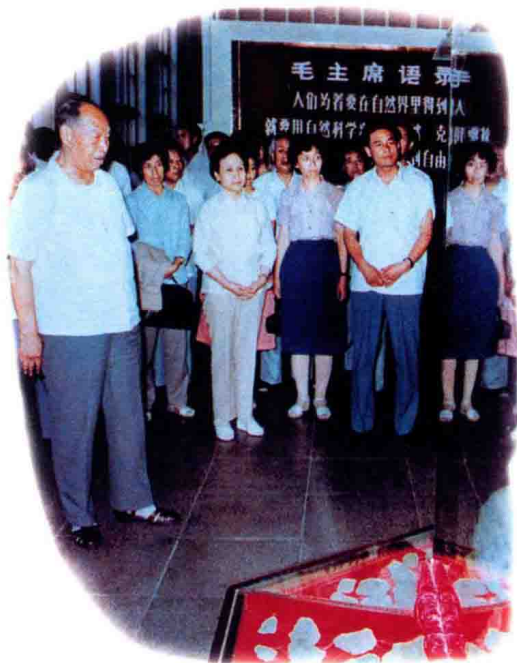
1984年，老一辈无产阶级革命家彭真在市博物馆观看陨石雨展览。