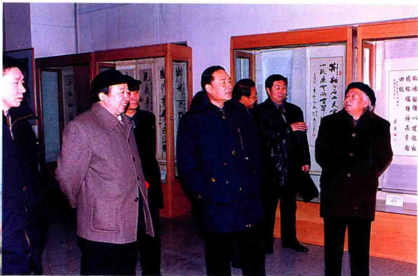
中共吉林省委书记王云坤，于1999年12月14日在市博物馆参观金意庵书画艺术馆。