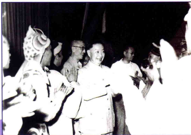
1960年7月，吉林市京剧团赴北京演出《龙潭燕》，京剧大师梅兰芳接见全体演员。