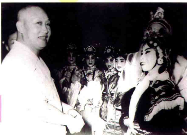
1960年7月，吉林市京剧团赴北京演出《龙潭燕》，著名京剧演员荀慧生到后台看望剧组演员。