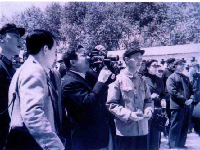
1972年5月，柬埔寨国家元首诺罗敦·西哈努克亲王和夫人，在全国人大常委会副委员长徐向前陪同下，到吉林市参观访问。在游览市容时，亲王高兴之余执机拍照。