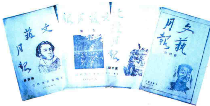
1948年10月19日，由吉林文联创办的《文艺月报》。