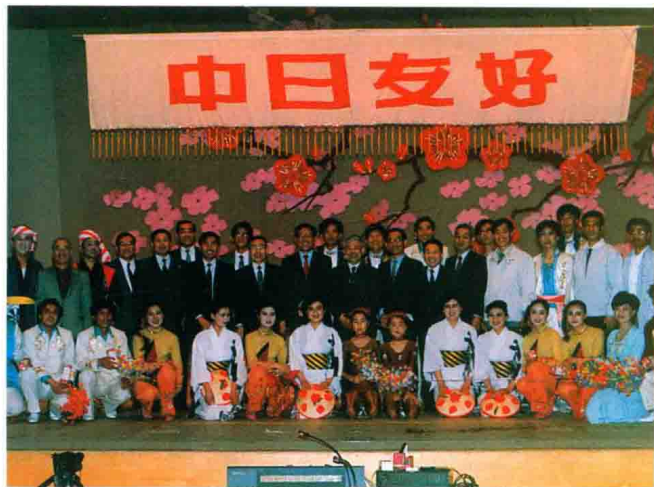
1989年5月，吉林市歌舞团访问日本演出。