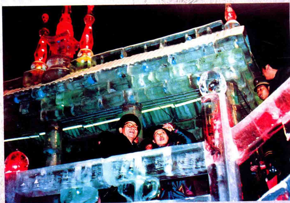
1992年1月18日，中共中央政治局常委、全国政协主席李瑞环在江南公园观赏冰灯。