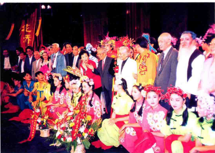
1996年10月，吉林市歌舞团在北京为第四届世界妇女大会演出音乐剧《秧歌浪漫曲》。全国人大常委会副委员长雷洁琼、全国政协副主席朱光亚、原全国人大常委会副委员长黄华及文化部常务副部长高占祥接见全体演员。