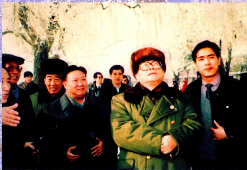
1991年1月10日，中共中央总书记、国家主席江泽民在松花江畔观赏雾凇。

一九九一年一月第三次到吉林旧地重游倍感亲切 恰逢雾凇奇景满城冰挂欣然秉笔 写下“寒江雪柳玉树琼花吉林树挂名不虚传” 一九九八年三月“两会”期间吉林同志索句京华 忆及旧景思于今事吟成七绝二首。