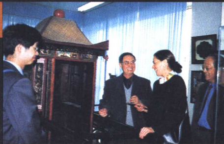
世界计划生育学会主席参观中国古代性文化博物馆（2002年11月）

悠久的性文化。现在我所收藏的性文物增加了10倍，当然对研究会增加许多新内容，得出许多新结论。例如，10年前，对中国古代的人造阴茎我一个也没有，而现在已有10多个了，最古老的是距今3500年前的，这证明至少在3500年前中国就有这种东西了，此外还有汉代的、辽代的、明代的、清代的以及民国的，在过去这个东西怎么那么流行？其中有许多社会原因可以挖掘。