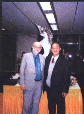
作者近影。左为世界性学会主席考尔曼博士（1998年11月，汉城）