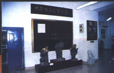
中国古代性文化博物馆入口处

这10年来，我所搜集的性文物，已从200多件发展到2300多件了，新的资料也涌现出不少。通过文物，能雄辩地说明历史，例如许多外国人，也包括许多中国人，都认为中国的古人在性方面是愚昧、落后的，可是把那么多性文物一摆，使人们不得不改变原来的看法：中国古代人的性生活是多么丰富多彩、生动活泼，中国有丰富的、悠久的历史，其中自然也包括丰富而