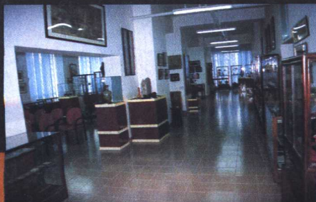
中国古代性文化博物馆一角

在中国古代性文化的研究进程中，10年来一个很大的变化是，1993年，我在上海第一次公开举办中国古代性文化展览，但这10年间，我已经在中国大陆的19个城市举办过，而且