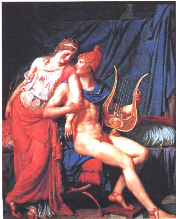
油画：特洛伊王子派里斯与斯巴达王后海伦之恋

例如，在大约2500年前，古斯巴达和特洛伊是两个相邻的、友好的国家。有一次，特洛伊王子