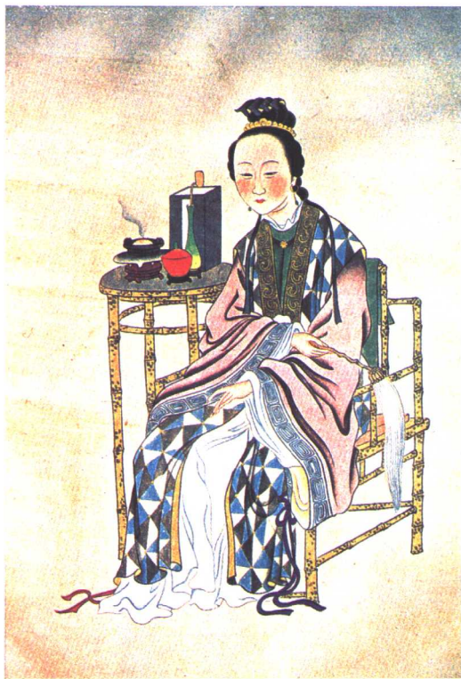
陈圆圆画像（中年时期，清初）