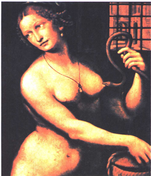
油画：埃及艳后克丽奥派脱拉最后因安尼兵败，以毒蛇咬乳头而自杀

这时，一小撮法国士兵来了，他们是占领军，其中一个叫德鲁埃的中士看中了一个刚出嫁的年轻妇女，扑上前去，肆意侮辱。这个妇女的丈夫正在旁边，怒不可遏，拔出刀来，将德鲁埃刺死。当这些法国士兵扑向这个年轻的西西里人，企图救他们的同伙时，发