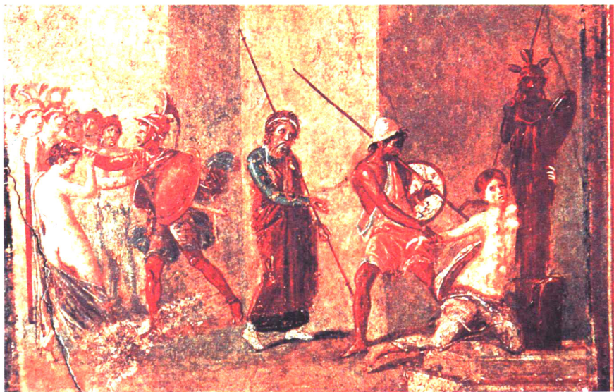
油画：攻破特洛伊城以后

派里斯对古斯巴达进行访问，见到了斯巴达王后海伦。派里斯年轻英俊，海伦是个绝代佳人，两人一见倾心，最后海伦和派里斯私奔了，由此爆发了一场战争。这场战争打了10年，双方先后出动了100多万军队（这在两千多年前人口不多的情况下简直是世界大战了）、上万艘战舰，可谓惊天动地。