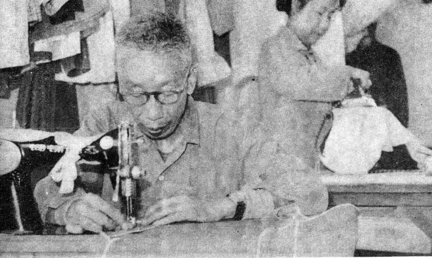
13. 根据服装设计师的设计，老师傅正为演员赶制戏装。在演员众多，剧情时间分春夏秋冬的情况下，光制作服装就得好几个月。