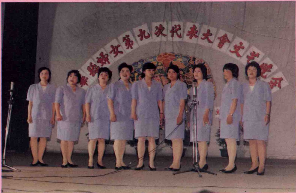
县妇联全体干部在五华县妇女第九次代表大会文艺晚会上合唱《红色娘子军军歌》。