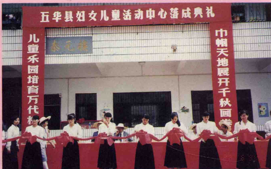
五华县妇女儿童活动中心剪彩仪式。