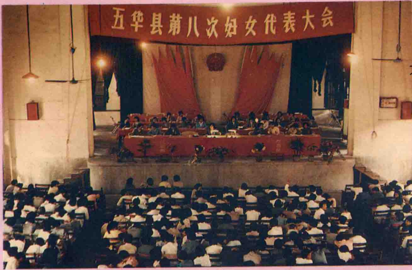
五华县第八次妇女代表 大会会场全景