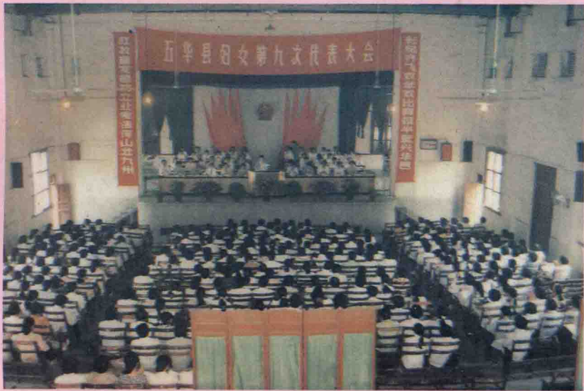
五华县妇女第九次代表大会会场全景。