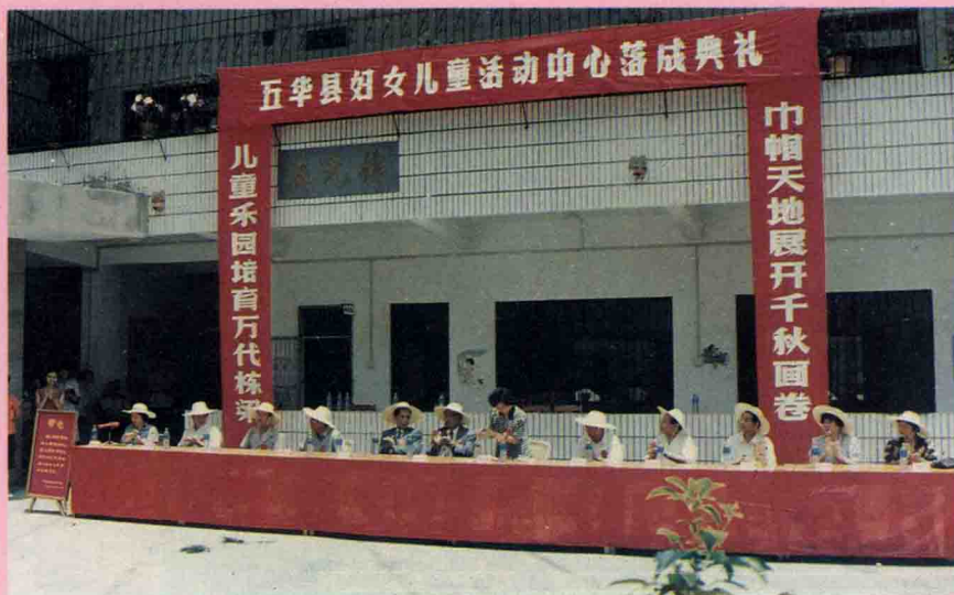
五华县妇女儿童活动中心于第二届荔枝节期间落成剪彩。图为主席台。