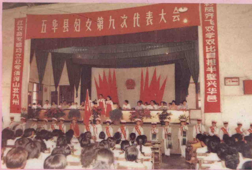
五华县妇女第九次代表大会开幕式前少先队仪仗队敬礼。