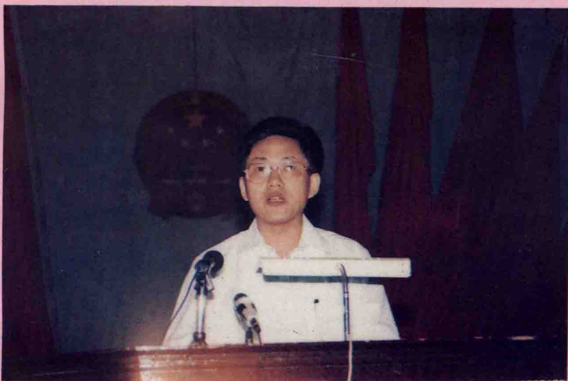
县委书记曾宪潭在五华县妇女第九次代表大会上的讲话。