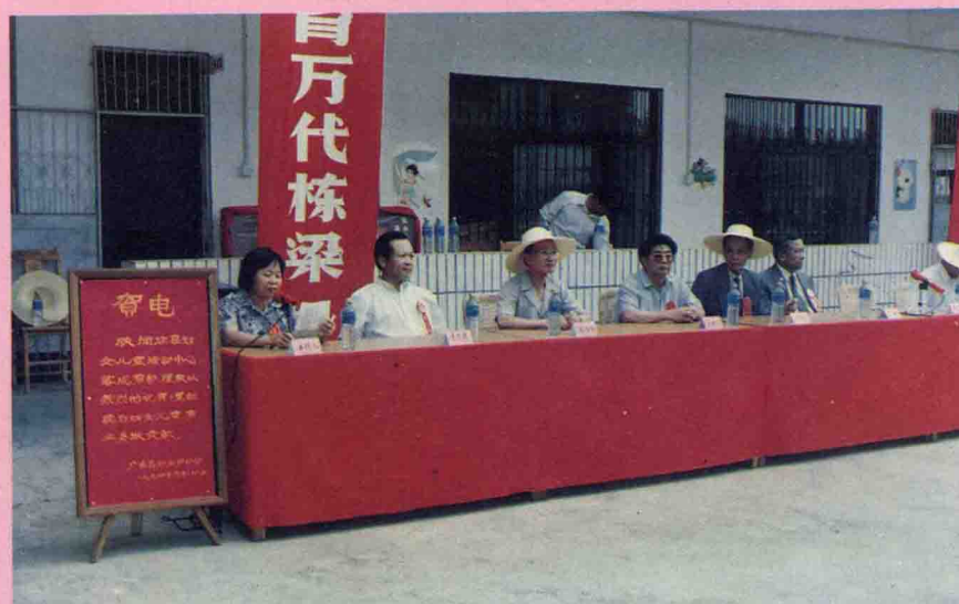
广东省妇女联合会贺电五华县妇女儿童活动中心落成剪彩。