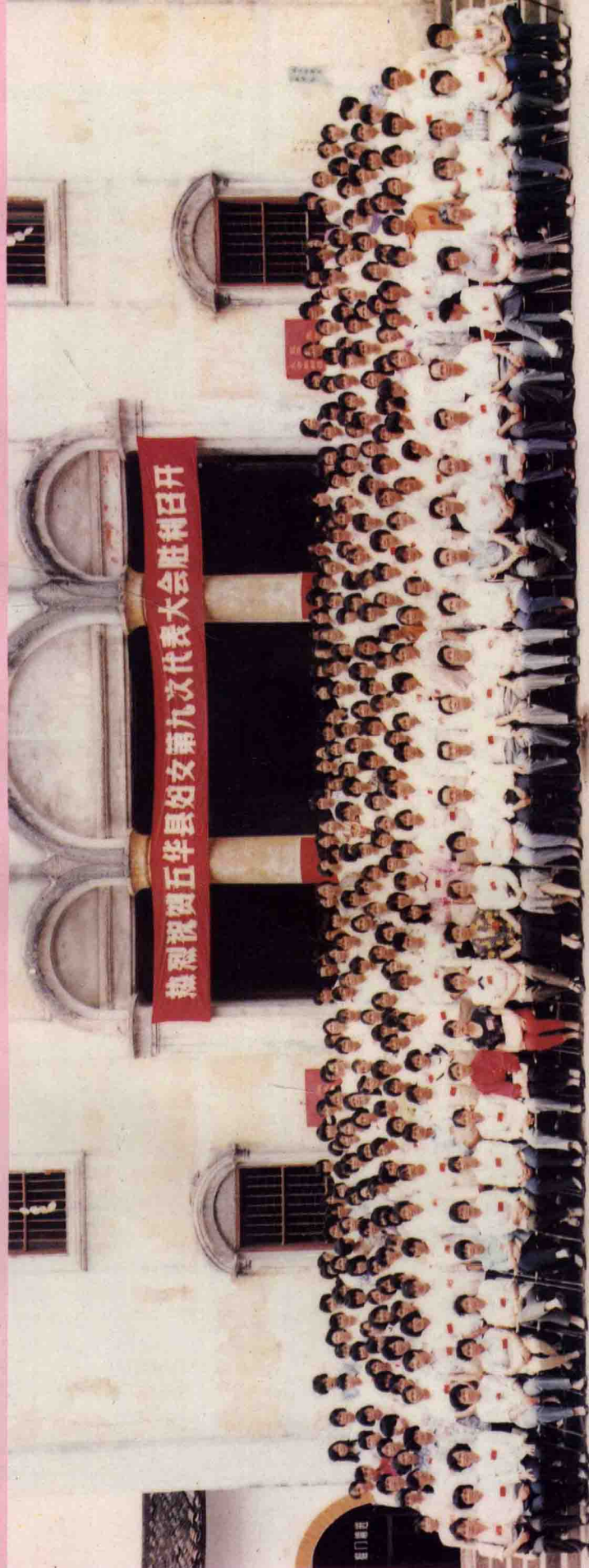
县领导和五华县妇女第九次代表大会全体代表、工作人员合影