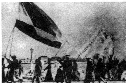
1920 年 9 月，为寻求救国真理，邓小平乘坐法国邮船“盎特莱蓬”号赴法勤工俭学。