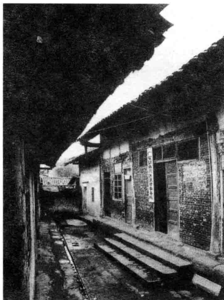
邓小平童年时就读的协兴乡初级小学旧址。

dèng xī xián shì xī wàng 邓希贤，是希望 tā chéngwéi yí gè yǒuxián 他成为一个有贤 dé de rén 德的人。