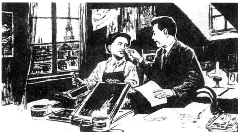
在一间只有5平方米的小房间里，邓小平成为“油印博士”。

chìguāng yǐ zì jì qīngxiù zhuāngdìngzhěngjié ér 《赤光》以字迹清秀、装订整洁而 dé dào le dà jiā de chēng zàn yú shì dèngxiǎopíng bèi qīn 得到了大家的称赞。于是，邓小平被亲 qiè de chēng hū wéi yóu yìn bó shì 切地称呼为“油印博士”。