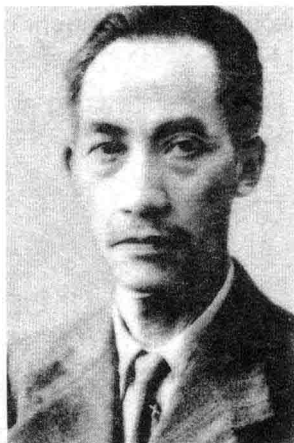
1918 年，革命家、教育家吴玉章在重庆创办了留法勤工俭学预备学校。