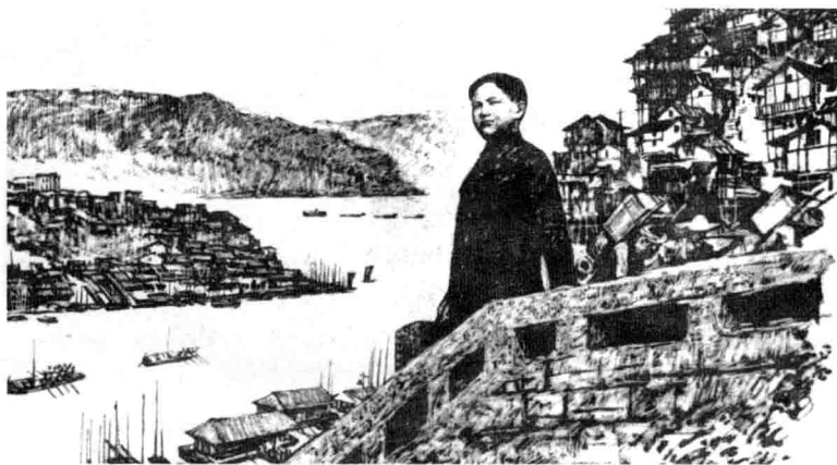
1920年，16岁的邓小平离开重庆，走上一条追求真理的道路。

kǒu dèngxiǎopíngshì qí zhōngniánlíngzuìxiǎode yí gè nián 口。邓小平是其中年龄最小的一个，年 jīn suì cóng cǐ tā zǒushàng le jiù guó jiù mín qiú zhēn 仅 16 岁。从此他走上了救国救民求真 lǐ de dào lù 理的道路。