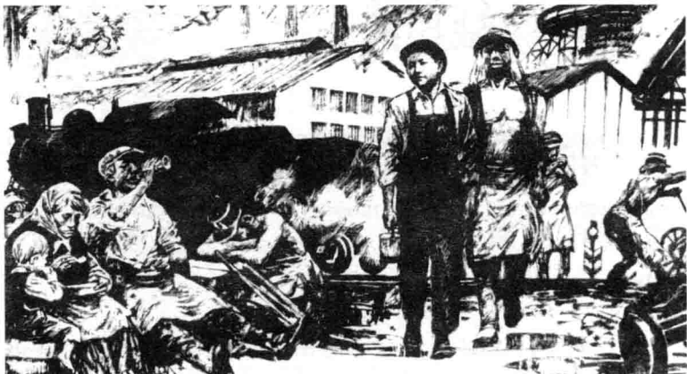
在法国工厂做工，邓小平体验到了生活的艰辛。

zài hòu lái de rì zi lǐ dèng xiǎo píng zuò guò yà gāng 在后来的日子里，邓小平做过轧钢 gōng rén zhì shàng gōng rén lín shí xìng de zá gōng hái dào 工人、制扇工人、临时性的杂工，还到