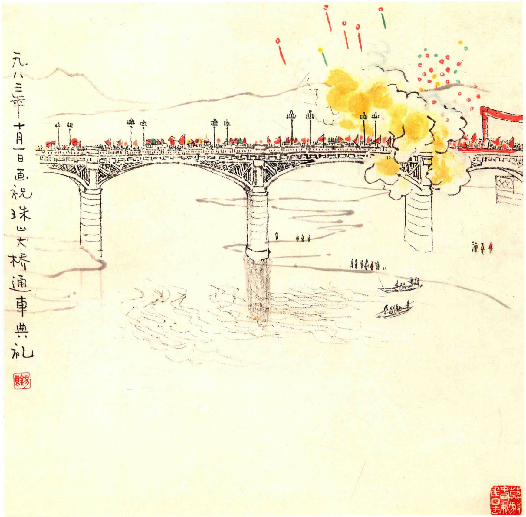
珠山大桥通车典礼