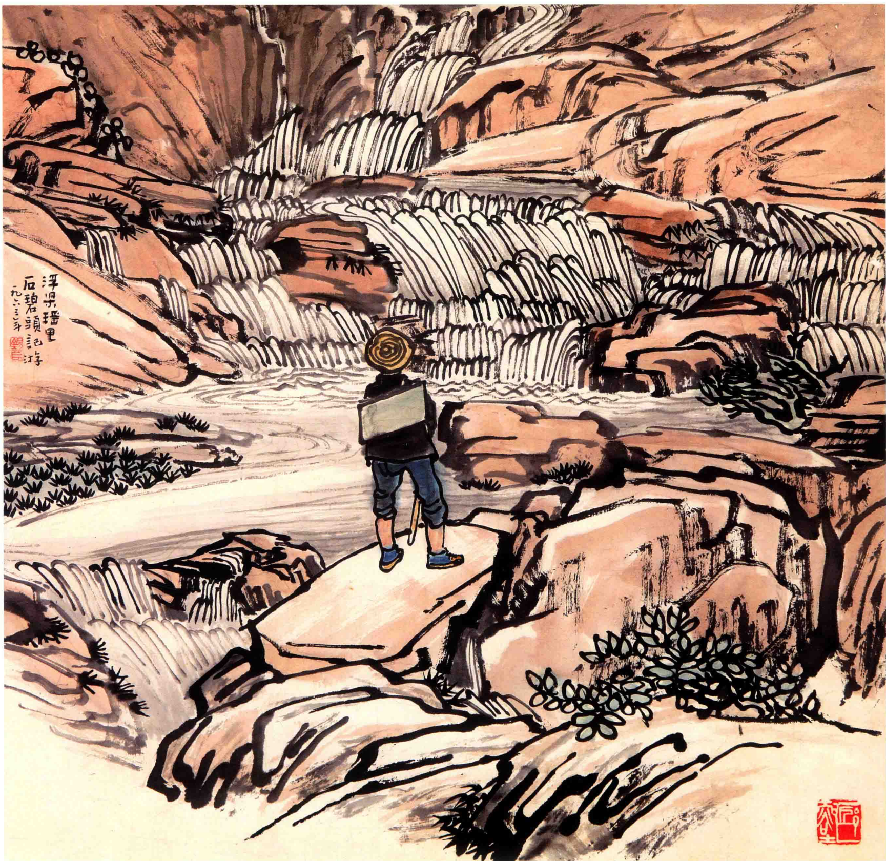
瑶里石碧头 锡良写生自画像