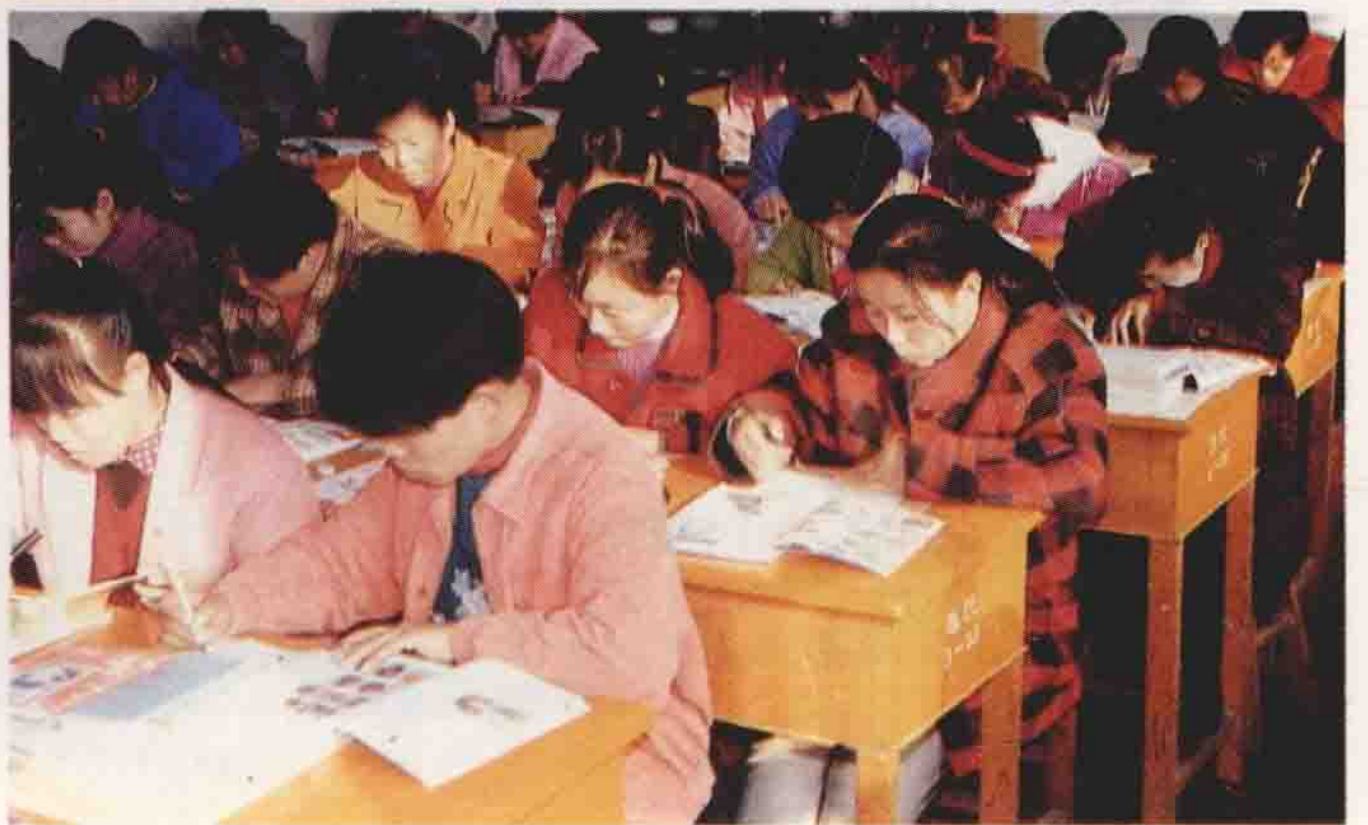
教师进修学校幼师 班学员在上美术课