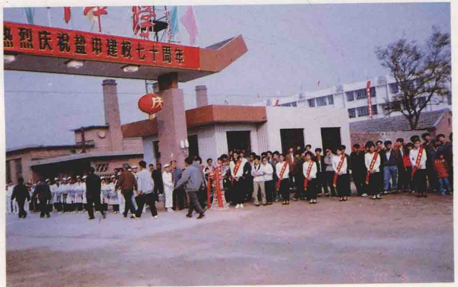
盐山中学 70 周年校庆迎宾仪式(1993年)