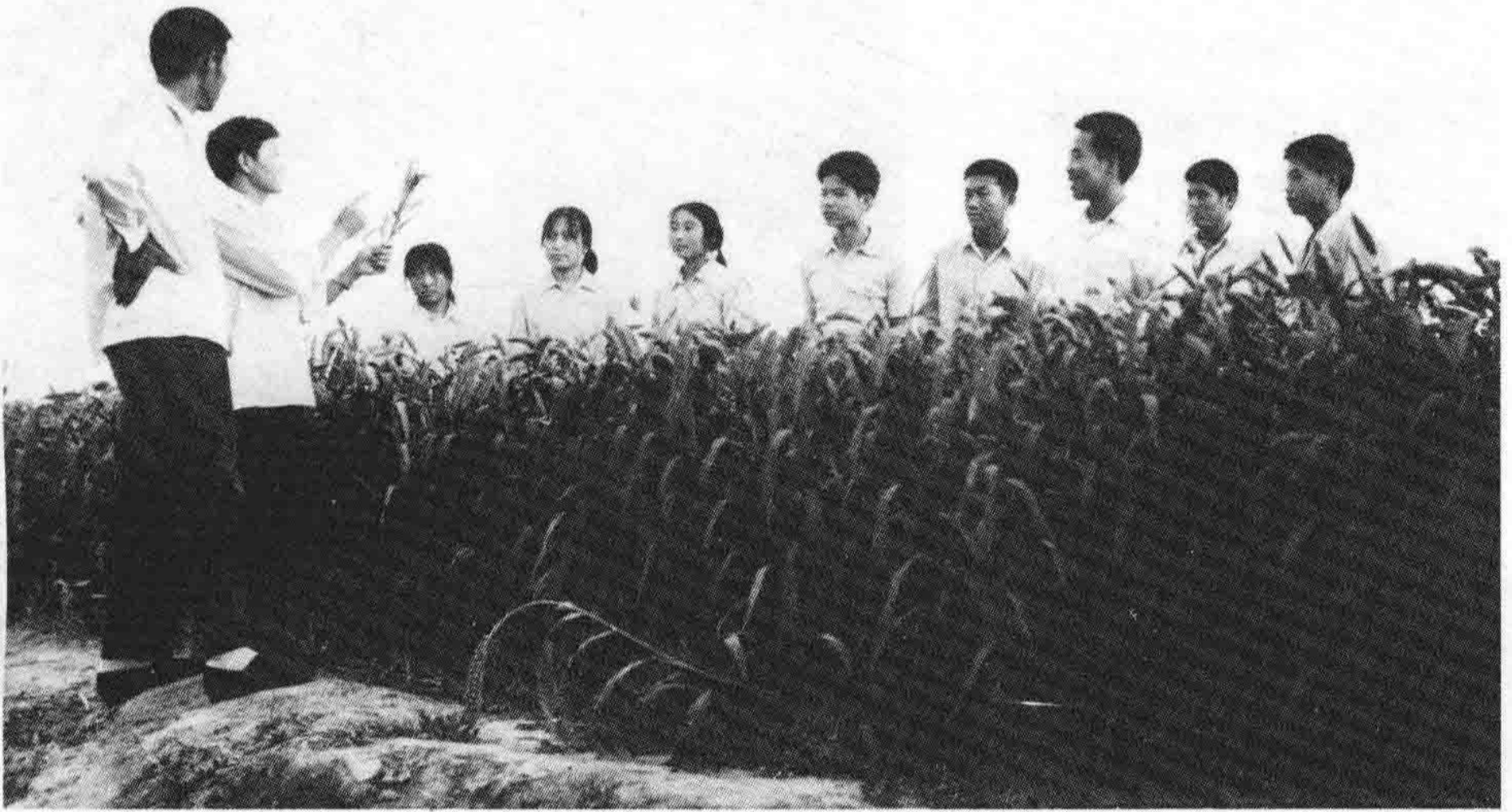
盐山农技中学田间授课