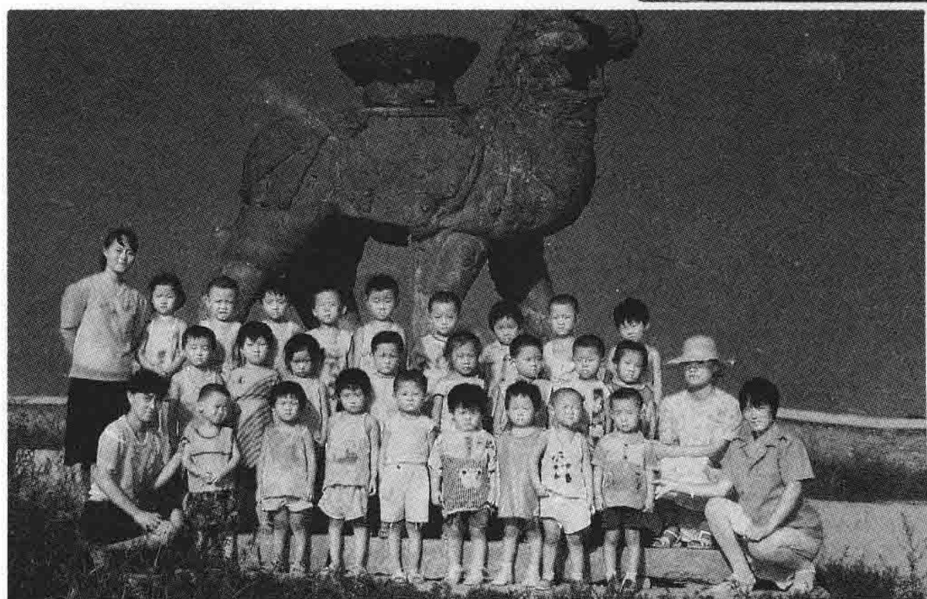
艳光幼儿 园教师带领幼 儿“一日游”留 影