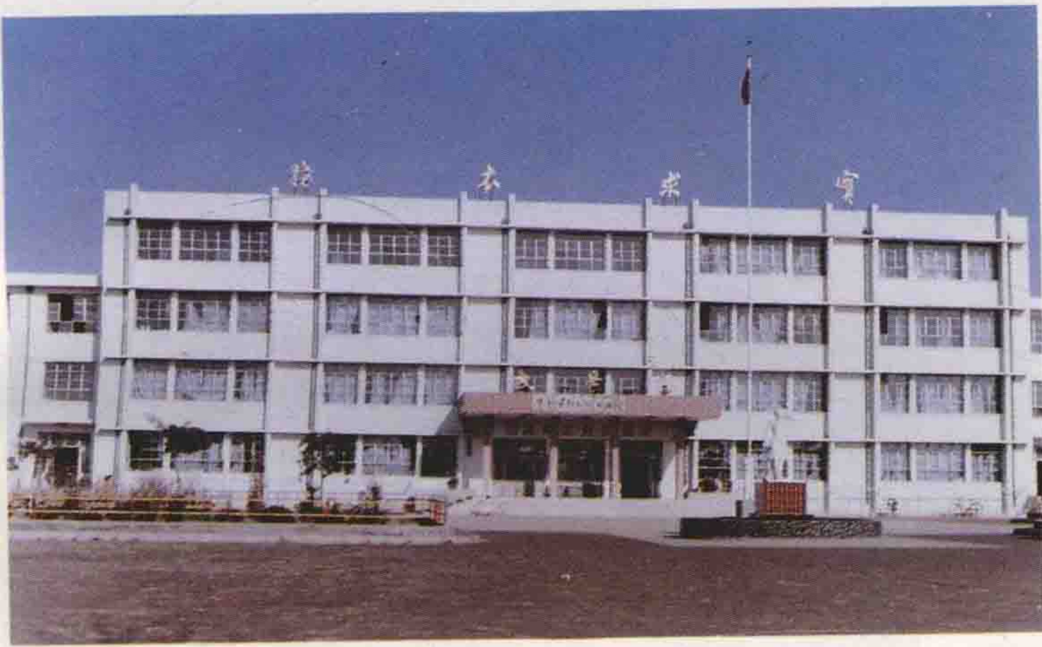
盐山中学教学楼(1992年建)