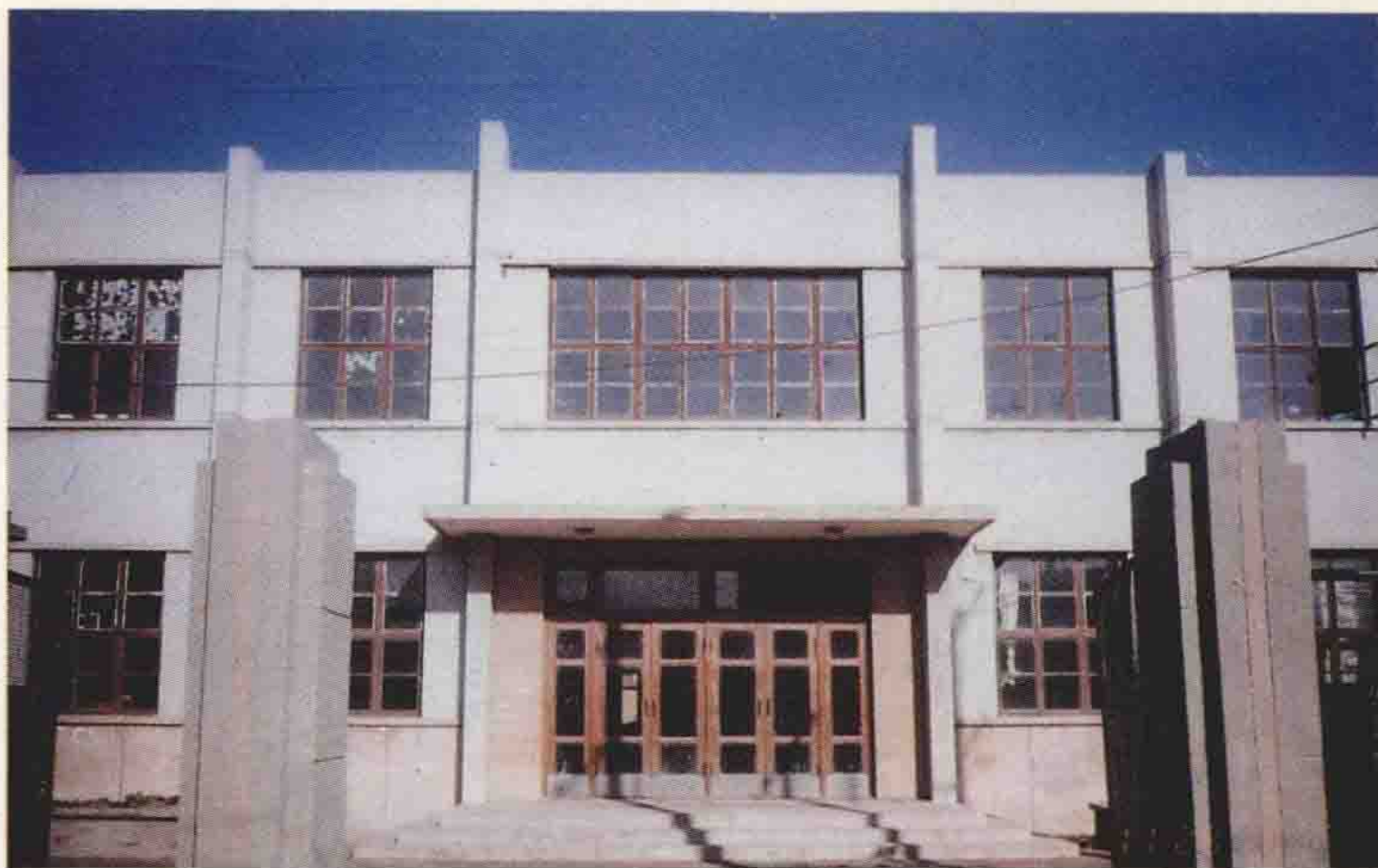
盐山县第一栋 教学楼——东关中 学教学楼(1986年建)