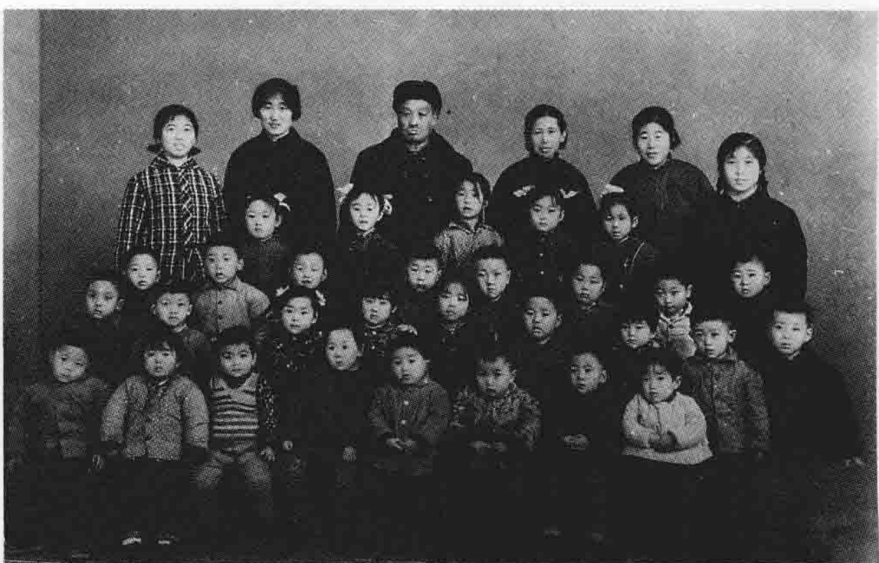
盐山县机关 幼儿园教师与幼 儿欢度 1972 年 元旦留影