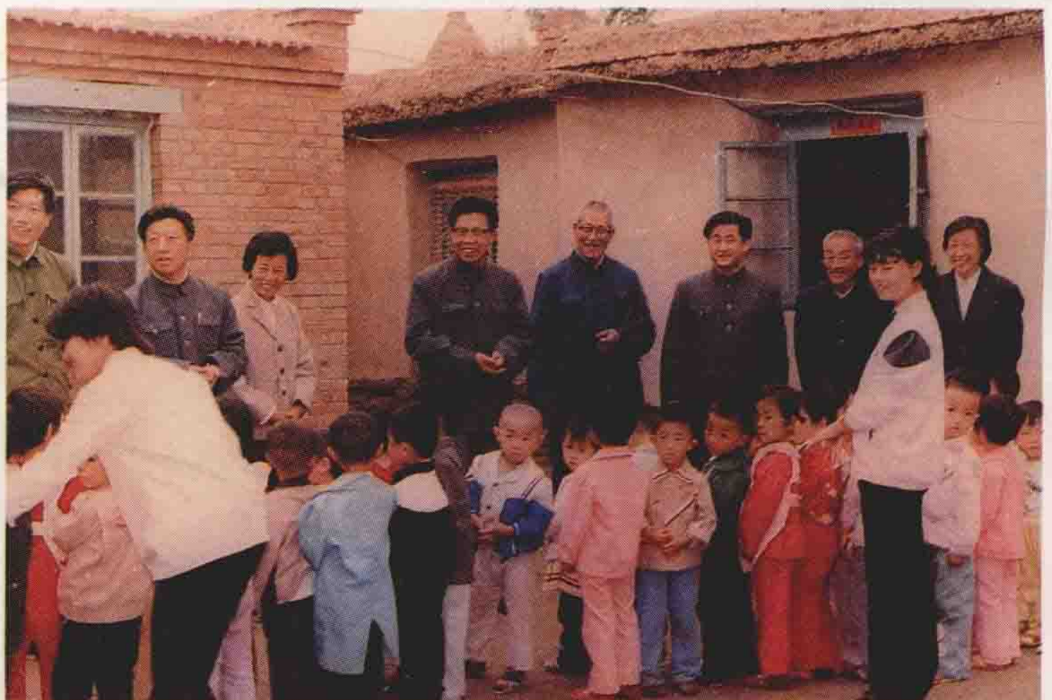
县委、人大、政府、政协、妇联等领导视察艳光幼儿园