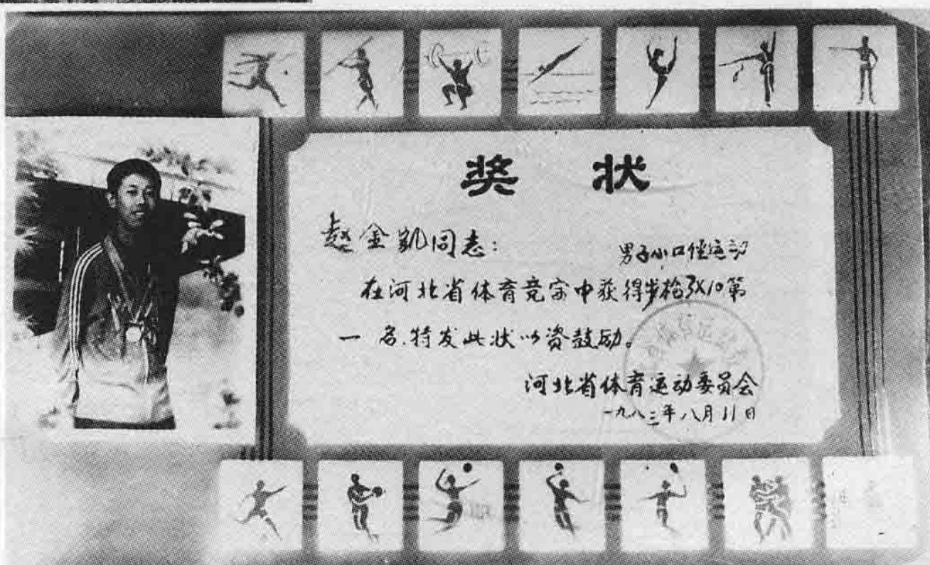
庆中射击运动员 赵金凯代表沧州地区 参加河北省体育竞赛 荣获第一名