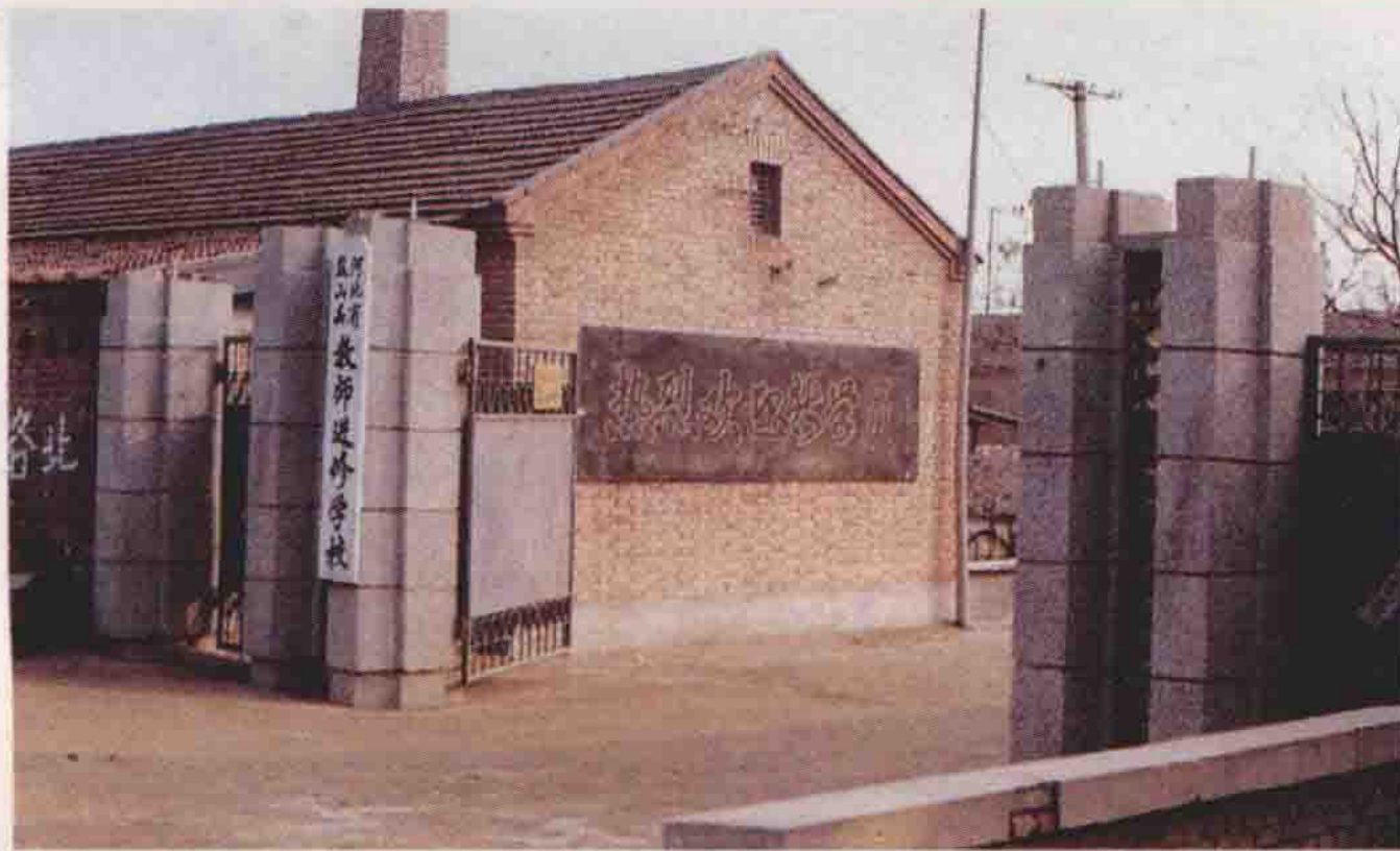
河北省盐山县 教师进修学校