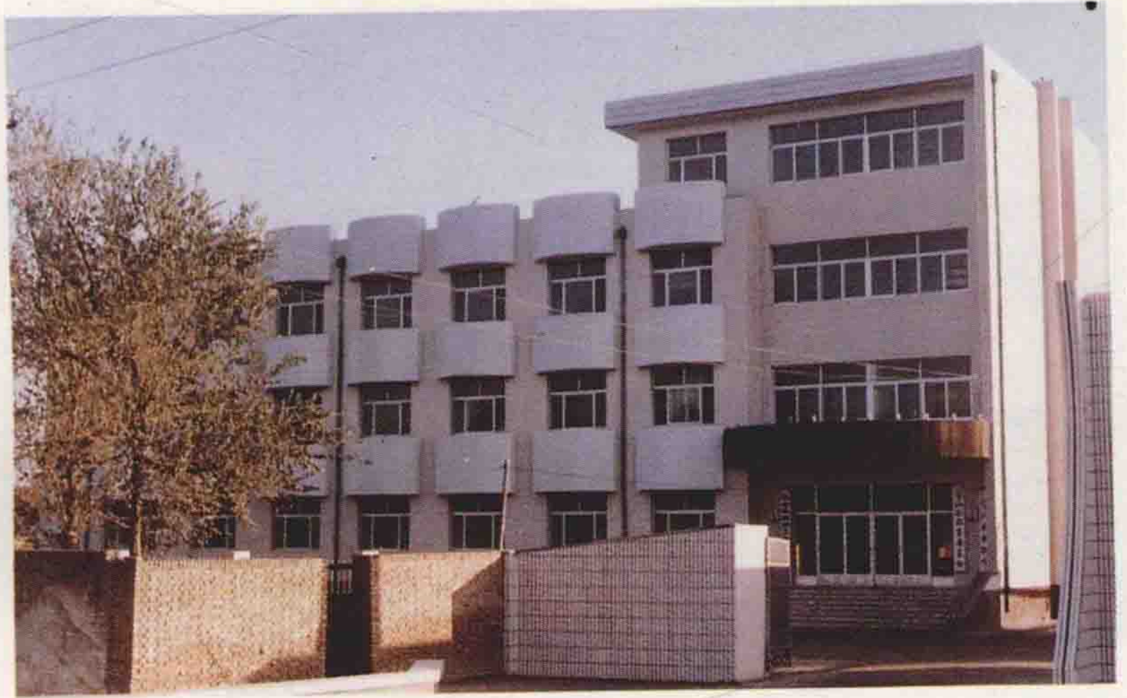
盐山县教育委员会办公楼(1992年建)