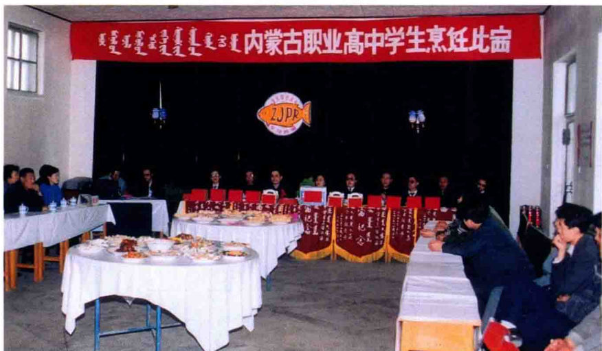
内蒙古职业高中学生烹饪比赛在呼和浩特市第一职业高中举行 (1991.5.5)