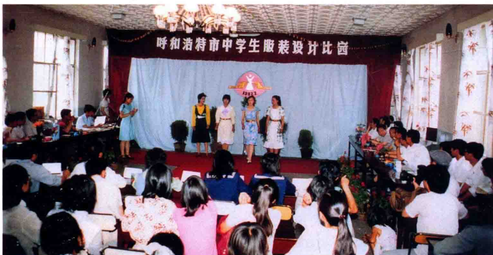
市职教中心举办全市首次中学生服装设计比赛 (1987.5)。