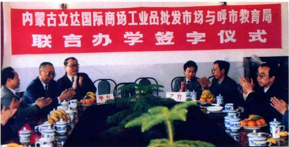
呼市教育局与用人单位签定联合办学协议（1993.4.1.）。