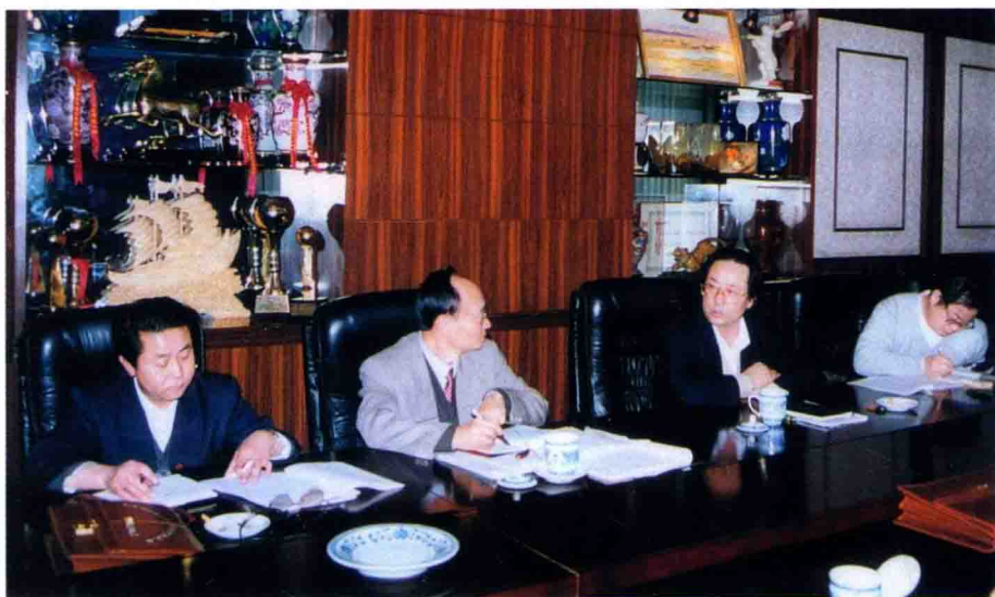
市委副书记、 市长冯士亮听取职 业教育工作汇报 (1997.3.4)。