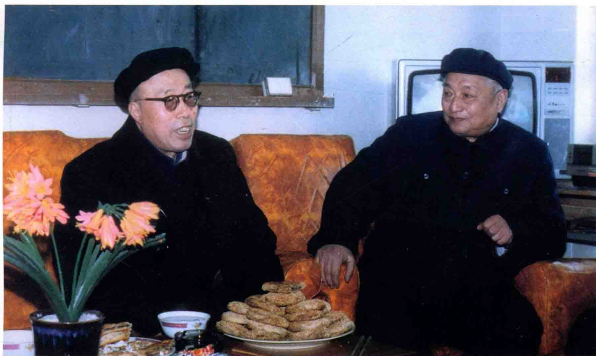
原自治区领导王铎与民族职业教育家巴静山老校长亲切交谈（1984.12）。