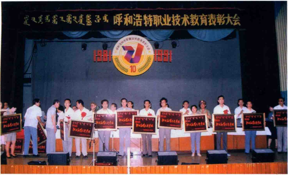
市政府隆重召开“呼和浩特市职业技术教育表彰大会”（1991.7.4）。