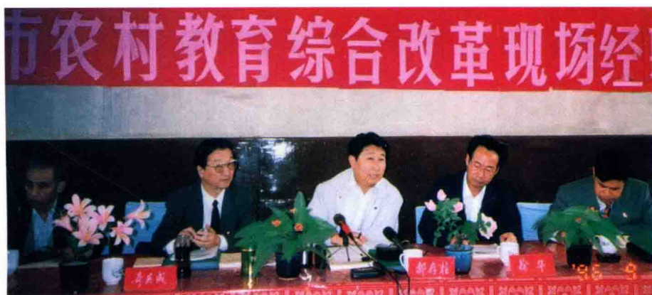
市有关领导在 “呼和浩特市农村 教育综合改革现场 经验交流会上 (1996.9.2)。