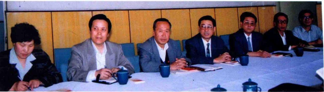
市教委领导专题研究职业教育发展问题（1997.5.）。