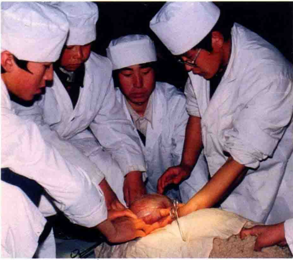
畜牧兽医专业师生在给牲畜做手术。