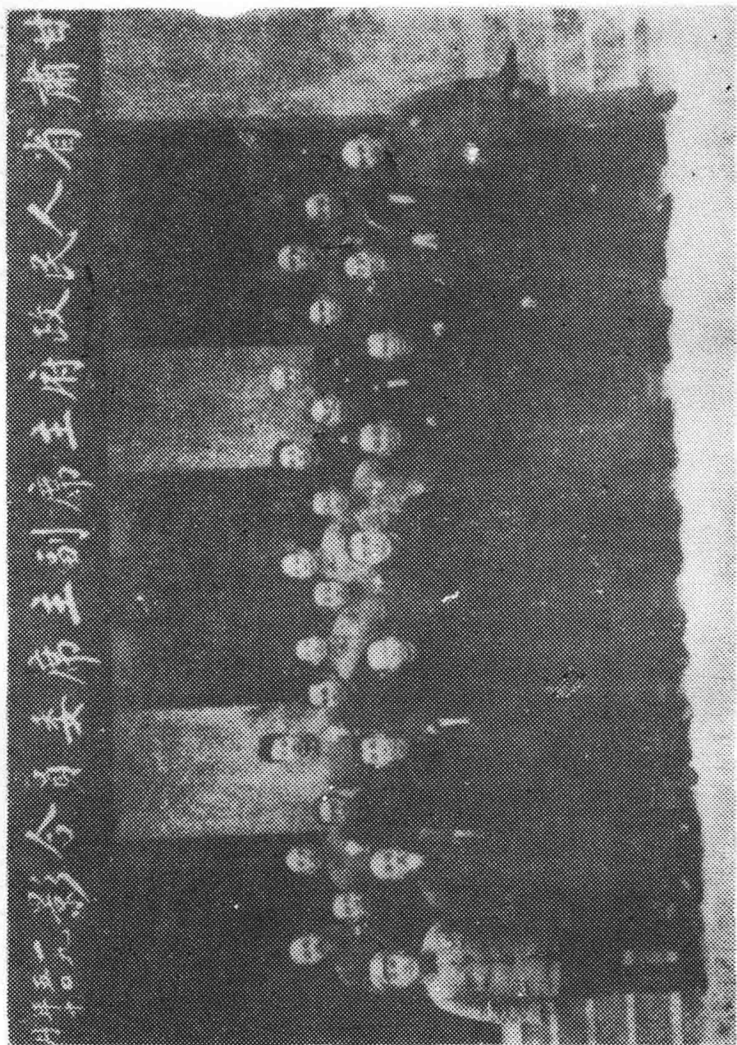
第四幅：首屆甘肅省人民政府主席、副主席、委員。