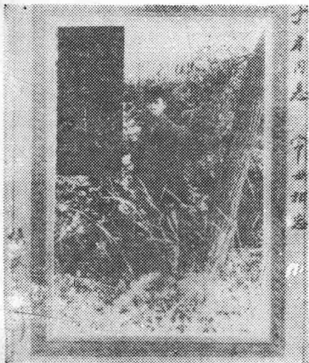
第一幅：大革命时期的中共甘肃省特别支部的创建人之一宣侠父同志。他是党在甘肃开展民族统战工作的创始人。这是他于1926年7月在兰州鸿泥沟的留影。