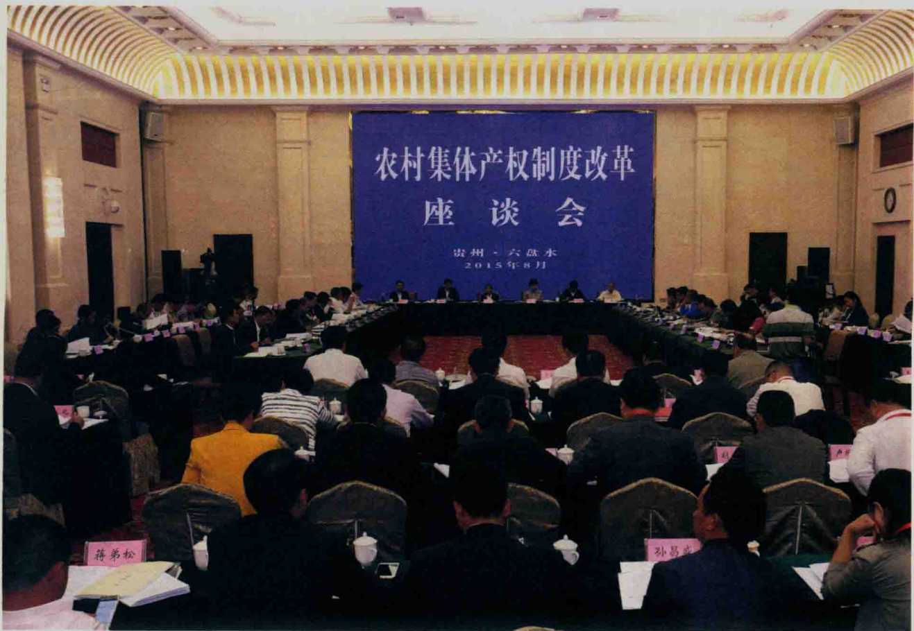
▶▶ 2015年8月25日，全国农村集体产权制度改革座谈会在六盘水召开。会上，全国有关知名专家、学者对六盘水“三变”改革给予高度评价