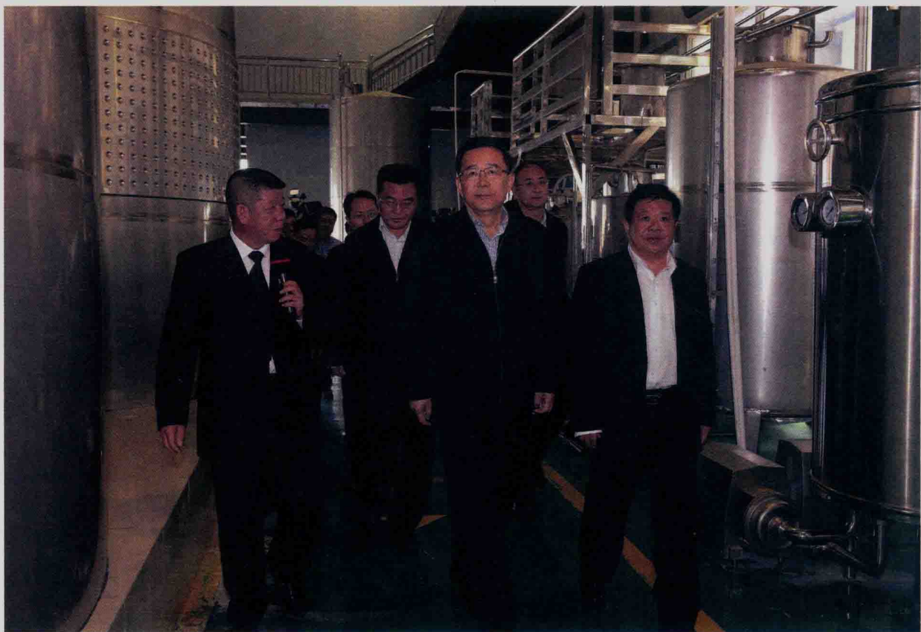
▶▶ 2015年11月7日，时任贵州省委副书记、代省长孙志刚在盘县天刺力食品科技公司考察