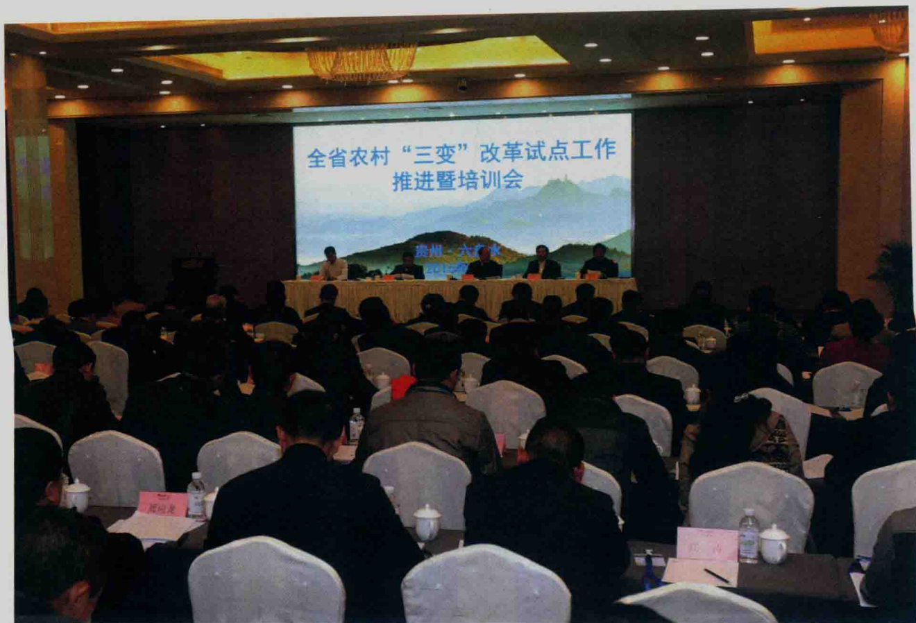
► 2016年3月24日至25日，全省农村“三变”改革试点工作推进暨培训会在六盘水召开，深入系统总结“三变”改革经验并加快在全省推广