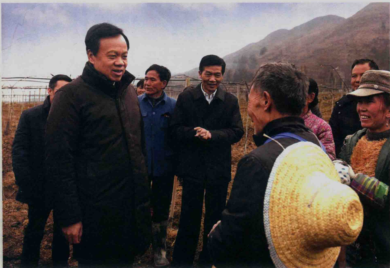
▶▶ 2016年2月17日至18日，贵州省委书记、省人大常委会主任陈敏尔到六盘水 专题调研“三变”改革工作