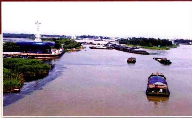
千里运河第一个水上服务区

发展的中心工作，坚持以招商引资工作为第一抓手，树立鲜明用人导向，以招商实绩重用干部，集中人力物力财力，集中全局精英骨干，一把手亲自靠前指挥，抓信息、抓跟踪、抓谈判、抓签约，实现了大项目的新突破。在连续7年荣获市委、市政府招商引资先进单位的基础上，又成功引进了中国第一、世界第八的江苏长电科技项目，计划总投资15亿元。中联物流保税库、天成气体项目一期、东方华材铝材等三个新开工建设项目顺利推进；德明针织、伟盛实业两个项目实现增资扩量。