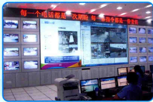
泗洪技防城项目公安指挥大厅，移动信息化助力平安城市建设