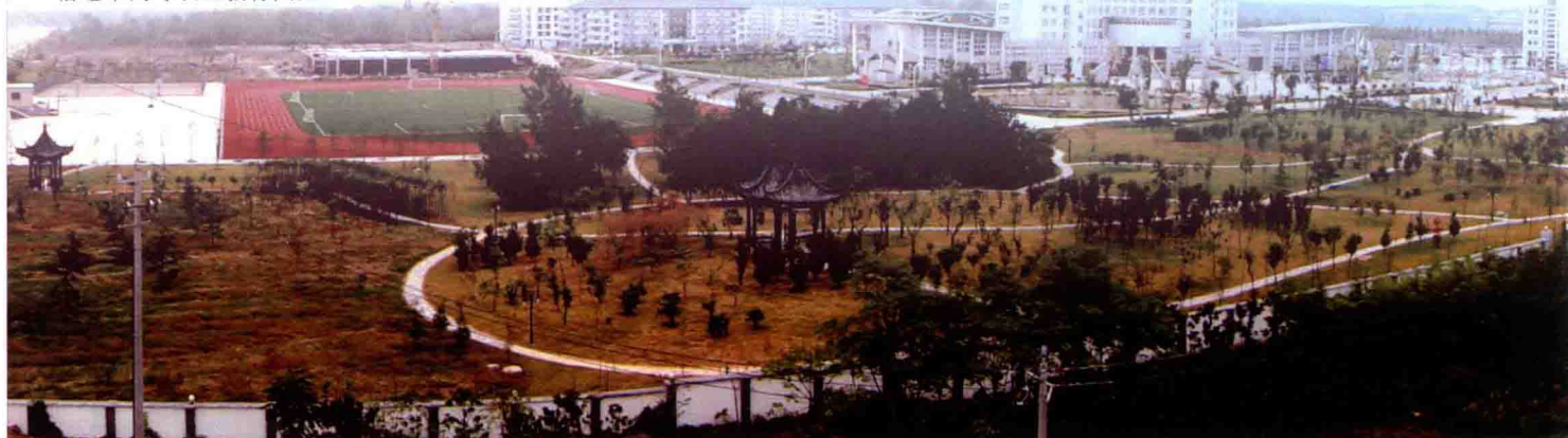
宿迁市高等职业教育园区

宿迁市湖滨新城于2006年2月经宿迁市人民政府批准设立，位于骆马湖东岸，是中心城市的重要板块。目前纳入统一规划与管理的区域面积120平方公里，辖晓店镇、祥和社区、嶂山林场，18个行政村（居），人口约6万人。湖滨新城总体规划由骆马湖旅游度假区、总部经济区、高等职业教育园区、软件和服务外包产业园、三台山风景名胜區、重点工业区等六个部分组成。2010年，主要经济指标增幅始终走在全市前列，全年实现业务总收入37.9亿元，同比增长111.9%；地区生产总值14.1亿元，同比增长53%；财政总收入4.02亿元，同比增长88%，其中一般预算收入1.81亿元，同比增长92%；500万元以上固定资产投资33.28亿元，同比增长66%；工业总产值34亿元，同比增长121%；工业销售收入32.85亿元，同比增长133%；规模以上工业增加值7.8亿元，同比增长180%；进出口总额5715万美元，同比增长139%。全面小康社会建设取得了重大进展，四大类18项25个指标中，已有19个指标提前达到小康目标。