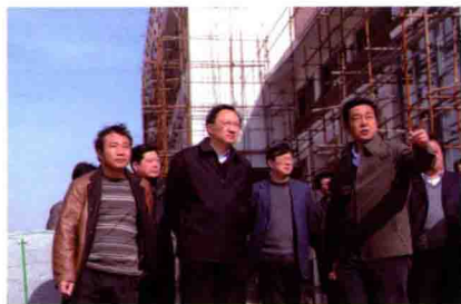
市领导缪瑞林、吕德明到湖滨新城调研