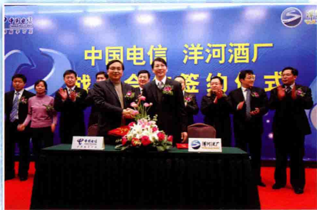
中国电信与洋河酒厂签订战略合作协议

此外，中国电信宿迁分公司在挂钩帮扶、目标管理、招商引资、党风廉政建设等方面均取得了较好成绩。