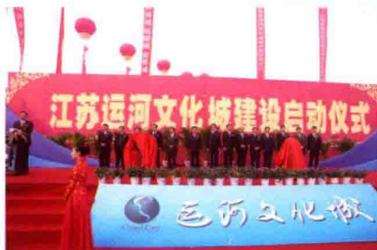
江苏运河文化城建设启动仪式