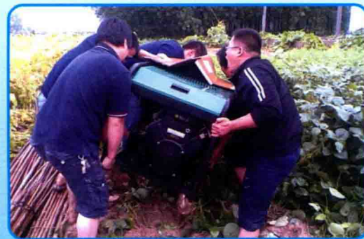
移动工作人员全力应对特大暴雨保通信畅通