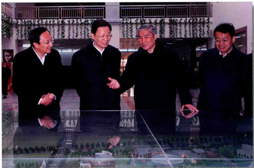
◎ 1月13日,省长李学勇(左二)视察宿迁