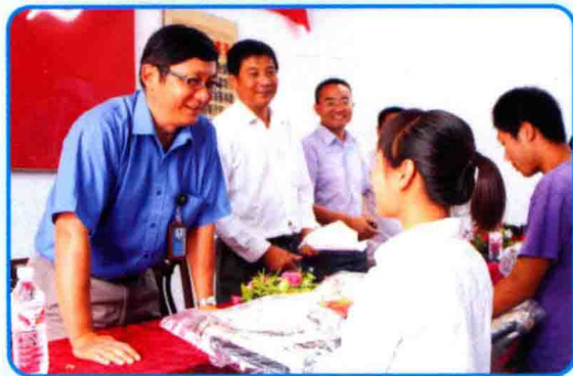
移动爱心助学现场