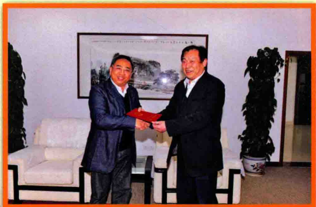
4月18日,市委常委、宿迁经济开发区党工委书记叶辉亲自为企业颁发土地使用证