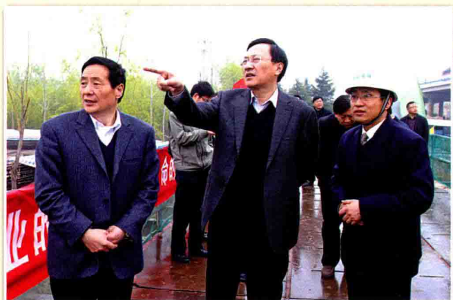
市领导缪瑞林、陈学平亲临交通工程建设一线视察