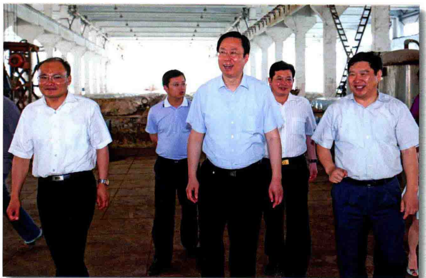
◎ 6月7日,市委副书记、代市长蓝绍敏(中)赴洋河新城调研