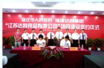
江苏达利食品有限公司签约仪式

宿迁市湖滨新城于2006年2月经宿迁市人民政府批准设立，位于骆马湖东岸，是中心城市的重要板块。目前纳入统一规划与管理的区域面积120平方公里，辖晓店镇、祥和社区、嶂山林场，18个行政村（居），人口约6万人。湖滨新城总体规划由骆马湖旅游度假区、总部经济区、高等职业教育园区、软件和服务外包产业园、三台山风景名胜區、重点工业区等六个部分组成。2010年，主要经济指标增幅始终走在全市前列，全年实现业务总收入37.9亿元，同比增长111.9%；地区生产总值14.1亿元，同比增长53%；财政总收入4.02亿元，同比增长88%，其中一般预算收入1.81亿元，同比增长92%；500万元以上固定资产投资33.28亿元，同比增长66%；工业总产值34亿元，同比增长121%；工业销售收入32.85亿元，同比增长133%；规模以上工业增加值7.8亿元，同比增长180%；进出口总额5715万美元，同比增长139%。全面小康社会建设取得了重大进展，四大类18项25个指标中，已有19个指标提前达到小康目标。