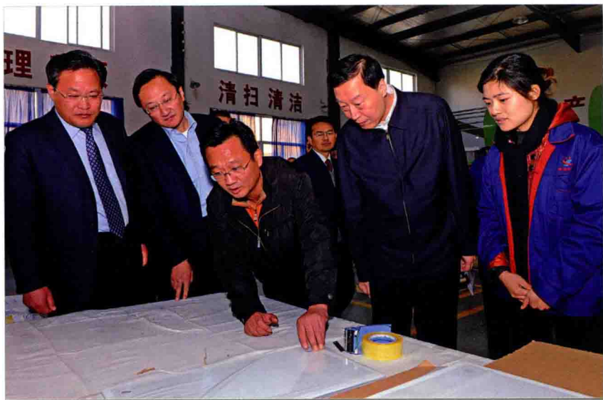
◎ 3月31日,省委书记罗志军(右二)视察宿迁