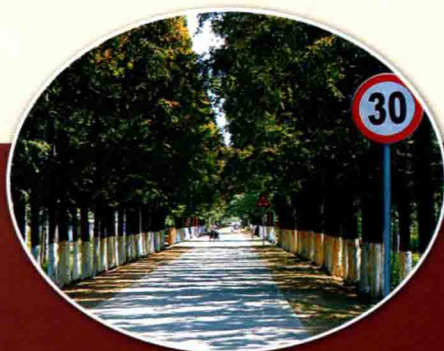
新建成的农村公路示范工程