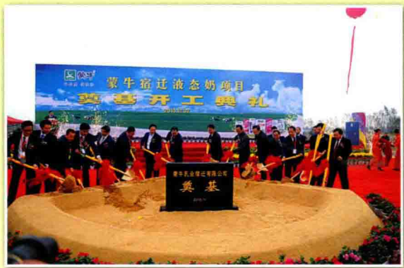
蒙牛液态奶项目开工奠基