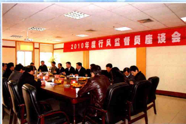
行风监督员座谈会