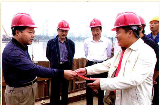
市领导许步健、陈学平慰问施工人员

筑桥铺路为人民,优质运输创一流。市交通运输局全体干部职工始终以舍我其谁的高度责任感和时不我待的紧迫感,勤勤恳恳、攻坚克难、自强不息、拼搏奉献,为全市交通快速发展争速度、赶时间,创造先决条件,对加快全市经济社会发展起到了重要促进作用。主要表现在四个方面。