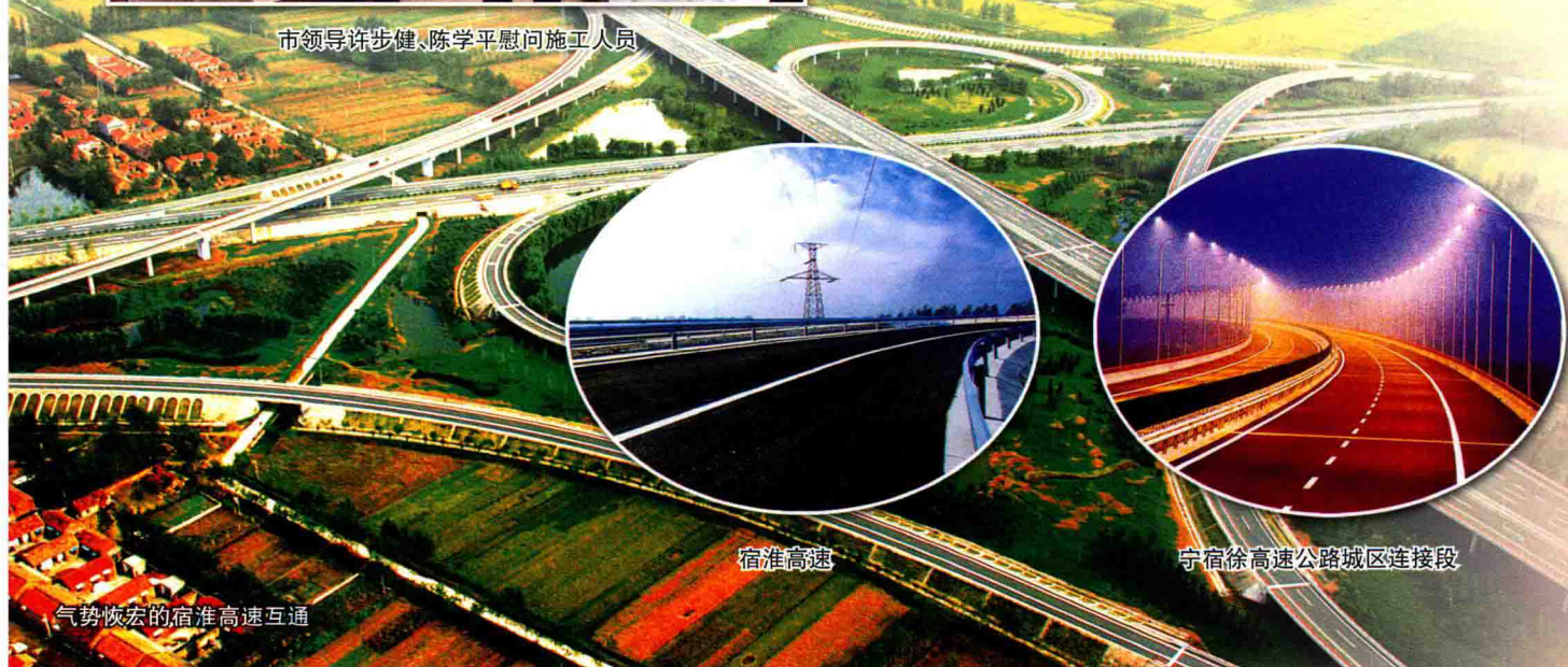
气势恢宏的宿淮高速互通