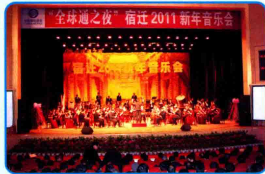
全球通新年音乐会为客户送去新年祝福