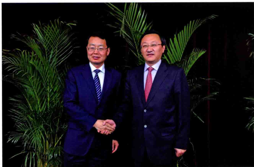
◎ 4月16日,在全市领导干部会议上,原市委书记张新实(左)与现任市委书记缪瑞林举行交接仪式