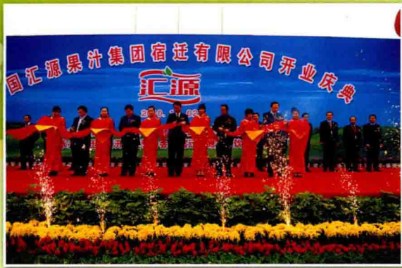
宿迁汇源开业庆典