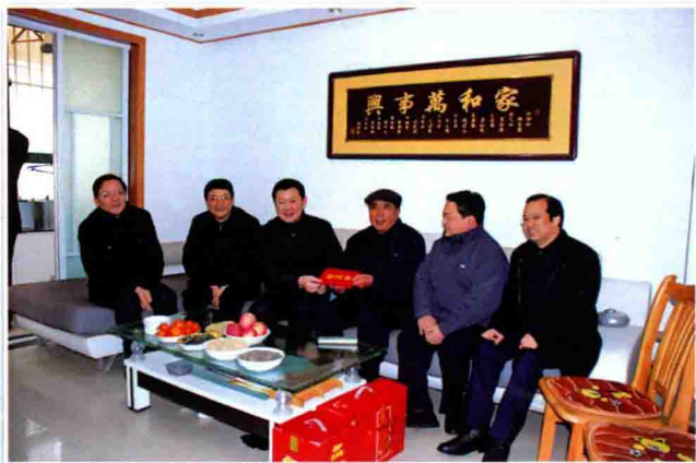
公司领导班子慰问离退休老干部

力阳光工程；与省移动危险源监控总站签订天翼车辆安全监控业务合作协议。承建的宿豫区肉鸡养殖监控项目得到了省政府和市委、市政府主要领导的高度评价，并作为高效农业示范工程在全市推广应用。自主开发的邻里求助业务和天翼 3G 信息采集系统社会认可效应显著，有力推动了“平安宿迁”创建工作的深入开展。