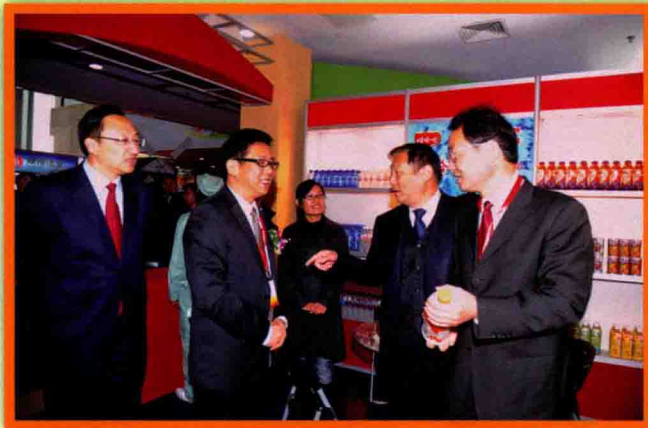
11月2日,市领导张新实、缪瑞林、叶辉和嘉宾参观开发区企业产品展示

1998年,和着市委、市政府“突破工业,走工业强市之路”的鼓点,宿迁经济开发区应运而生。