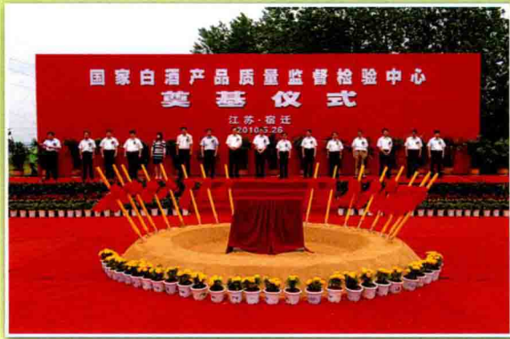
5月26日,国家白酒产品质量监督检验中心开工奠基