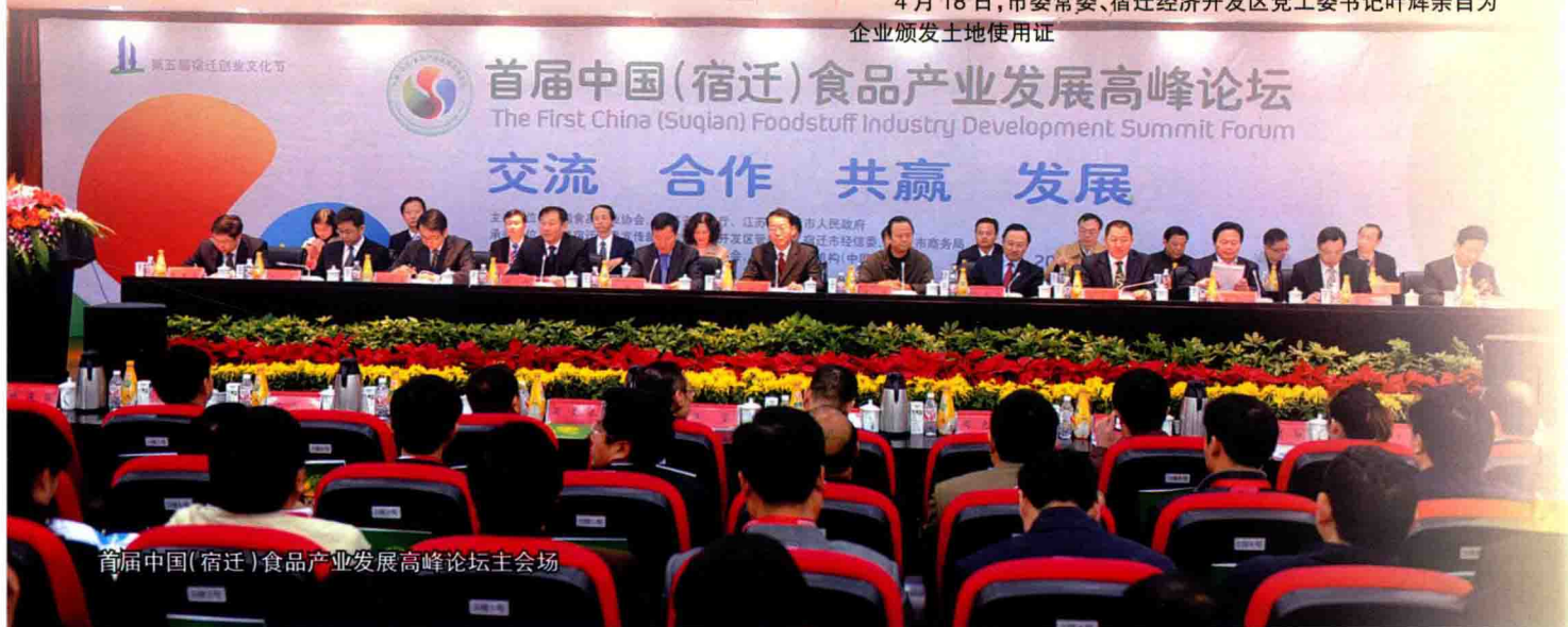
首届中国(宿迁)食品产业发展高峰论坛主会场