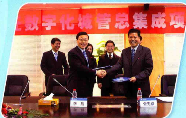
数字城管系统签约现场