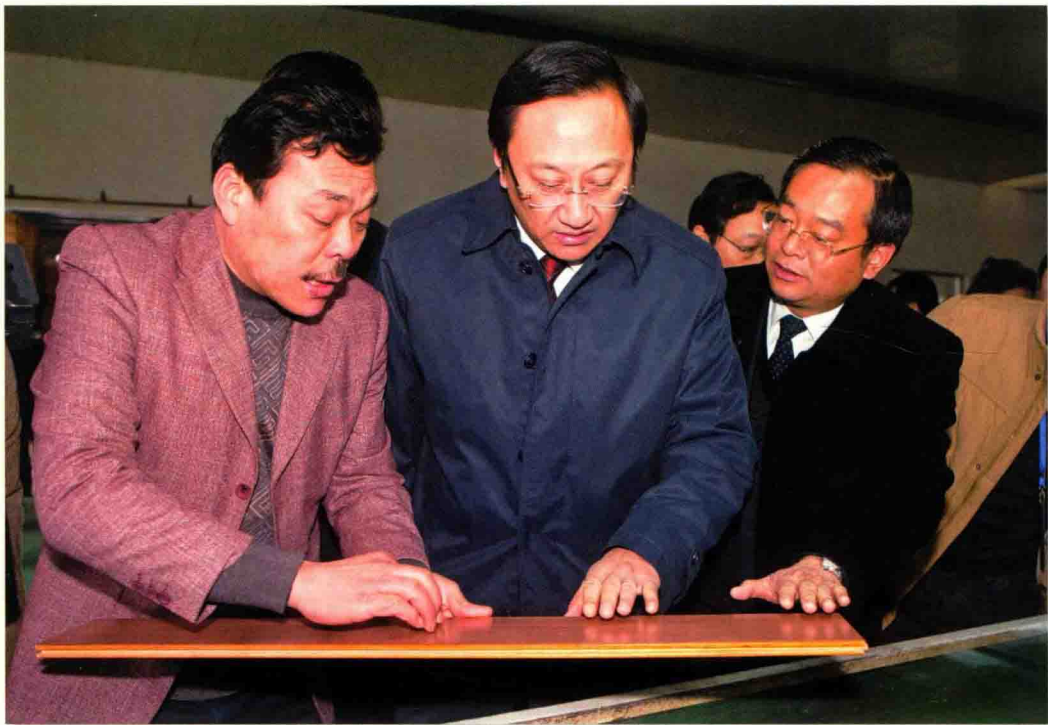
◎ 1月3日，市委副书记、市长缪瑞林（中）在市委工作会议上观摩泗阳县