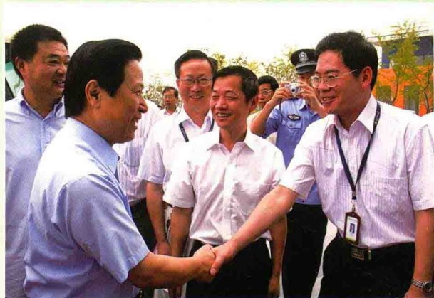
梁保华书记看望园区全体工作人员