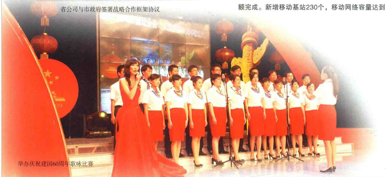
举办庆祝建国60周年歌咏比赛

全年累计完成基础通信建设投资2.82亿元，其中被列入市委重点督查工作和市政府为民办实事项目的C网工程建设、宽带网建设等项目均超额完成。新增移动基站230个，移动网络容量达到