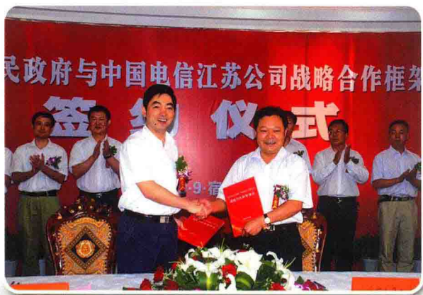
省公司与市政府签署战略合作框架协议

2009年，中国电信宿迁分公司在市委、市政府和省公司的正确领导下，在以“聚焦客户的信息化创新战略”的统领下，紧紧围绕“稳固网、融天翼、促增长”的发展主线，积极应对全业务运营带来的各种挑战，全面扎实地推进各项工作，企业发展、管理、创新等各方面均取得了长足进步与显著成绩。