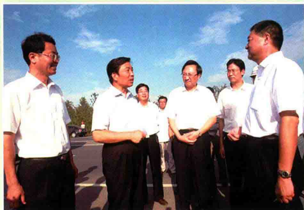
李源潮同志视察苏州宿迁工业园区