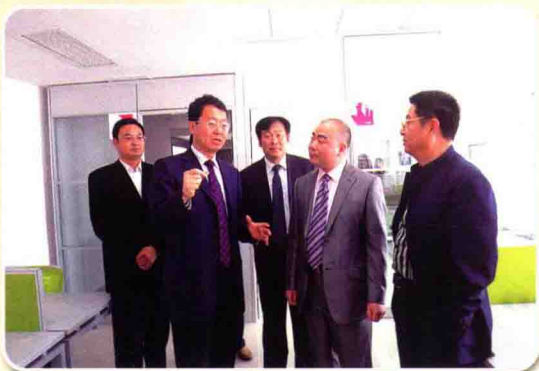
市委书记、市人大常委会主任张新实视察宿迁软件园企业

2009年，宿迁经济开发区在发展中促转变，在转变中谋发展，难中破困，危中寻机，逆中求进，逆势突破！