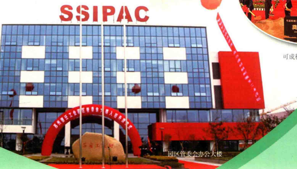
园区管委会办公大楼