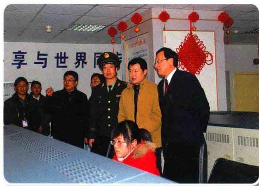
缪瑞林市长检查指导安全生产工作