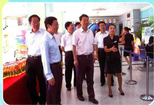
国庆当天，市委书记张新实一行慰问营业厅

公司大力推进创新型企业建设，使创新成为公司发展的源动力，在全省率先全面完成了TD三期建设工作；推行精细化管理，获“江苏省质量管理小组活动优秀企业”称号。立足移动信息专家，积极参