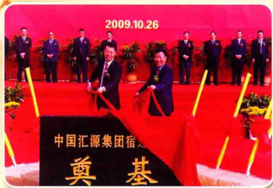
市委书记、市人大常委会主任张新实与北京汇源集团董事长朱新礼为项目奠基揭幕