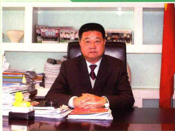
宿迁市副市长 苏宿工业园区党工委书记 管委会主任 沈小鹰