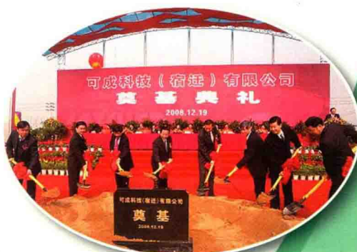
可成科技项目奠基仪式