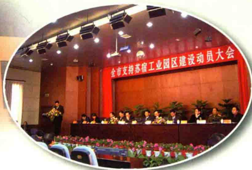
全市支持苏宿工业园区建设动员会