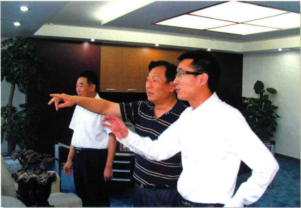
◎ 7月25日，市委常委、宿迁经济开发区党工委书记叶辉（中）在翔航塑业集团考察调研