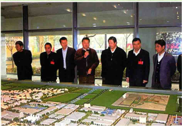
苏州党政代表团听取园区规划情况介绍