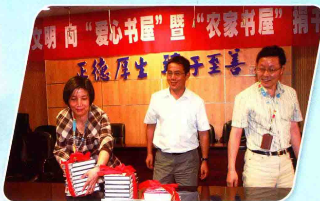
三位公司领导参加爱心捐书活动