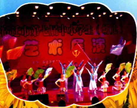
承办宿迁市中小学艺术展演活动

【打造宿迁均衡教育集团】学校采取集团化办学模式，集团内含本部共7所学校，学生14000余名，教师886人。几年来，校本部一方面总结一套可“打包输出”的优质管理经验作为后备支撑，另一方面创新形式，深入开展管理沟通、干部进驻、师资互派、联合教研、备课一体、定期送教、教学视导等活动，推进六家分校持续发展。学校被评为“江苏省千校万师支援农村教育工程先进学校”。