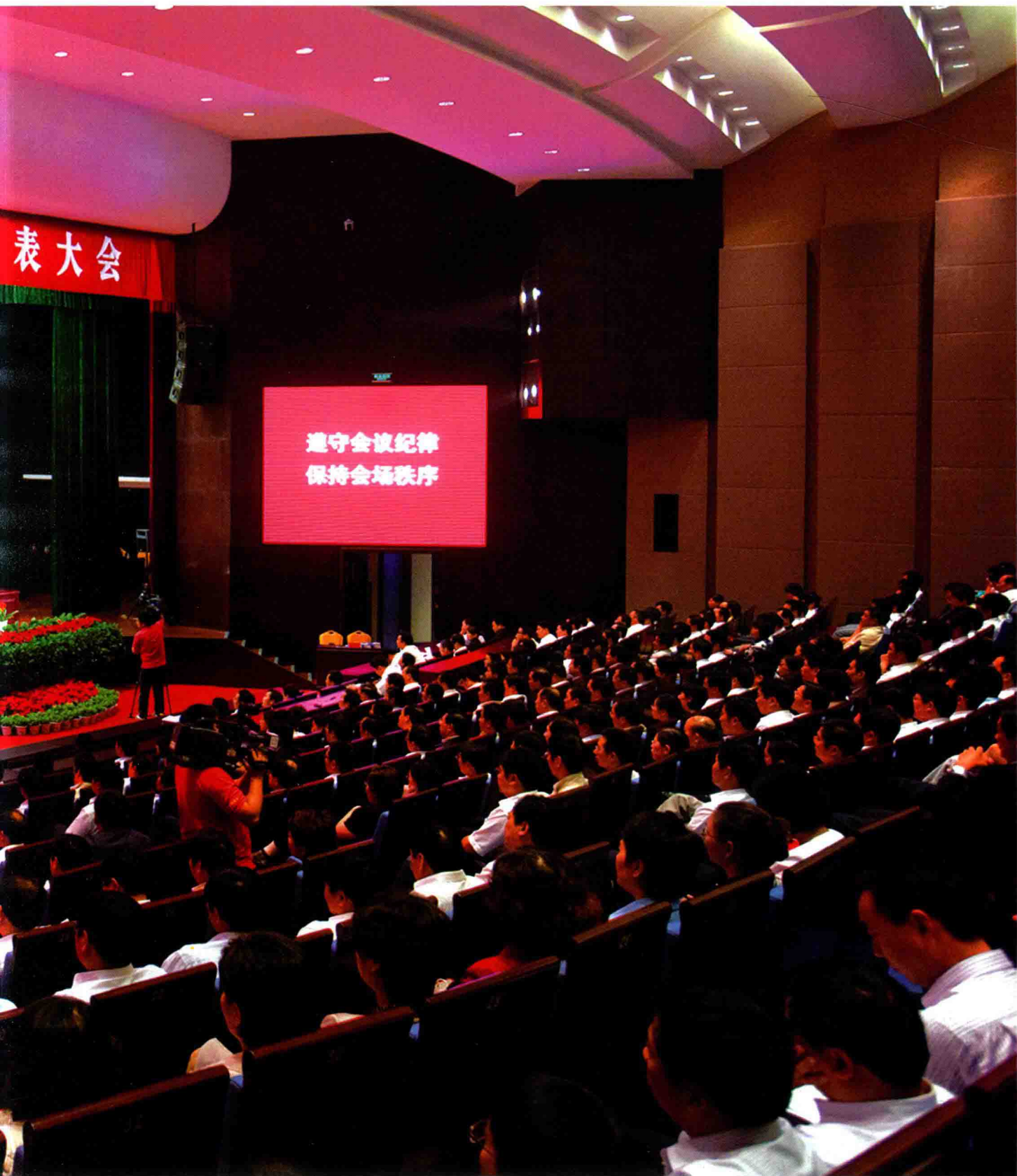
2011年9月，中国共产党宿迁市第四次代表大会召开