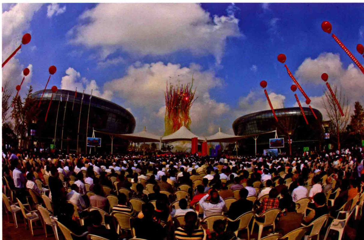
2011年9月26日，江苏省第七届园艺博览会在宿迁市隆重开幕