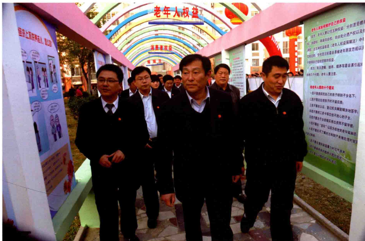
2011年11月，市委副书记叶辉(中)调研城市社区党建工作