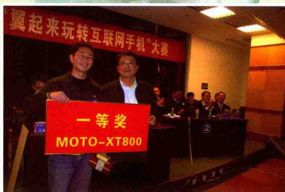
翼起来玩转互联网手机大赛

2011年，公司荣获省模范劳动关系和谐企业、2011年江苏省质量管理小组活动优秀企业、江苏公司安全工作先进企业、宿迁市消防安全工作先进单位、宿迁市旅游业发展先进集体、宿迁市内部审计先进单位等多次荣誉称号，在两个文明建设中取得了丰硕成果，进一步树立了良好的社会形象。