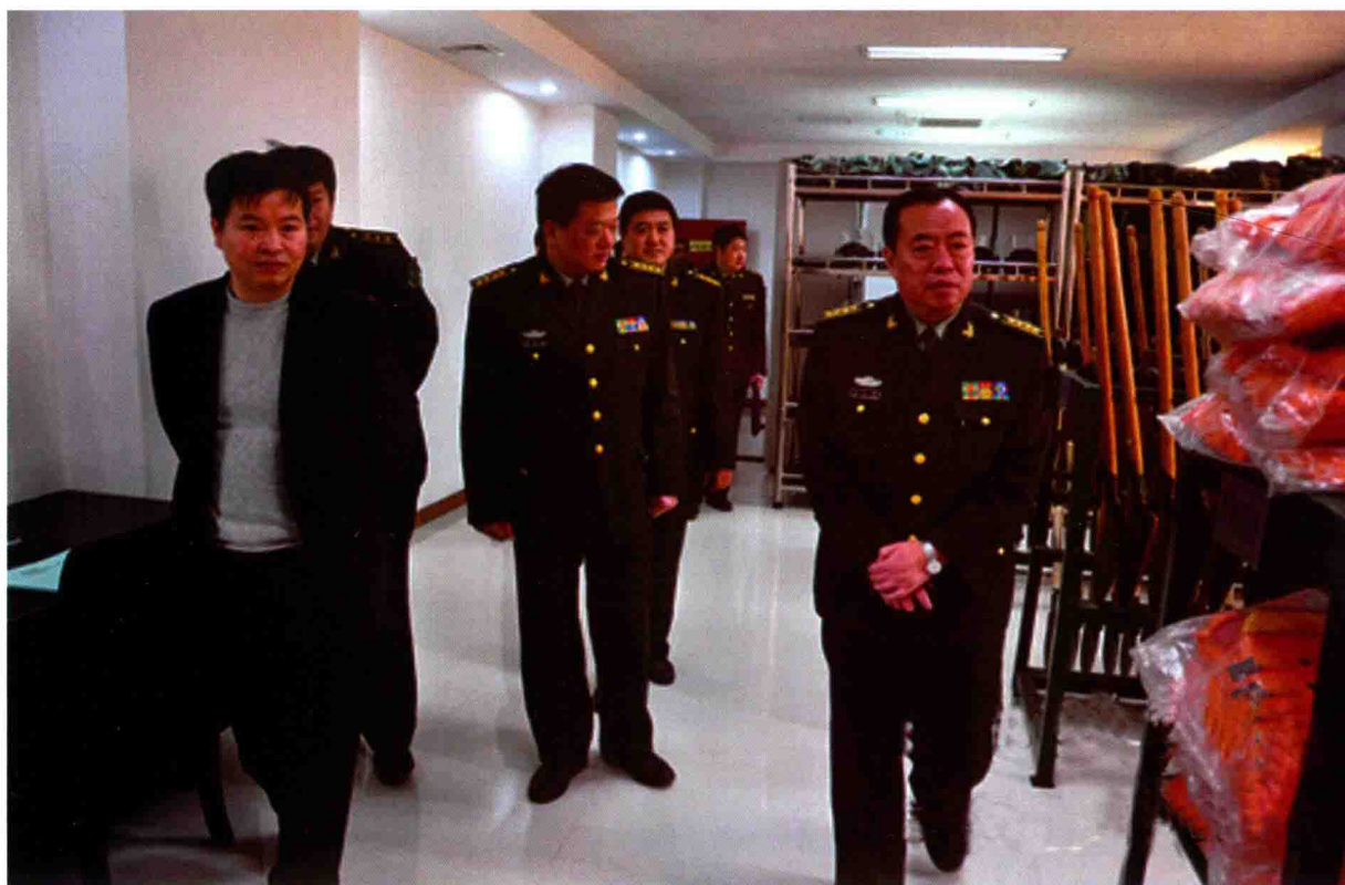
2011年2月,市委常委、宿迁军分区政委马永强(右一)在宿城区调研人防工作