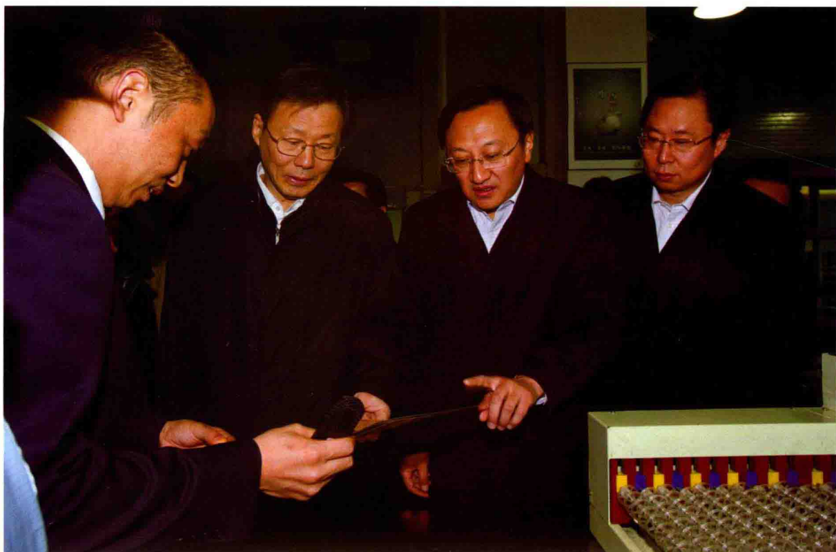
2012年1月14日，省长李学勇(左二)莅宿视察