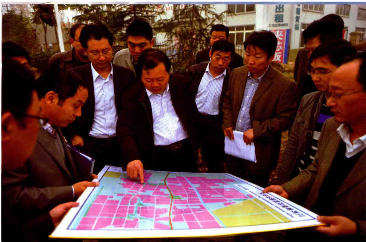
2011年11月，市委常委、宿迁经济开发区党工委书记许步健（中）在基层调研