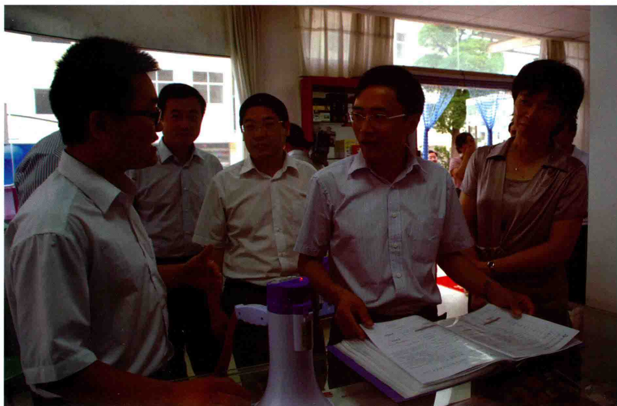
2011年7月,市委常委、组织部长李圣华(右二)调研宿城区大学生村官创业项目