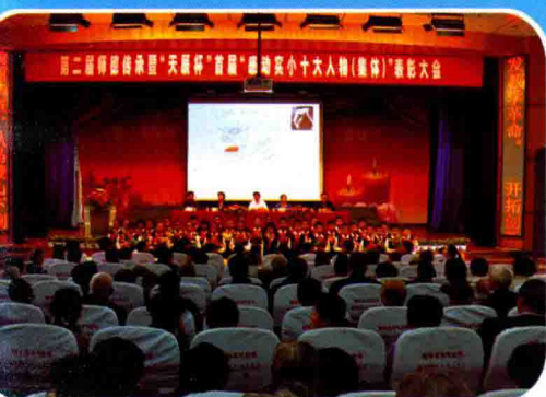
承办2011年江苏省“杏坛杯·苏派青年教师课堂教学展评”活动

【成功文化奠基幸福人生】学校以追求成功教育为目标，坚持“生命与健康，权利与人格，个性和发展”三个不能超越的原则，树立“课堂培养技能，阅读提升境界，运动强健体魄”三个观点，推进“构筑理想课堂、建设书香校园、实施阳光运动”三大工程，使成功文化成为全校师生的共同信念和价值追求。