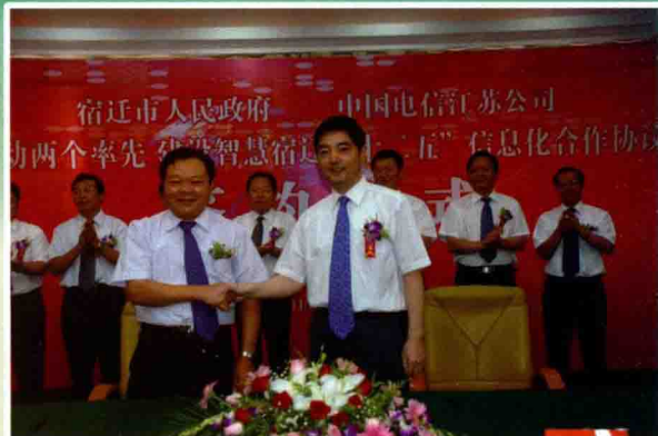
宿迁市政府与中国电信江苏公司 签订十二五信息化协议

2011年，在宿迁市委、市政府及省公司的正确领导下，宿迁分公司始终坚持以科学发展观为指导，转变发展方式、提升创新能力，坚定信心，明确目标，凝心聚力，扎实工作，以强烈的发展意识和拼搏精神，全力做好全业务经营工作，企业发展取得新的成效。