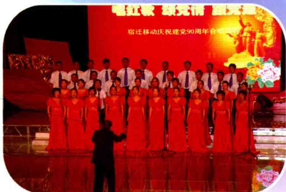
公司举办“高唱红歌,创先争优” 庆祝建党90周年合唱比赛

坚持精确规划、精确建设、精确运维,提前超额完成了市委、市政府为民办实事G网14期工程建设任务,网络通信能力大大增强。在全省率先启动无线智慧城市建设,累计开发26项行业应用和36项民生应用,实现了公安、交通、卫生、政府等十多个行业信息化项目拓展。“政务通”服务全市副科级以上干部,社区警务通、沭阳技防城入选全省最佳实践项目,农业信息化项目获邀在全省“世界电信日纪念大会”作经验发言。