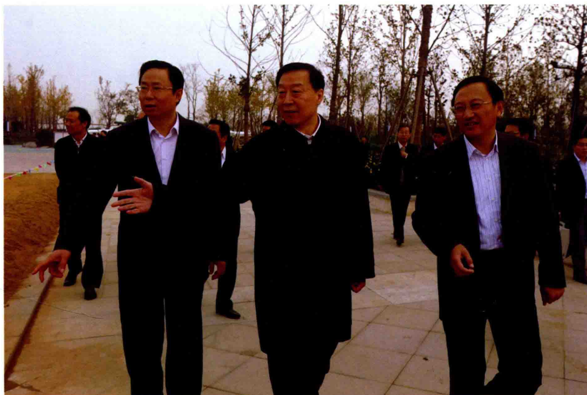
2011年11月16日，省委书记罗志军(中)莅宿视察