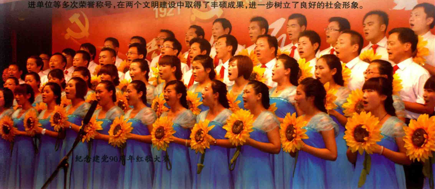
纪念建党90周年红歌大赛

2011年，公司荣获省模范劳动关系和谐企业、2011年江苏省质量管理小组活动优秀企业、江苏公司安全工作先进企业、宿迁市消防安全工作先进单位、宿迁市旅游业发展先进集体、宿迁市内部审计先进单位等多次荣誉称号，在两个文明建设中取得了丰硕成果，进一步树立了良好的社会形象。