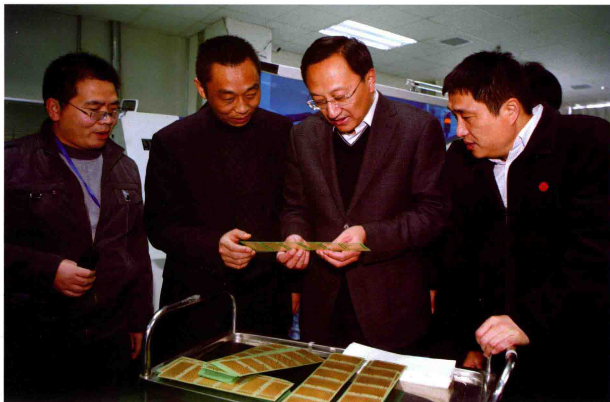
2011年12月1日，市委书记缪瑞林(右二)在沭阳县调研