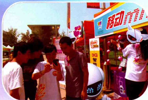
高校迎新现场设立特色增值业务体验专区