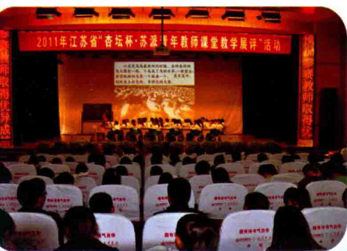
召开感动实小十大人物表彰大会

【扎实有力推进素质教育】学校科学构建校本课程体系，精心打造“双备课模式”、“五精五环”教学模式，发挥校名师工作站示范引领作用，深入推进“青蓝”工程。近年来，相继培养出江苏省特级教师7人，市名校长2人，市名教师7人，市学科领军人物4人，市学科带头人29人，市骨干教师12人，市教学能手21人，市教坛新秀10人，在全市基础教育领域中切实发挥了带头示范作用。