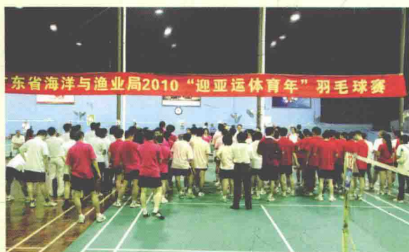
广东省海洋与渔业局工会积极开展文体活动。图为“迎亚运体育年”羽毛球赛现场。