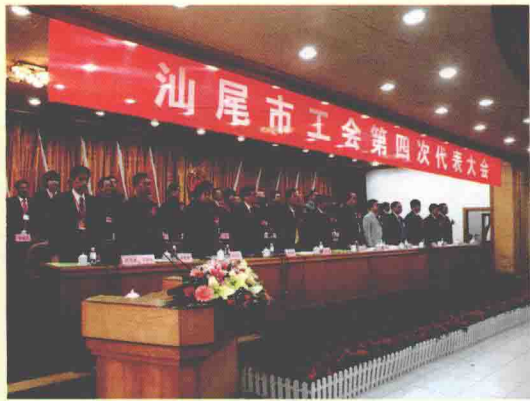
汕尾市工会第四次代表大会隆重召开，市四套班子领导出席大会开幕式。