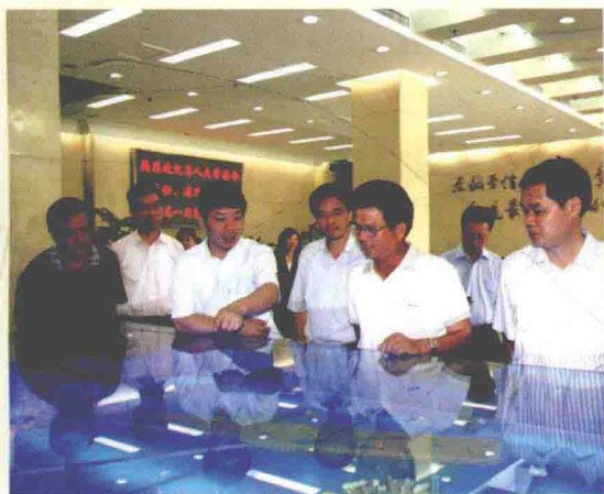
2010年7月15日，广东省人大常委会副主任、省总工会主席邓维龙(右二)，在省总工会常务副主席陈宗文(右一)，纪检组长廖汝捷(左一)的陪同下到中交广州航道局有限公司调研工会工作。