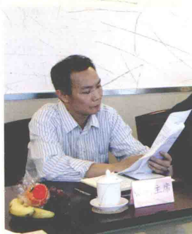
2010年7月9日，广东省工业工会召开年中工作会议。省总工会副主席张振彪出席了会议。