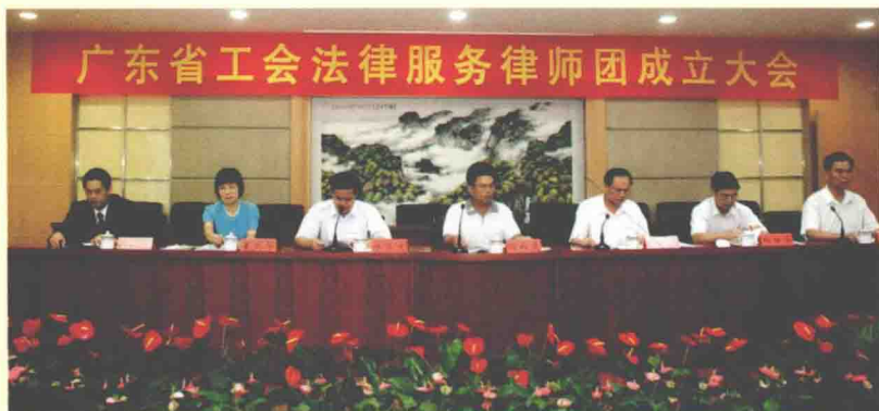
2010年7月2日，广东省成立工会法律服务律师团，为各地工会组织和职工提供公益法律服务，维护职工合法权益。