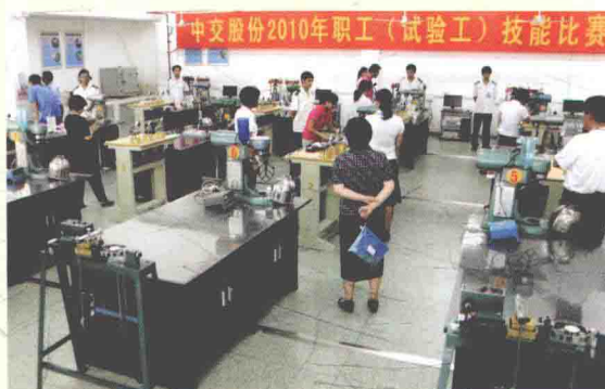
2010年9月8日，中交第四航务工程局有限公司举行“中交股份2010年职工(试验工)技能比赛”。