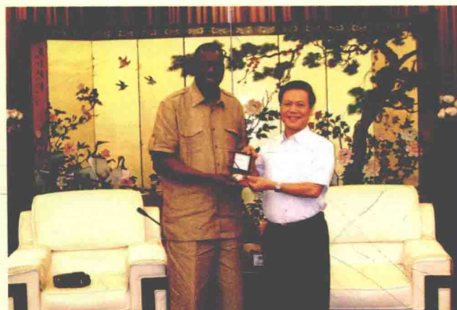
2010年9月4日，广东省总工会党组书记、副主席郭泽宇接待国际劳工组织副总干事阿桑·迪奥普。