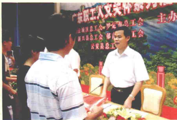
2010年8月6日，由省总工会主办、云浮市总工会承办的广东职工人文关怀系列活动暨“金秋助学”启动仪式在云浮举行，450名困难职工子女共获得100万元助学金。省总工会常务副主席陈宗文出席了仪式。