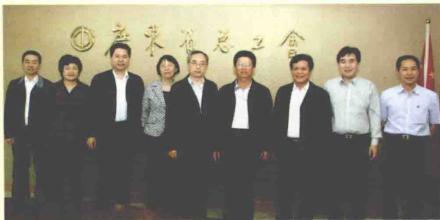
2010年5月7日，广东省人大常委会副主任、省总工会主席邓维龙(右四)会见澳门中联办副主任陈启明(右五)一行。