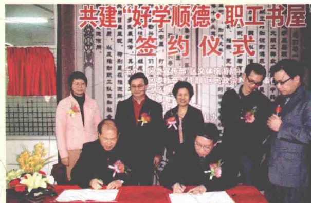
顺德区总工会重视“职工书屋”建设。2010年1月17日，顺德区总工会与顺德图书馆在东菱集团公司签约共建“职工书屋”。