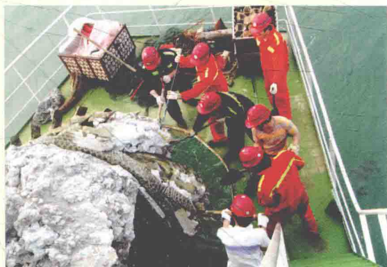
中交广州航道局有限公司工会积极开展劳动竞赛。图为“敏龙”轮劳动竞赛场面。