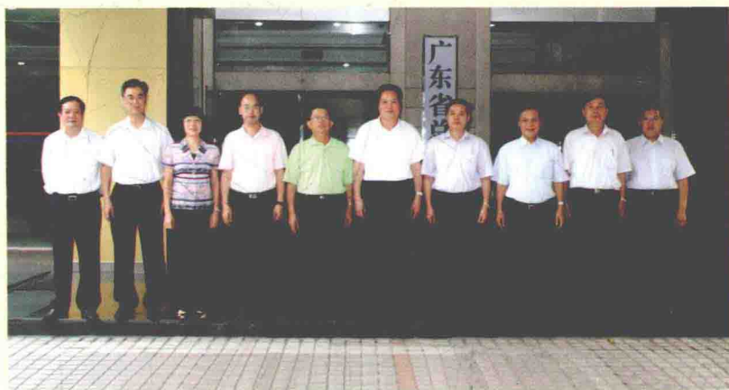
2010年8月30日，广东省委副书记、省纪委书记朱明国到省总工会调研工会工作。图为朱明国与省总工会领导班子成员合影。左起：廖汝捷、林锡明、王丽华、刘日知(省委副秘书长)、邓维龙、朱明国、陈宗文、郭泽宇、张国兴、杨敏。