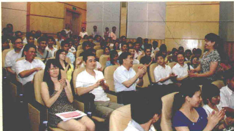
2010年8月7日，受中共中央政治局委员、省委书记汪洋(二排左三)邀请，100多名在广东工作的外来务工人员省委礼堂一起观看反映外来工故事的电影《所有梦想都开花》。农民工全国人大代表胡小燕是电影故事素材的原型之一。