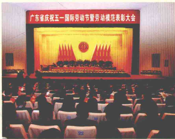
2010年4月30日，广东省庆祝五一国际劳动节暨劳动模范表彰大会在广州隆重举行。全国劳动模范和先进工作者、省五一劳动奖章获得者代表，以及广州地区各界职工群众代表，共1000多人参加了大会。