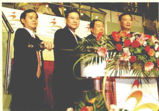
2010年4月13日，广东省第四届职工运动会开幕式在广州举行。图为省总工会常务副主席陈宗文(左一)与广东省体育局有关领导共同启动开幕式。