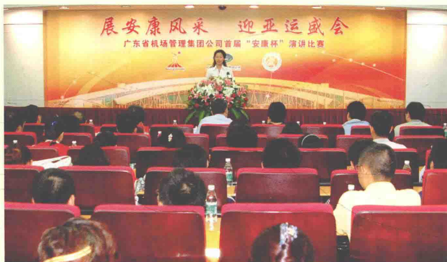
2010年7月28日，广东省机场管理集团举办“迎亚运”“安康杯”主题演讲比赛。