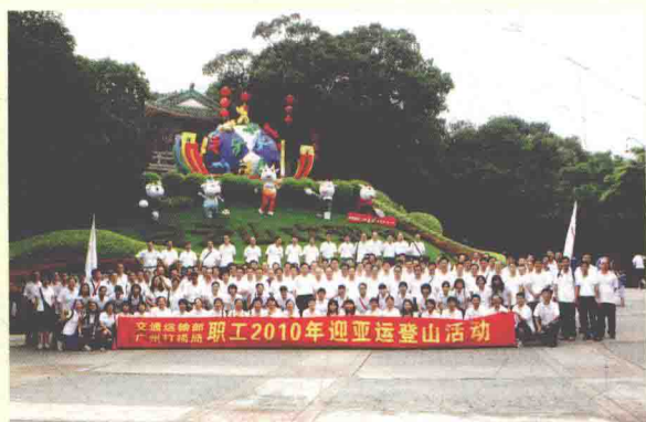
交通运输部广州打捞局工会积极开展体育活动。2010年9月30日，局工会组织职工开展迎亚运登山活动。