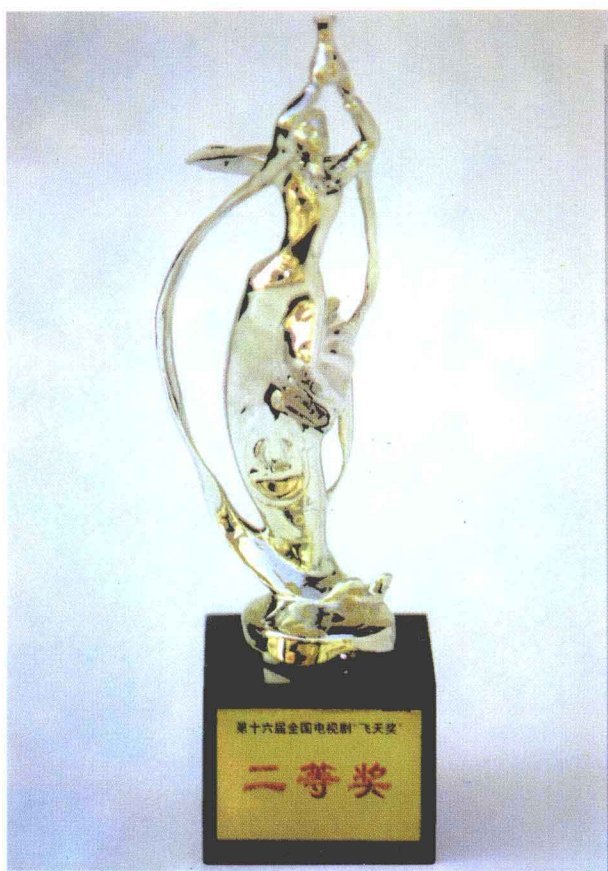
电视连续剧《总督张之洞》荣获第十六届全国电视剧“飞天奖”二等奖。