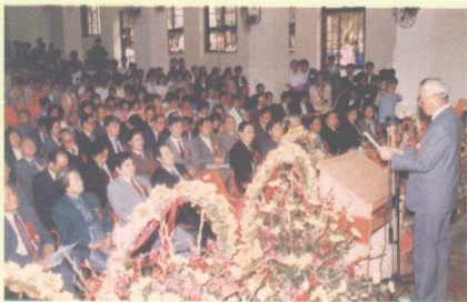
成立典礼在新装修的阶梯教室举行

出，何善衡先生在祖国最需要管理人才之际，捐资助办管理学院实在是难得的远虑。中山大学李岳生校长也对何善衡先生支持中山大学的建设表达了由衷的钦佩和感谢。