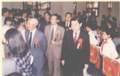
何子焯先生及新华社香港分社郑华副社长一同步入会场

3月16日，康乐园。清风指挥着雀跃的枝头，沙沙地奏着欢乐的乐章。花草树木都悄然换上了嫩绿的新装，连在最偏僻角落的青草儿，都晓得今天是个大日子。