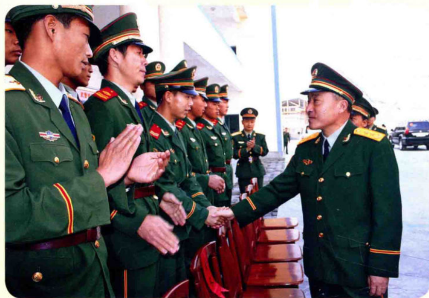
武警部队参谋长霍毅（中将）视察武警梁河县中队