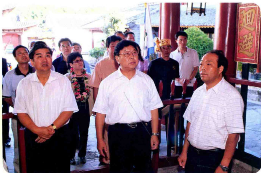
2008年9月21日，全国政协副主席郑万通（中）到梁河视察