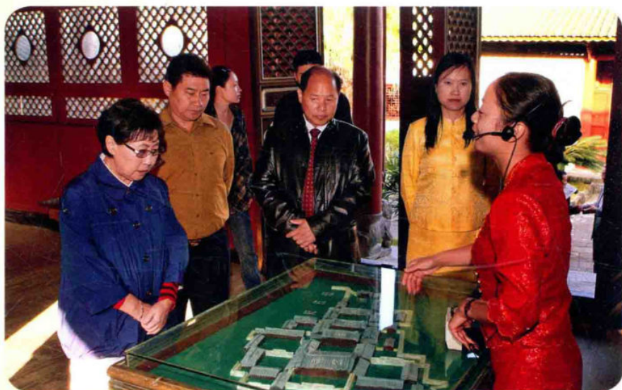
2009年11月12日，全国人大副委员长乌云其木格（左一）到梁河视察