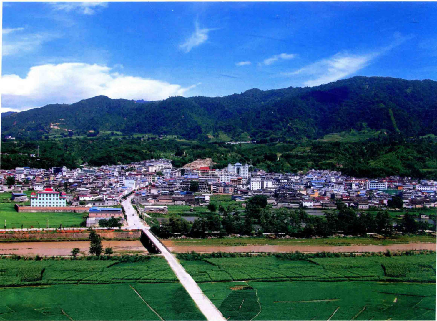
葫芦丝之乡——梁河县城远眺