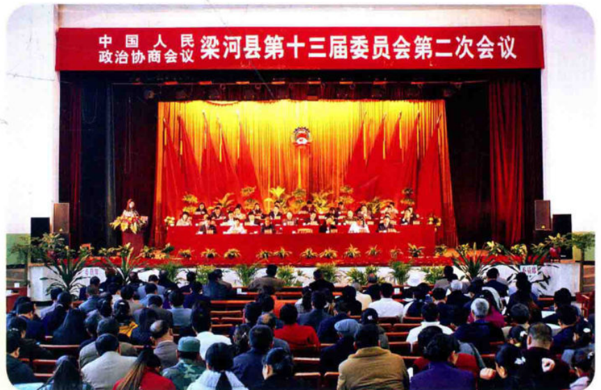
县政协十三届第二次会议