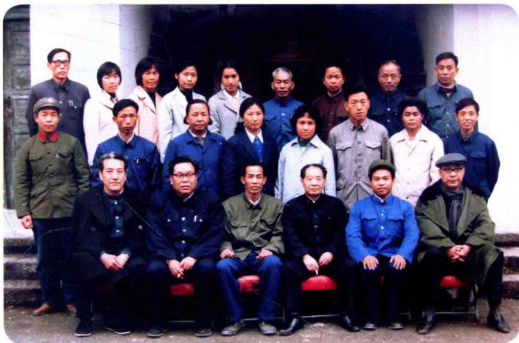
1985年2月16日， 中共中央总书记胡耀 邦（前排右三）到梁 河视察时与县党政军 领导合影