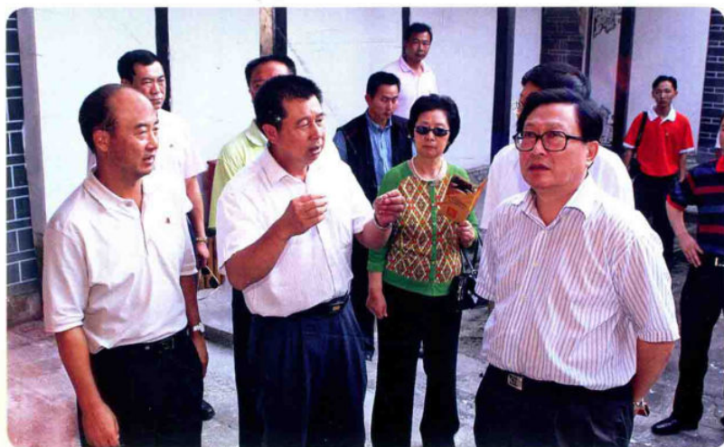
2007年10月4日，国务委 员、国务院秘书长华建敏（右 一）到梁河视察