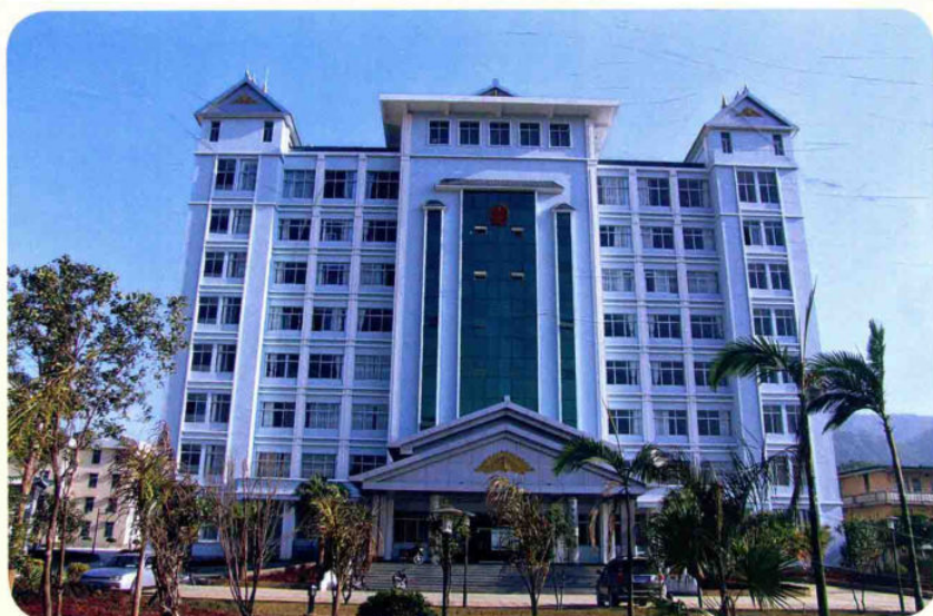
县人民政府办公大楼