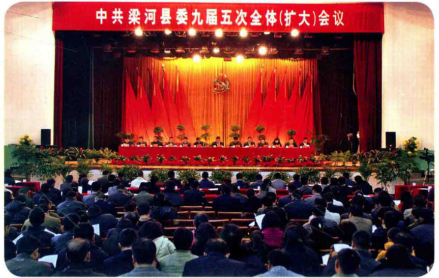
县委九届五次全会