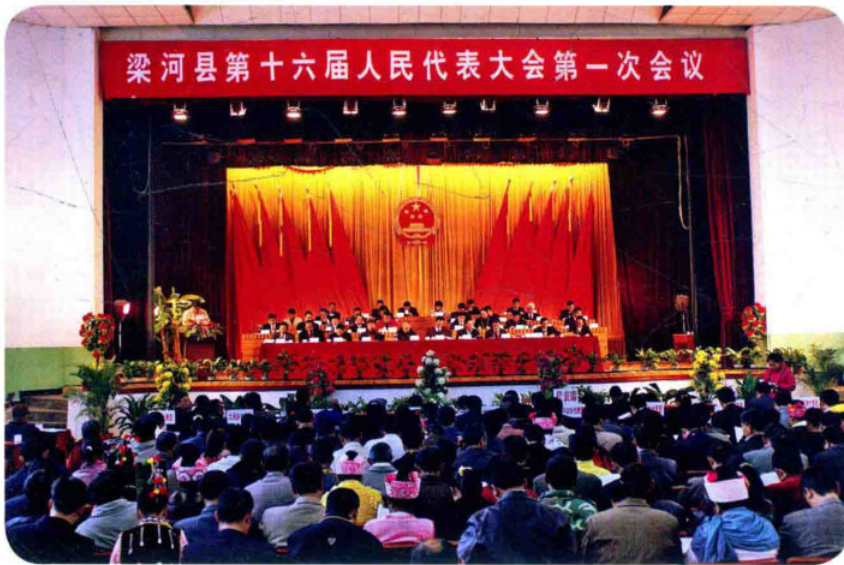
县十六届人代会第一次会议