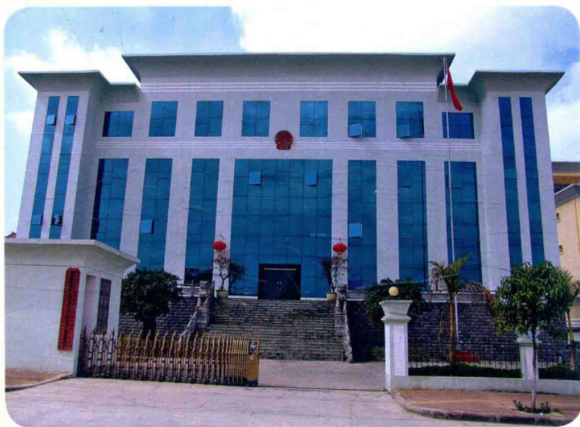
人大常委会办公大楼