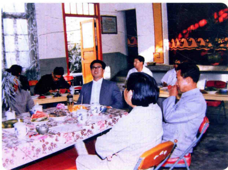
1986年5月17日，中共中央书 记处书记王兆国（中）到梁河视察