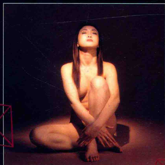
镜头：哈苏 120mm 光圈：F 11