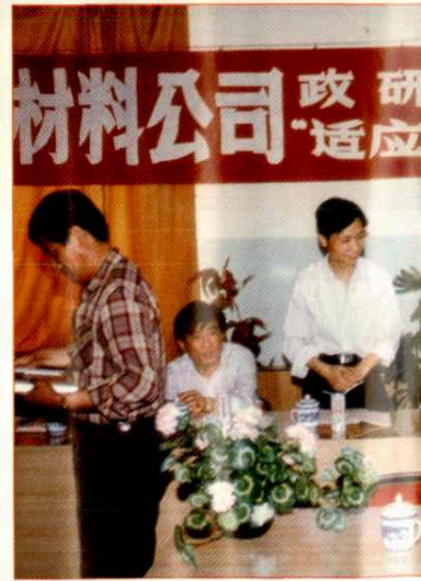
耐火材料公司政研会年会暨