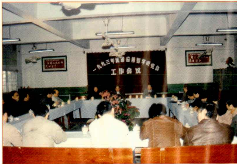
武钢应用哲学研究会工作会议在公司召开(1993)