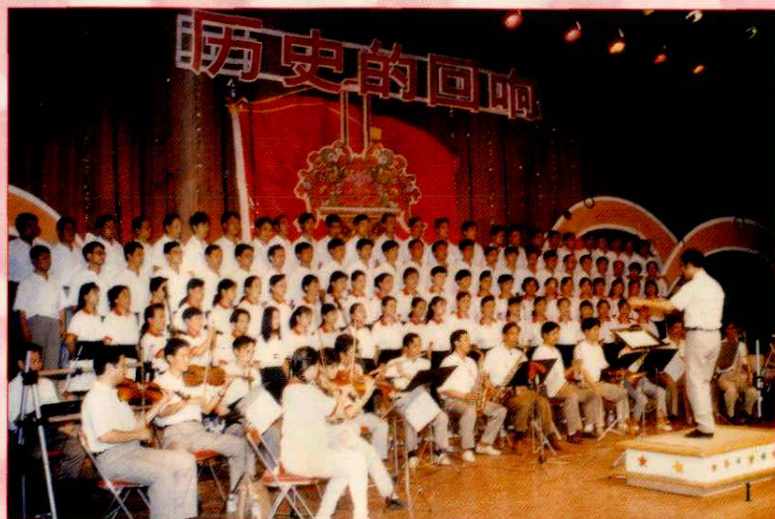
1 职工歌咏比赛 2 职工冬季长跑 3 职工围棋比赛 4 职工篮球联赛 5 公司文艺小分队参加“武钢之夏”晚会演出