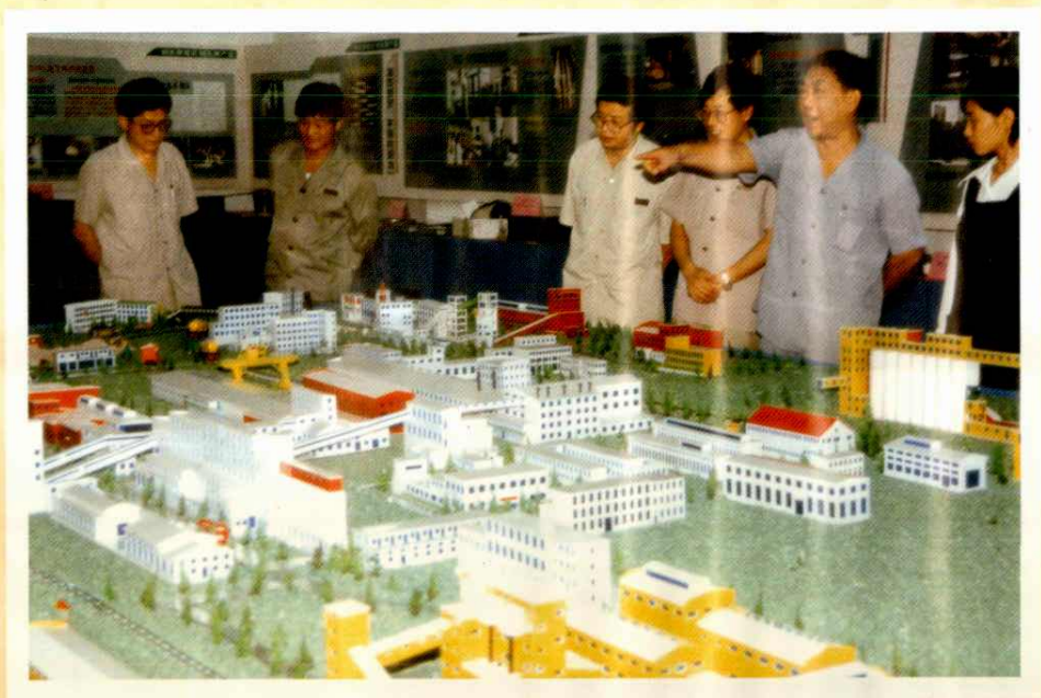
公司领导参观宣传部举办的“树名牌意识、创名牌产品”展览