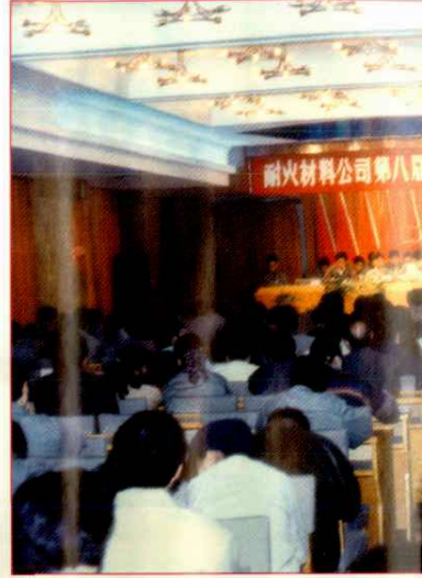
耐火材料公司第八届