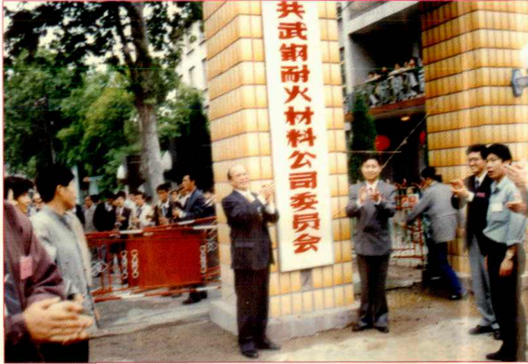
中共武钢耐火材料公司委员会挂牌仪式(1993)