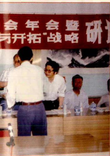
“适应与开拓”战略研讨会