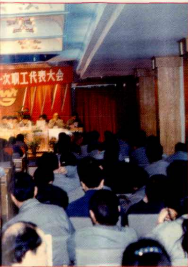
第一次职工代表大会