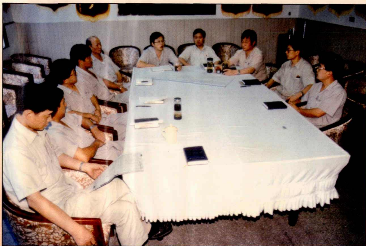
公司领导班子成员