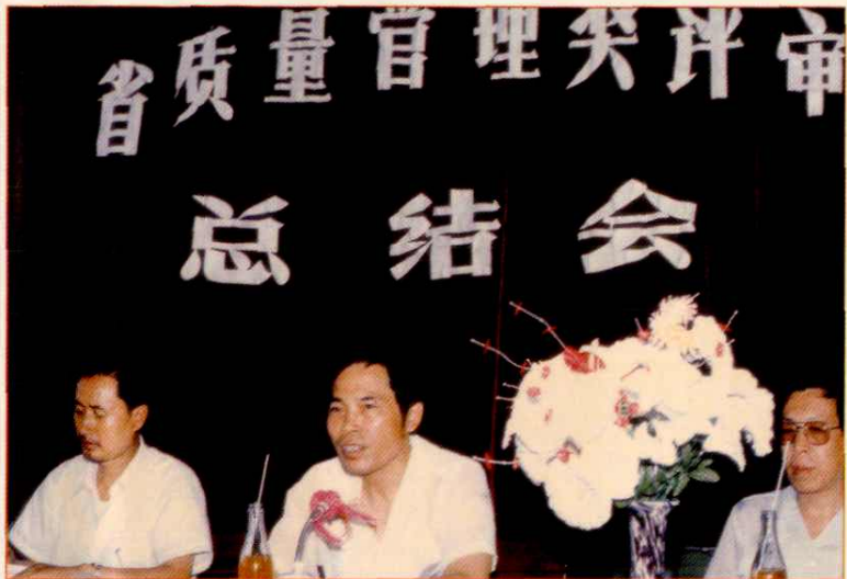
省质量管理奖评审总结会