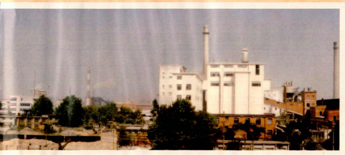
耐火材料公司厂区(局部)