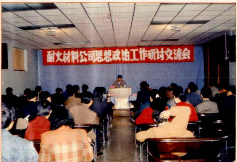
耐火材料公司思想政治工作研讨交流会