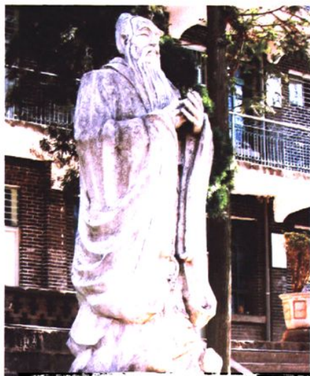
会泽县第一中学孔子像

建元六年（公元前135年），汉武帝正式在夜郎地区设置郡县，会泽作为夜郎故地，最好的证据是2002年城郊的水城村发掘的汉墓。其出土的“堂琅庄园”、“堂琅铜洗”、“铜提梁壶”有力证明了会泽渊源的文明史。