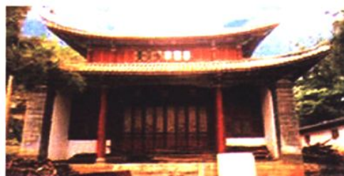
会泽县第一中学内文庙