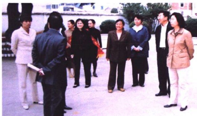
原国家教育部副部长陈小娅（右一）到会泽县调研