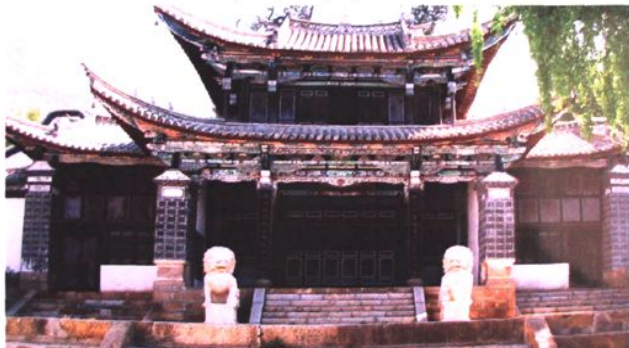
三圣宫（原娜姑白雾小学校址）