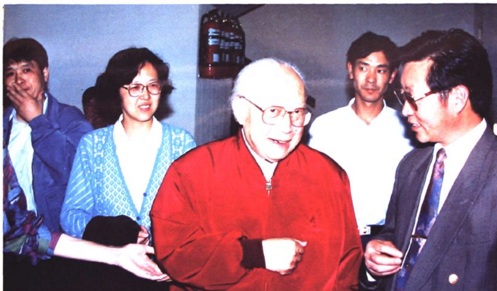
原国家政协副主席钱伟长（中）到会泽县视察工作