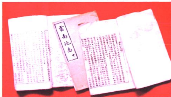
刘盛堂编写的云南第一部乡土教材——《云南地志》