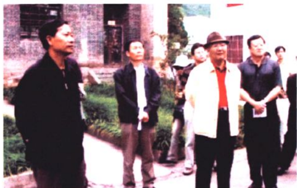
原省委书记丹增（右二）、市委书记米东生（右一）到会泽县第一中学视察工作