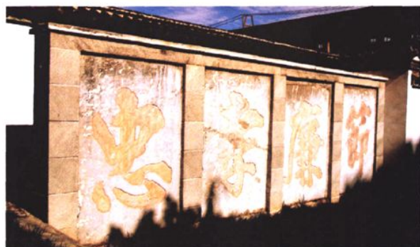
宋代理学大师朱熹手迹（会泽县第一中学内）