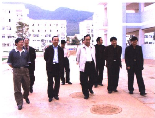
省教育厅副厅长罗嘉福（左三）到会泽县实验高级中学调研