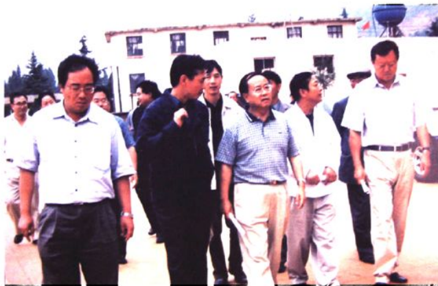
原副省长梁公卿（右三）到会泽县调研