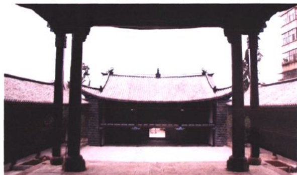
楚黔会馆（原楚黔中学校址）