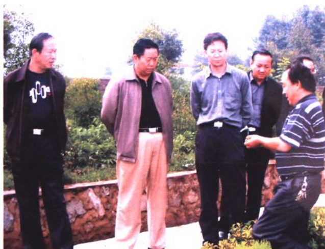
市教育局局长张吉祥（左二）到会泽职业技术学校调研