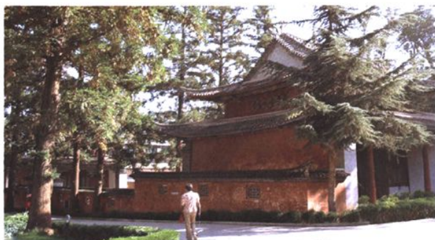
会泽县第一中学内艺苑