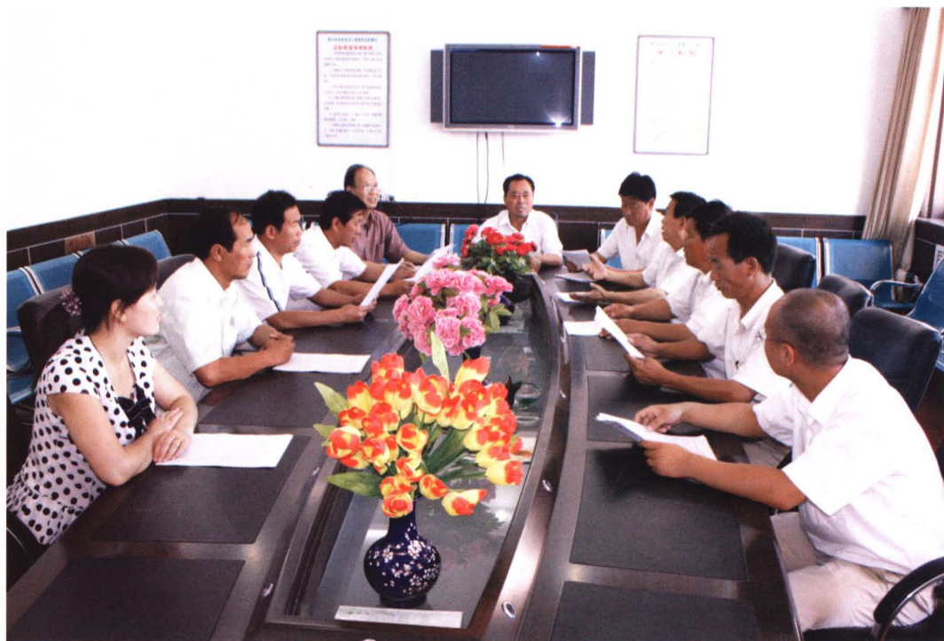
支村两委班子在一起研究讨论新农村建设规划