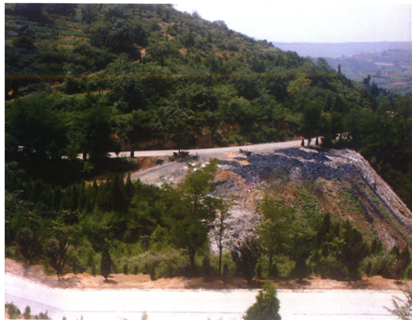
上接晋韩公路的乡级友谊路（陕庄至山后）