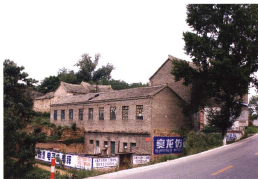
圪针树腰村委旧址