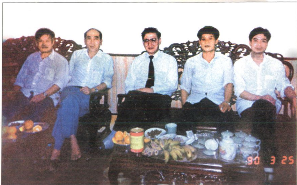
1990年3月25日，广东省工商局局长刘春亭（中）到县工商局检查指导工作。上图，刘春亭由县委书记司徒绍（左二）、副县长甘可悦（左一）陪同，在县工商局座谈。下图，刘春亭由甘可悦陪同参观龙山国恩寺