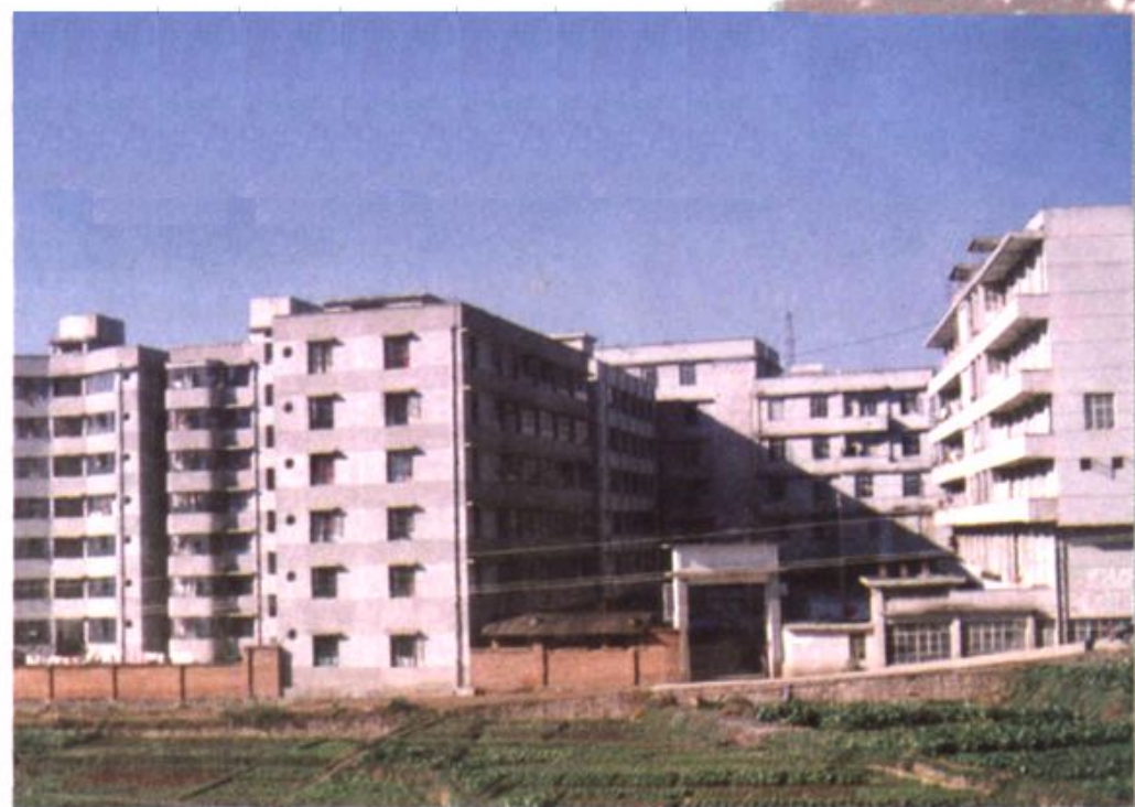
农业局机关办公楼