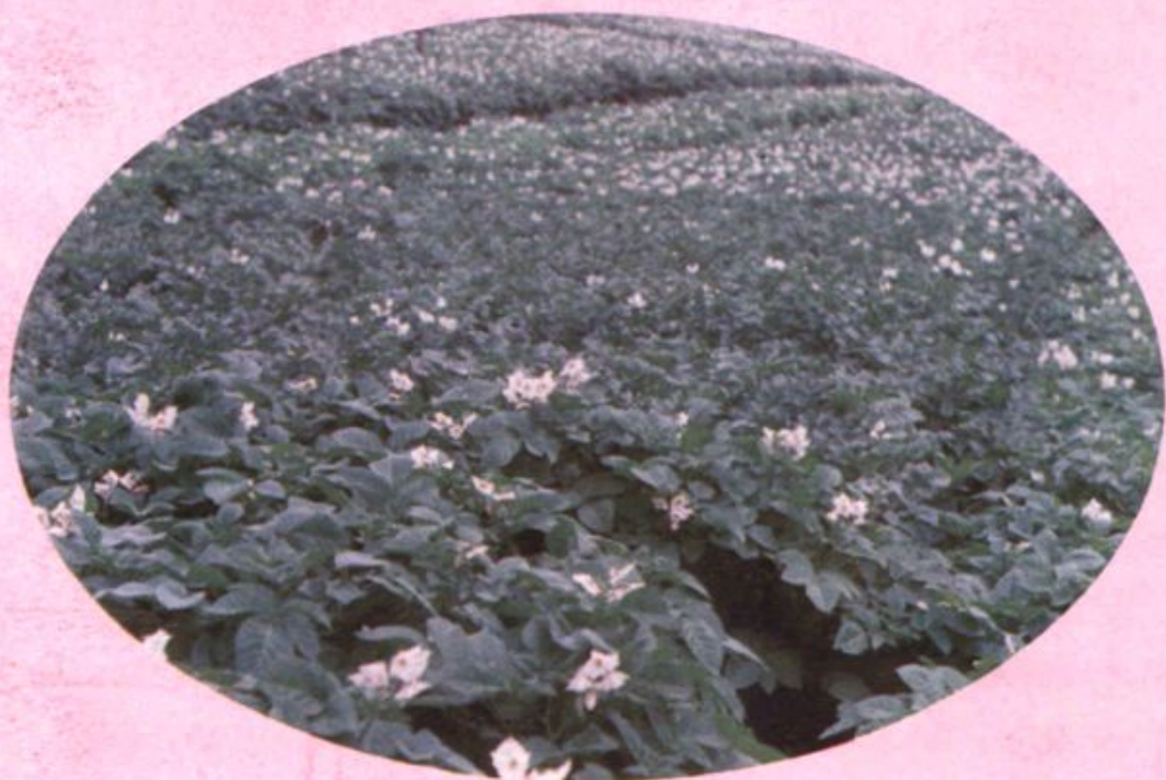
马铃薯脱毒后长势