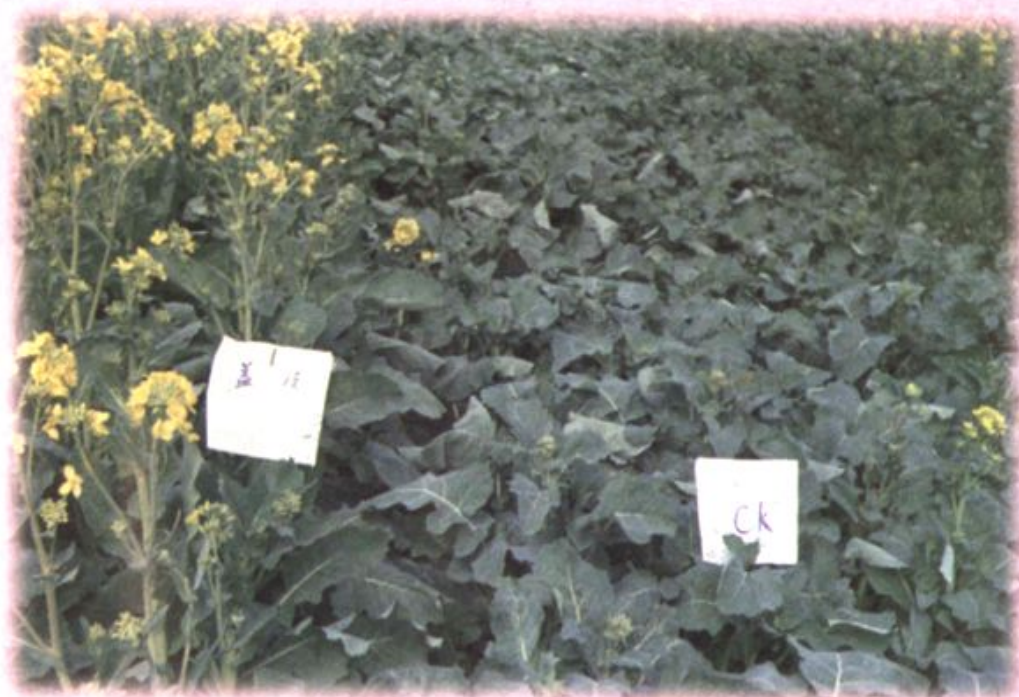
油菜盖膜与不盖膜对比