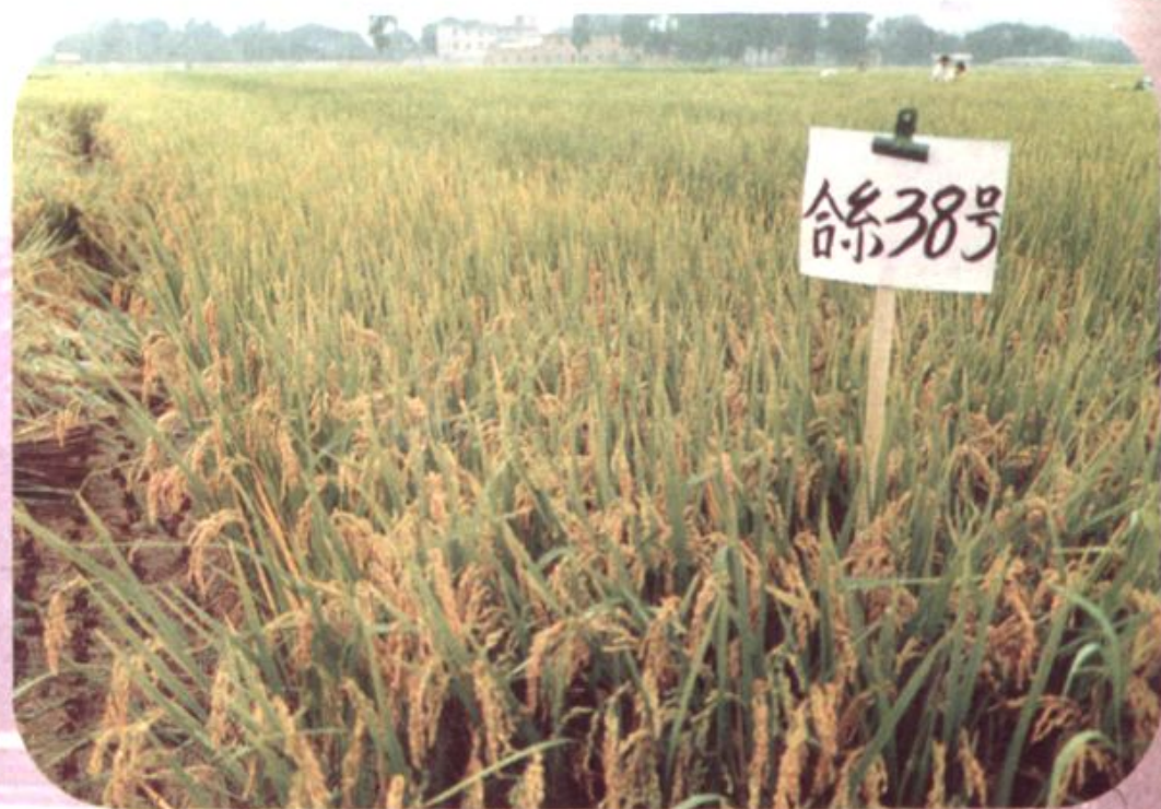
水稻良种——合系 38 号示范