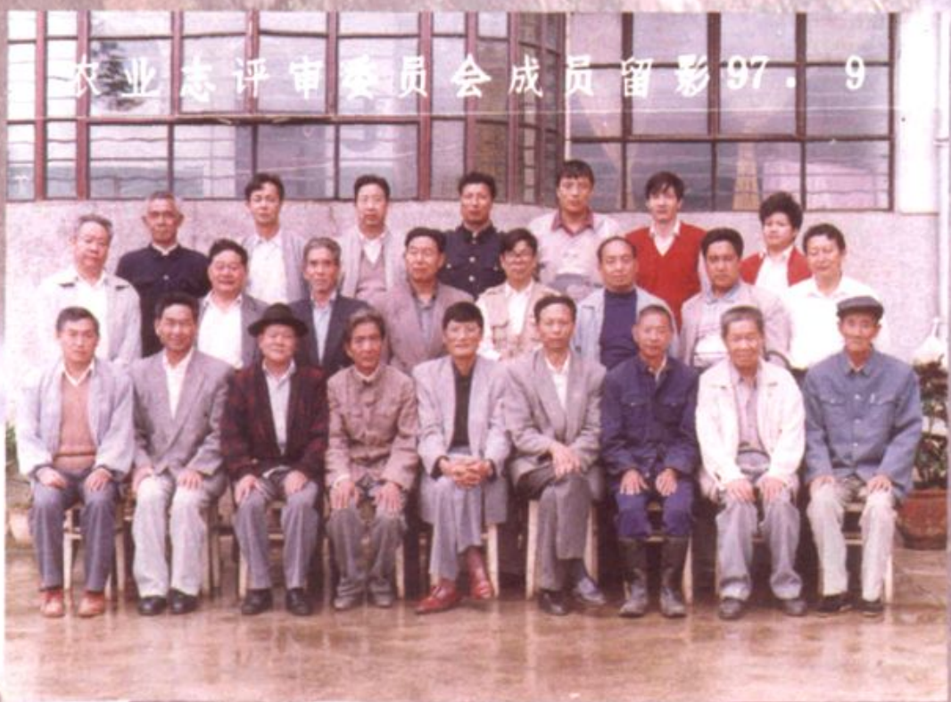
农业志审稿会合影