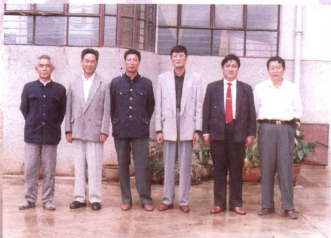
农业志编纂领导小组成员