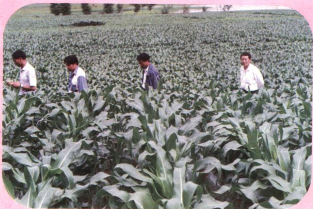
玉米杂交种大面积示范