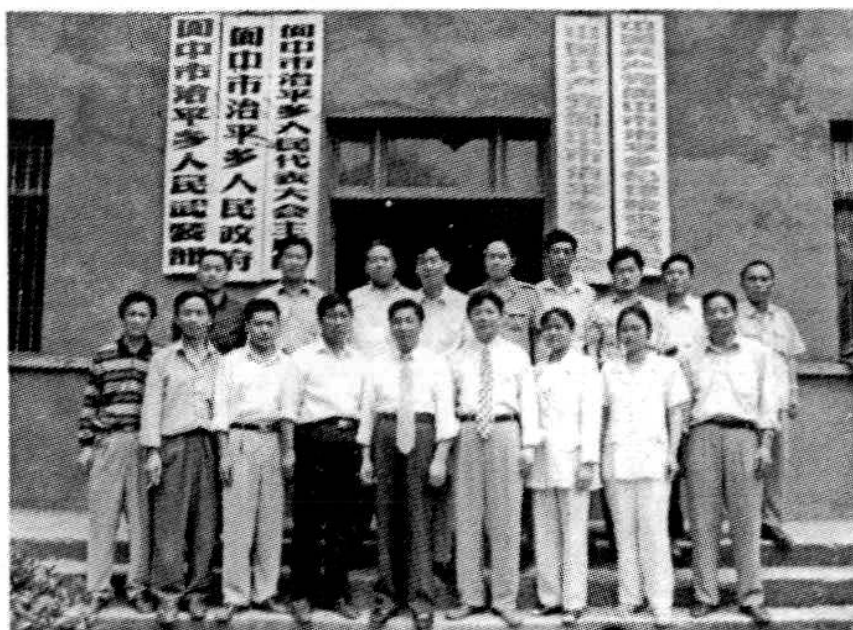
乡党委政府全体干部留影