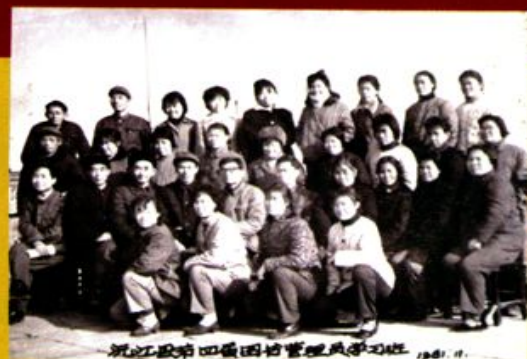
1981年，图书管理员培训班