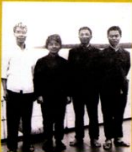
1986年3月，省文化厅领导来沅视察