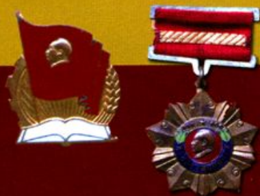
沅江縣文化先進工作者獎章