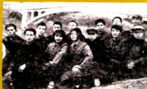
1978年，沅江县业余作者培训班