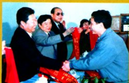
副省长郑培民（左一）为沅江新华书店颁奖