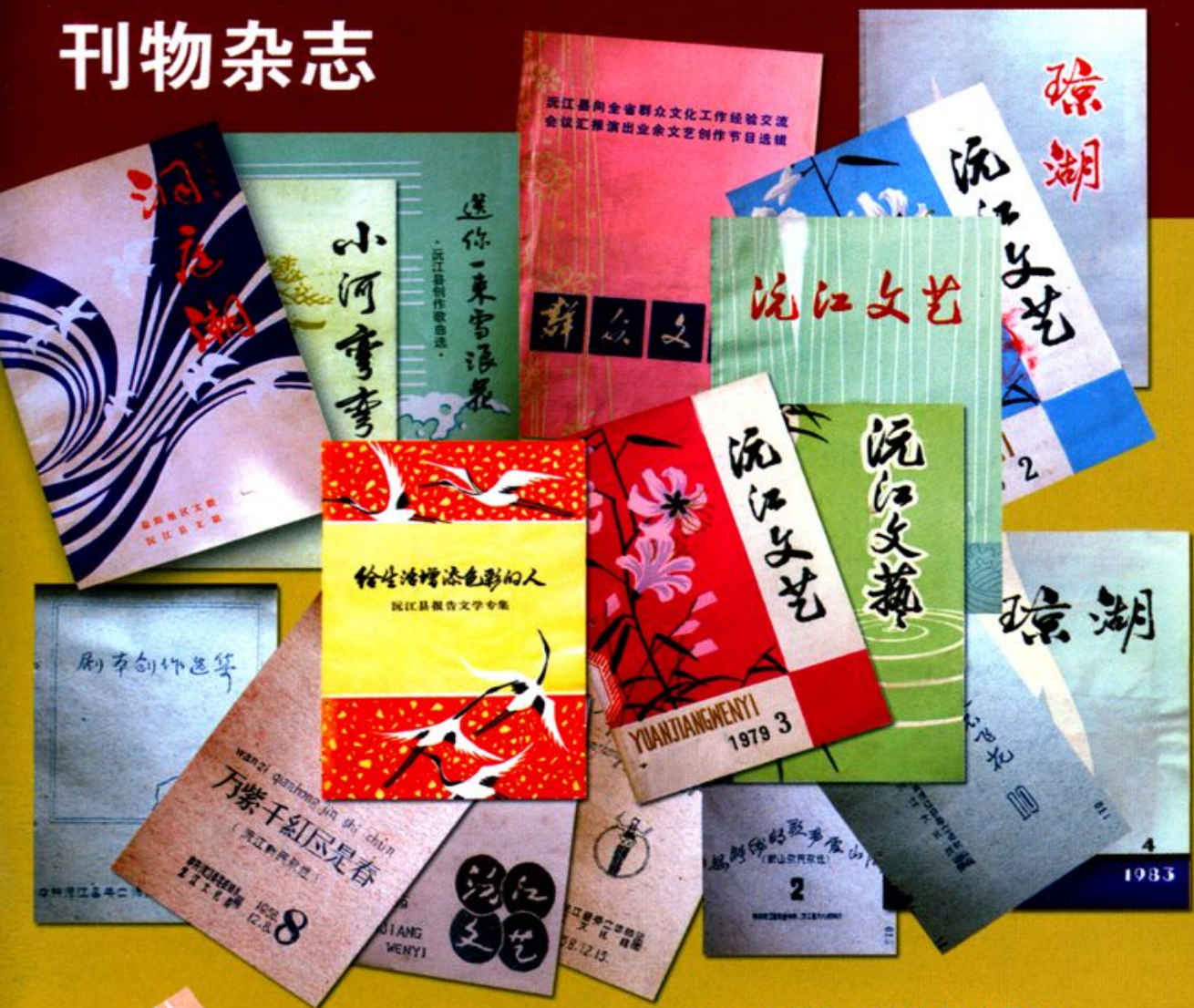
公开出版和自编的部分书刊