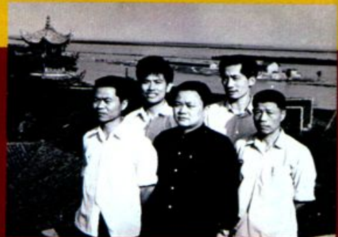
文化局组织文物专干考察文物