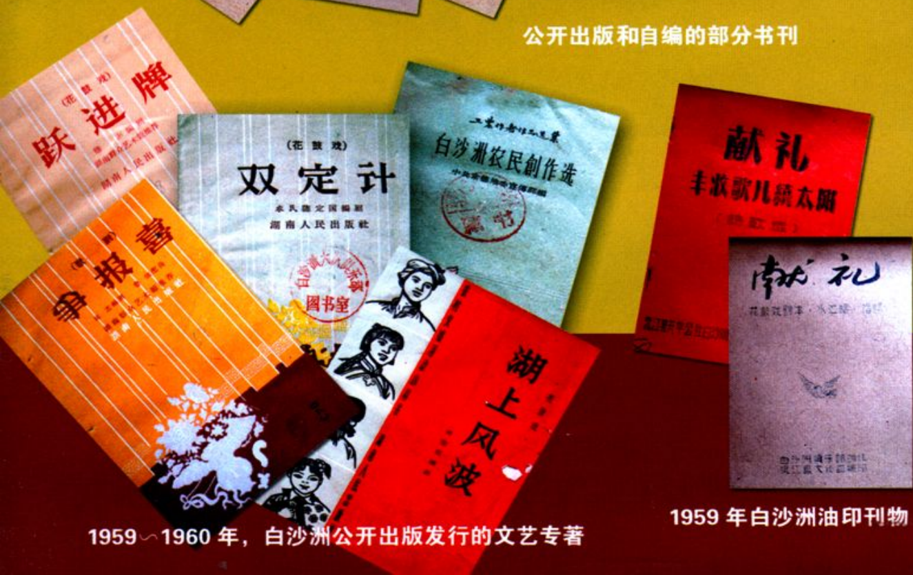
1959~1960年，白沙洲公开出版发行的文艺专著