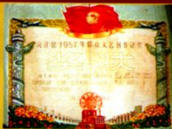
1957年，县人民政府奖给作者的奖状、奖章