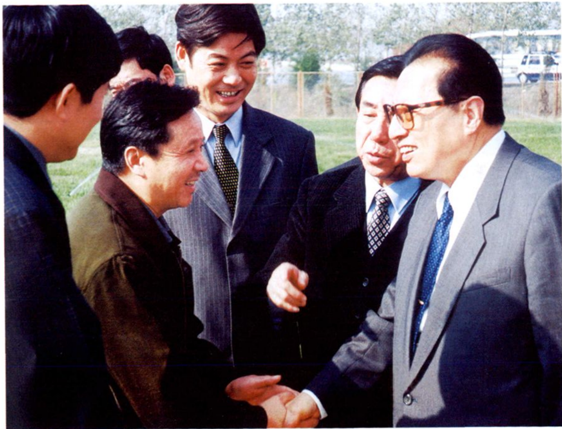
1999年10月，原中共中央政治局常委、全国人大常委会委员长 乔石视察郊区，与郊区人大常委会主任张海水亲切握手