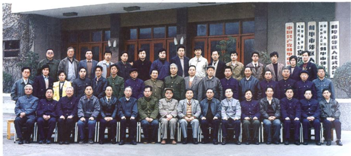
出席全市县、区人大工作研讨会的同志合影