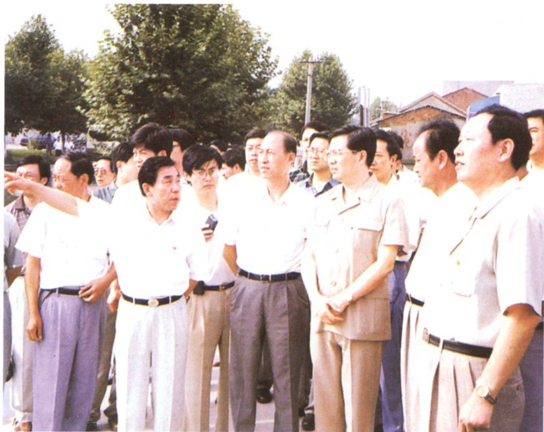
1997年6月，中共中央政治局常委、国家副主席胡锦涛，在省、市、区领导陪同下，察看郊区防洪工程建设情况