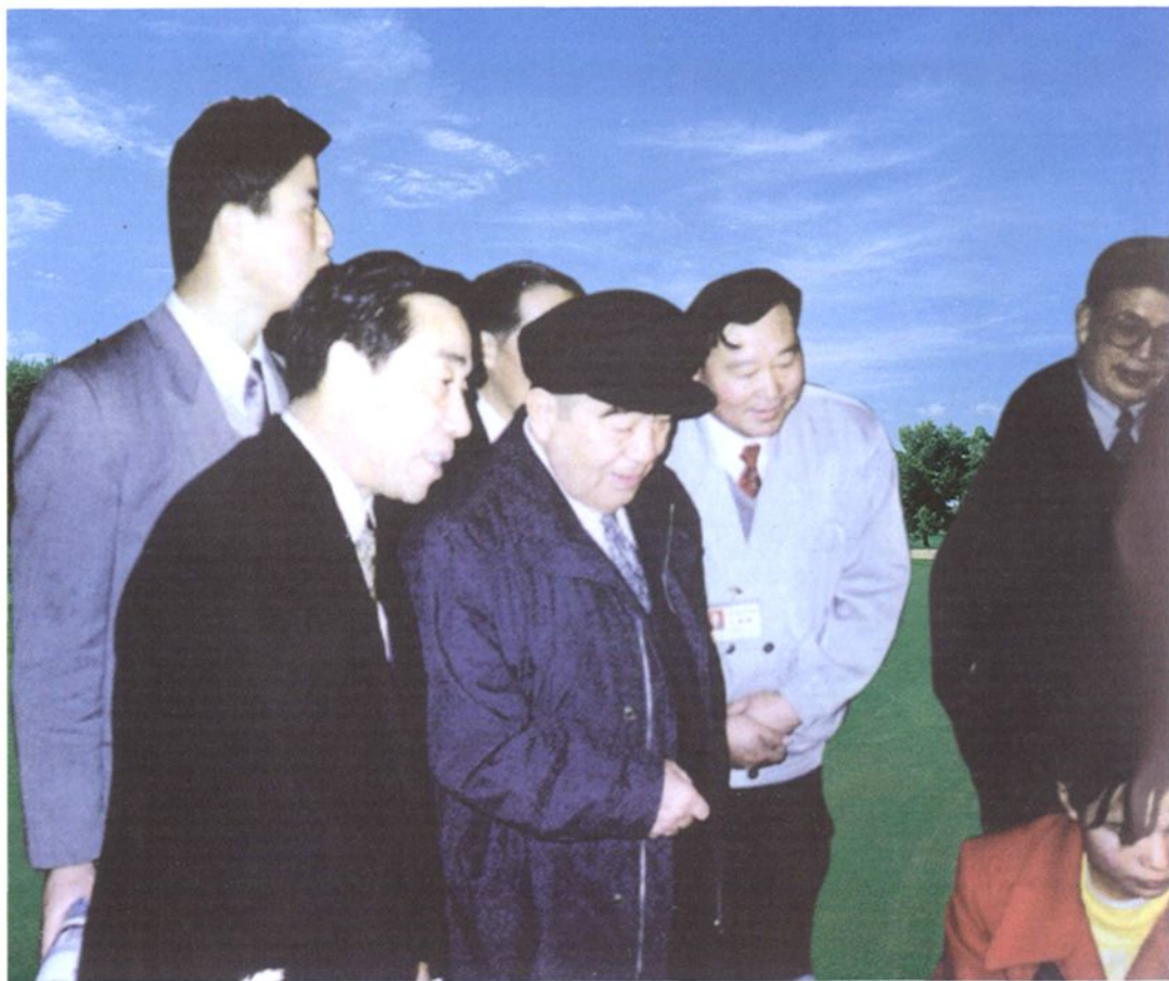
1996年11月,全国人大常委会副委员长布赫视察蚌埠市郊区,在白云保温瓶厂听取汇报