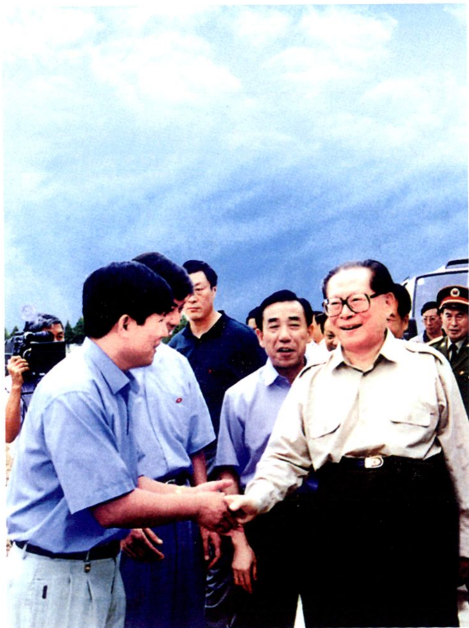
1998年9月，中共中央总书记江泽民同志视察郊区省级现代农业科技推广示范园区