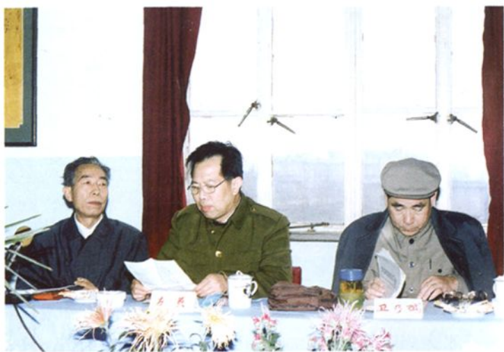
市人大常委会主任卫乃斌（右一）在主席台就座，区委书记左英（中）致欢迎词

1994年9月，全市县、区人大工作研讨会第四次会议在郊区召开。会议围绕加强基层民主政治建设，强化人大监督职能，代表工作，正确行使重大事项决定权，以及人大常委会自身建设等课题，进行座谈，交流探讨搞好新形势下县、区人大工作的理论和实际问题。