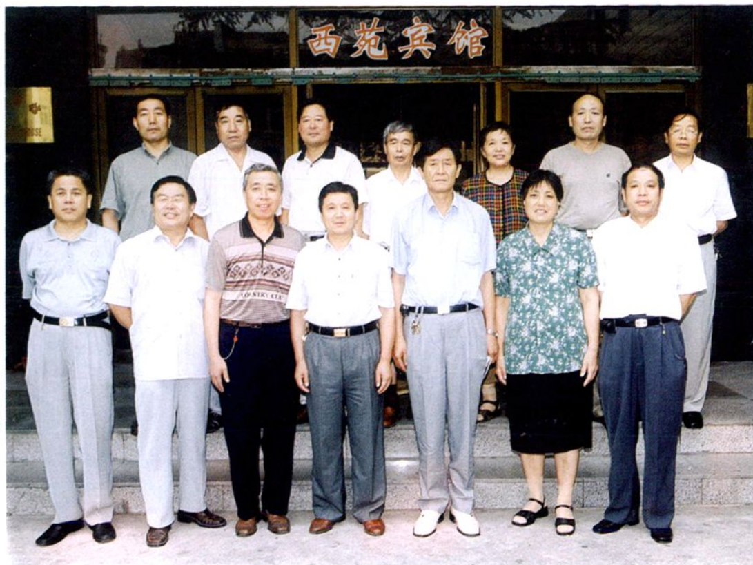
2002年7月，郊区第七届人大常委会组成人员合影