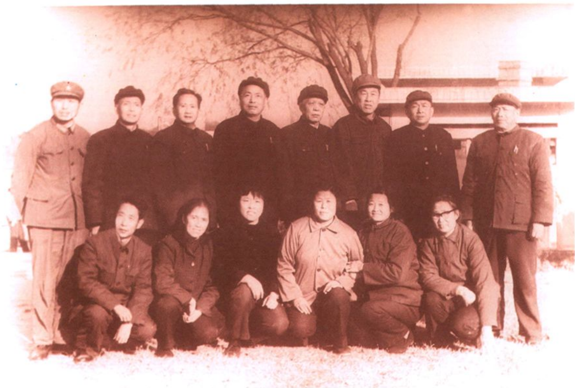
郊区第二届人大常委会组成人员合影