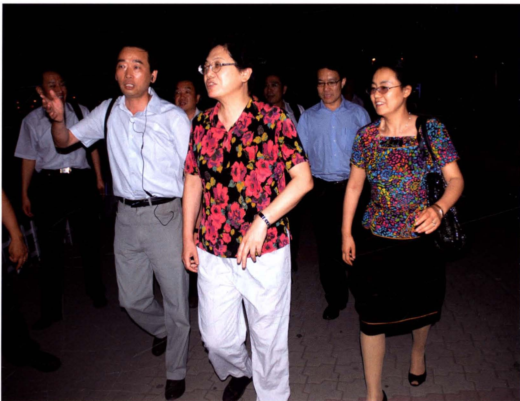
▲2011年7月，国家人口计生委主任李斌 (中)观看汾河公园人口文化宣传展板。