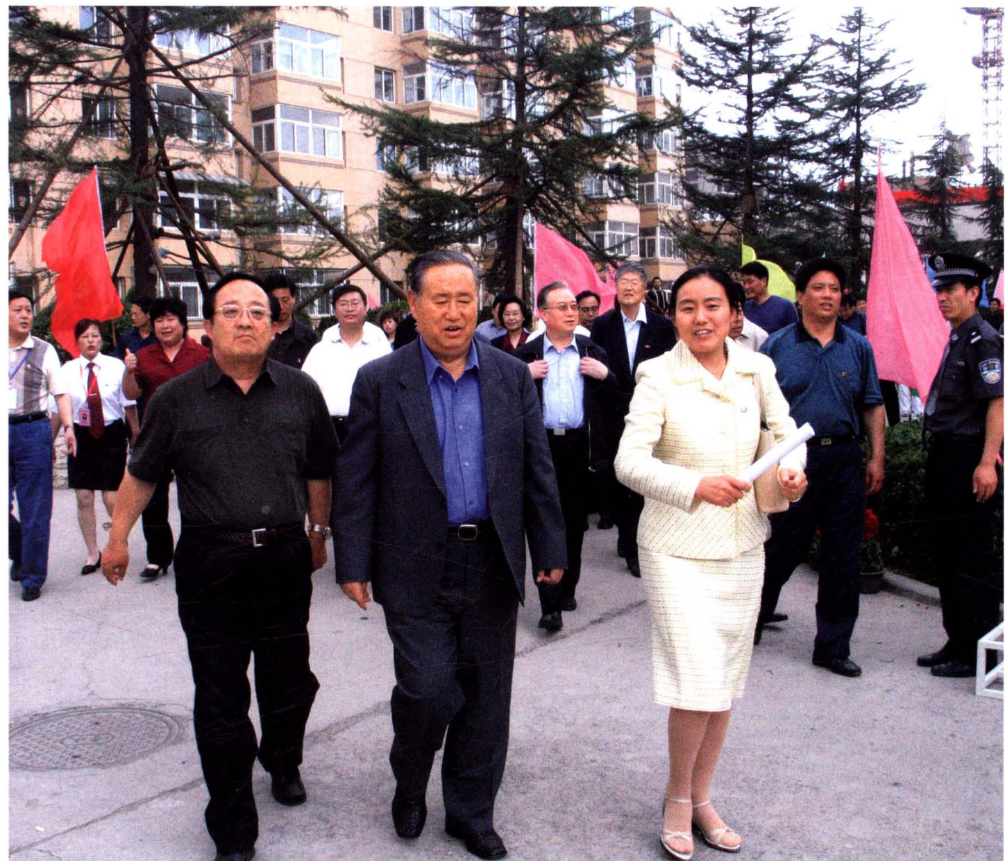
▲ 2005年5月，全国人大副委员长、中国计生协会会长姜春云（中）在太原市委书记云公民（左一）陪同下，视察太原市亲贤社区基层协会建设。