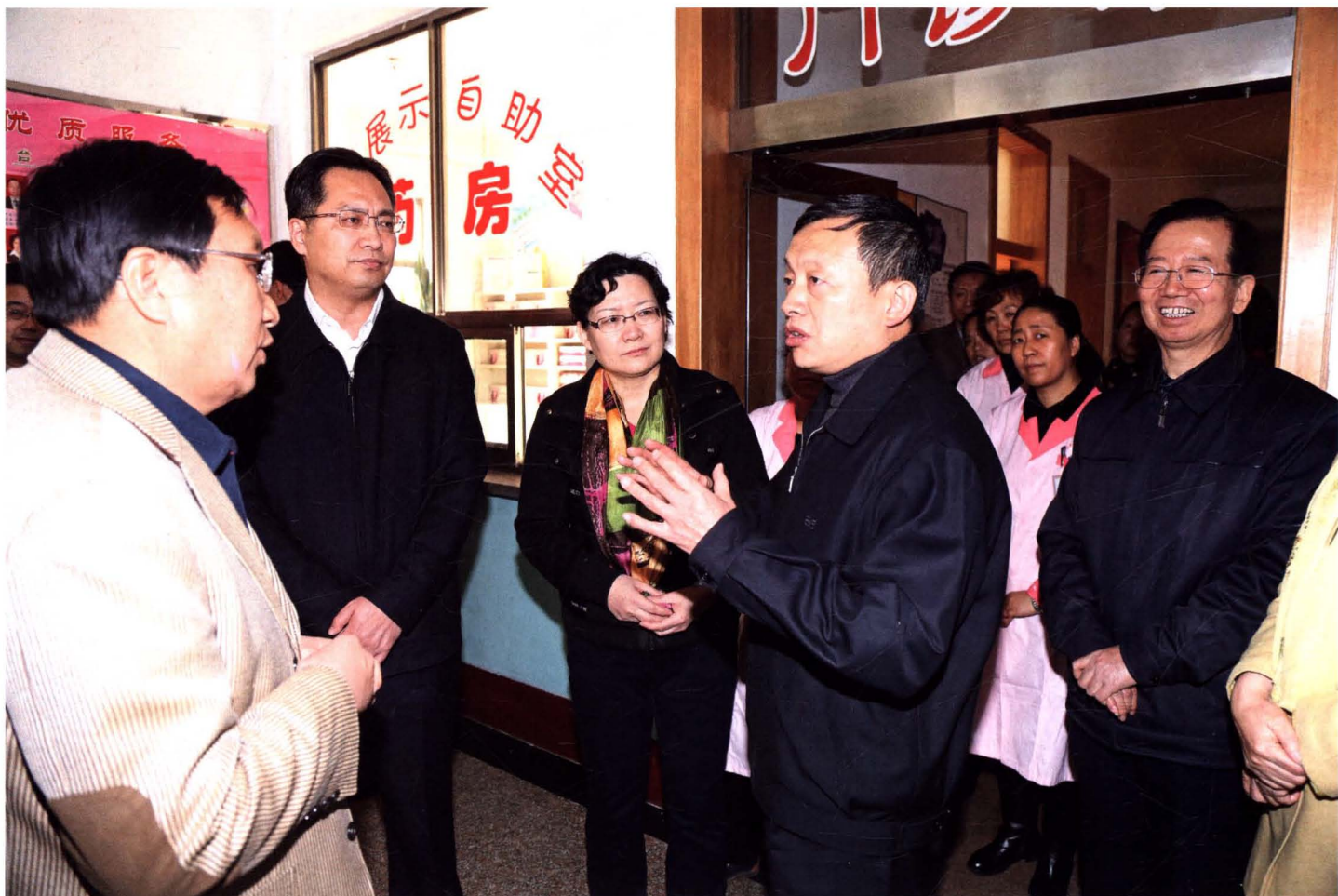
▲ 2014年11月，省政协副主席、省卫计委主任卫小春（左四）在太原市调研人口和计划生育目标责任制考核工作。