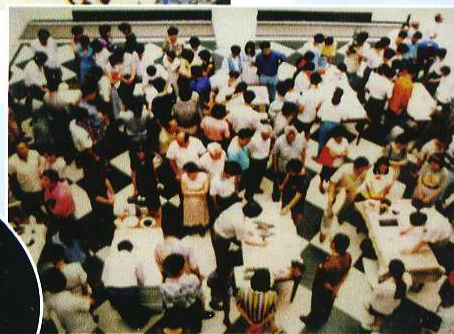
中国名家笔会市南书画展