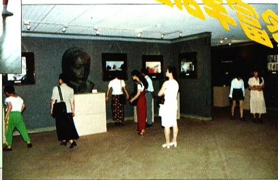
展览厅在展 出艺术作品