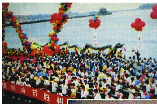
“海之情”旅游节开幕式电子琴演奏