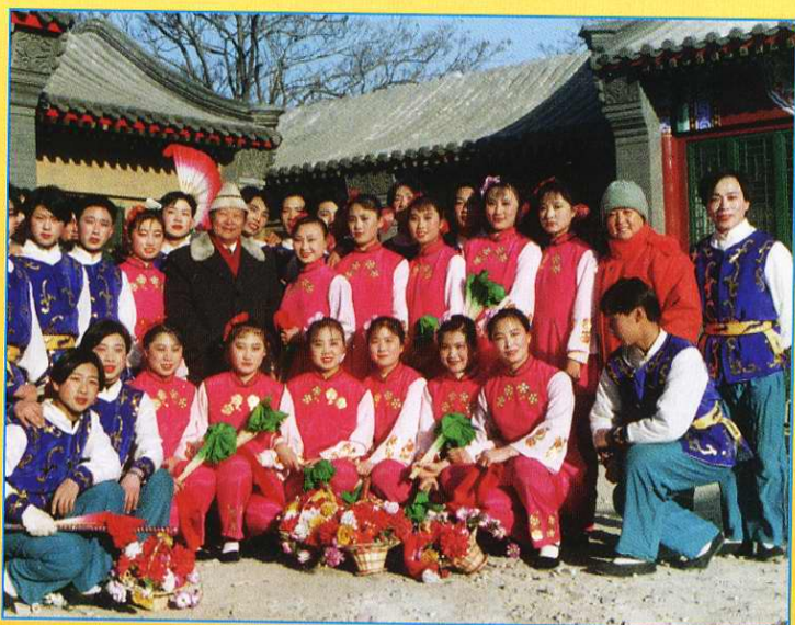
中国舞协副主席、著名舞蹈家贾作光先生与“井陘拉花”部分演员合影。