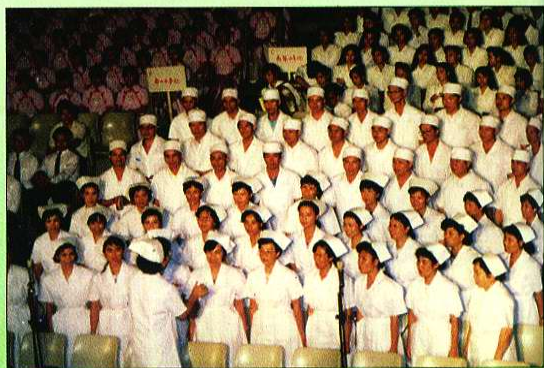
馆办庆祝“七一”千人革命歌曲大汇唱