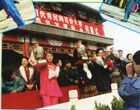
在第十届“龙潭杯”全国优秀民间花会大赛中《井陘拉花》获优胜奖，图为演员领奖。