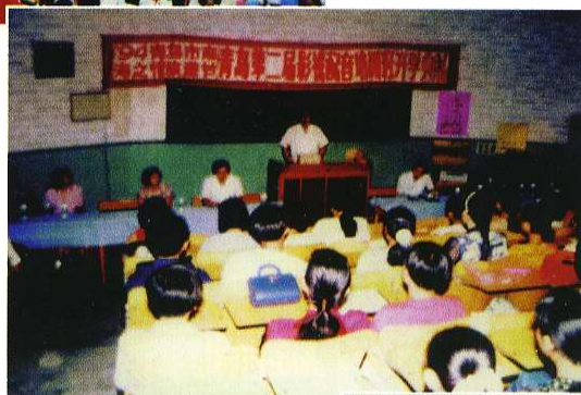
影视配音培训班的学员在上课