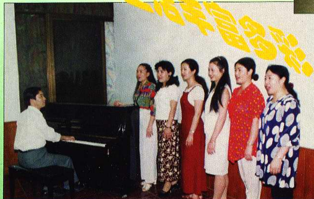
女子合唱团部分演员在排练