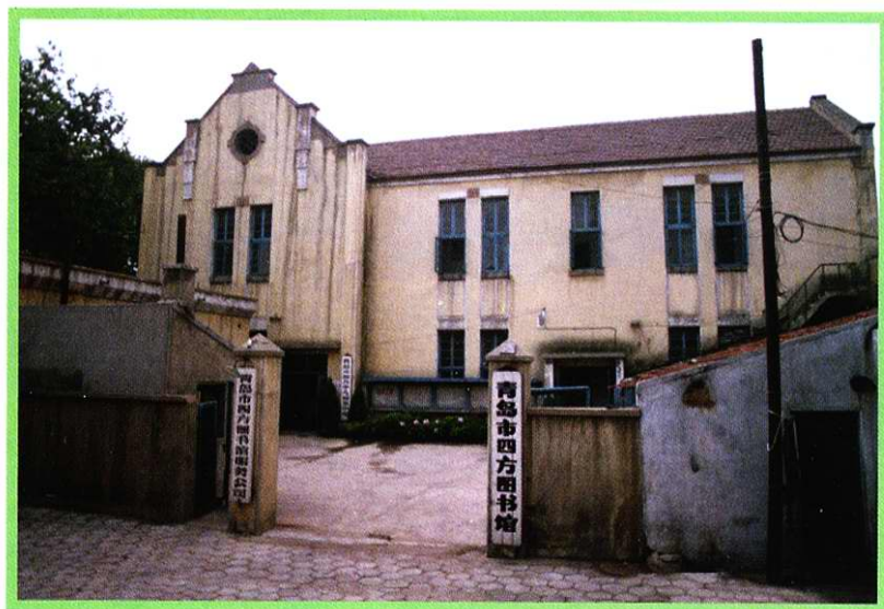
原四方文化馆馆舍