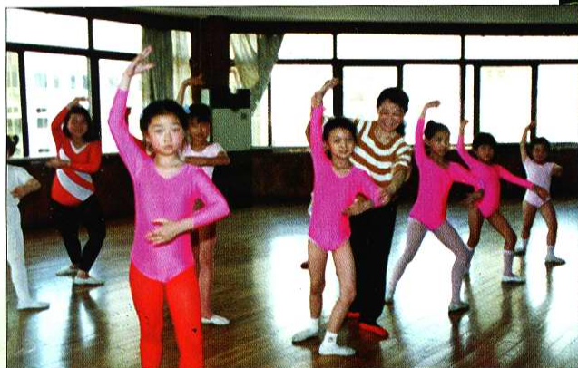
少儿舞蹈培训班在上课