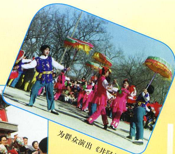
为群众演出《井陘拉花》