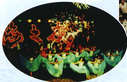
“海之夜”大型歌舞《兰色的爱》