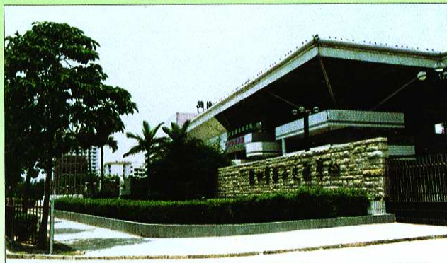
深圳市南山区文化馆 (文体中心) 正门