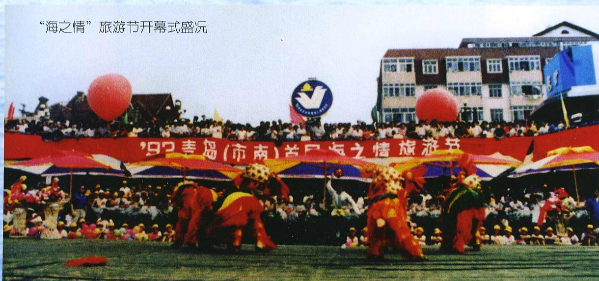
“海之情”旅游节开幕式盛况