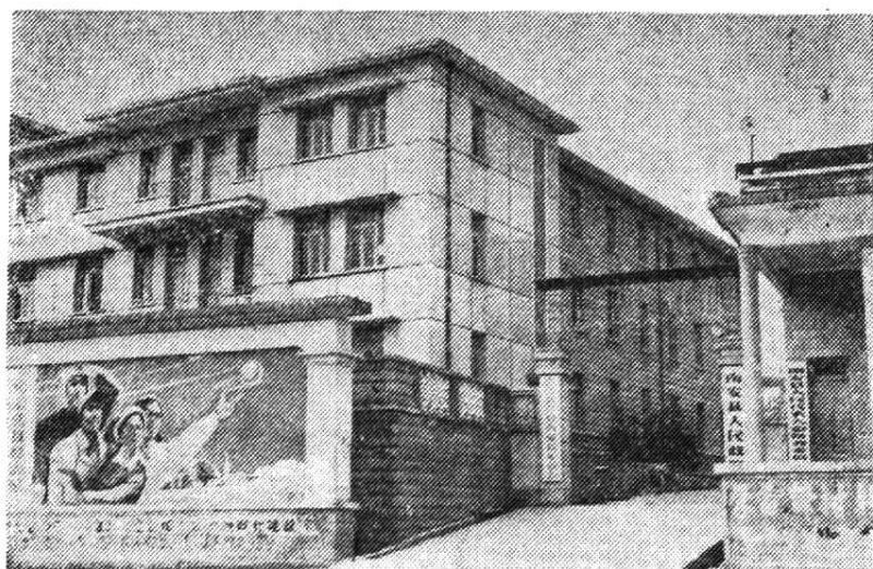
南 安 县 人 民 政 府 大 楼