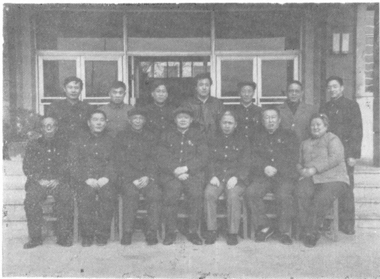
《泰安市物价志》编纂委员会成员