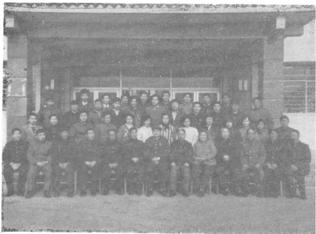
泰安市物价局机关全体同志