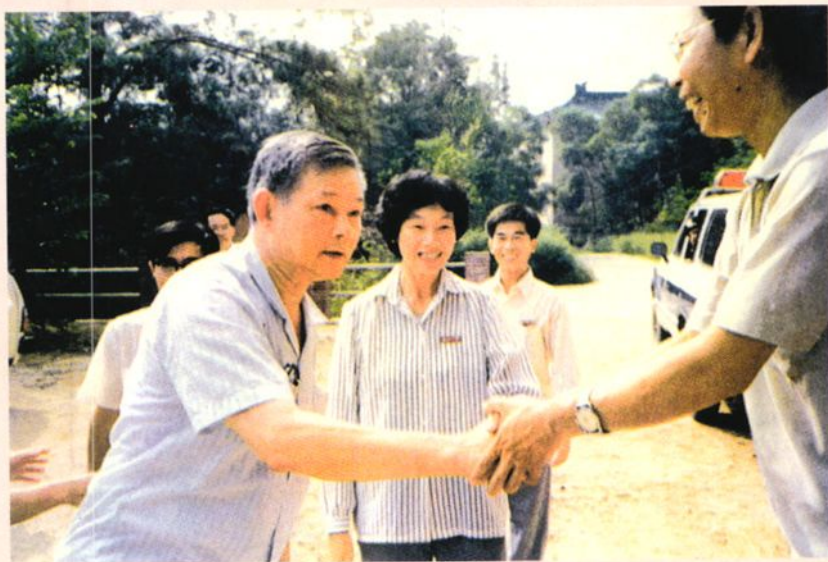
▶1988年9月17日，广东省省长叶选平视察台山一中。图为叶选平（左一）和教师亲切握手。