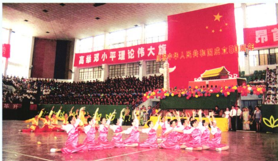
► 外籍教师参加文艺表演