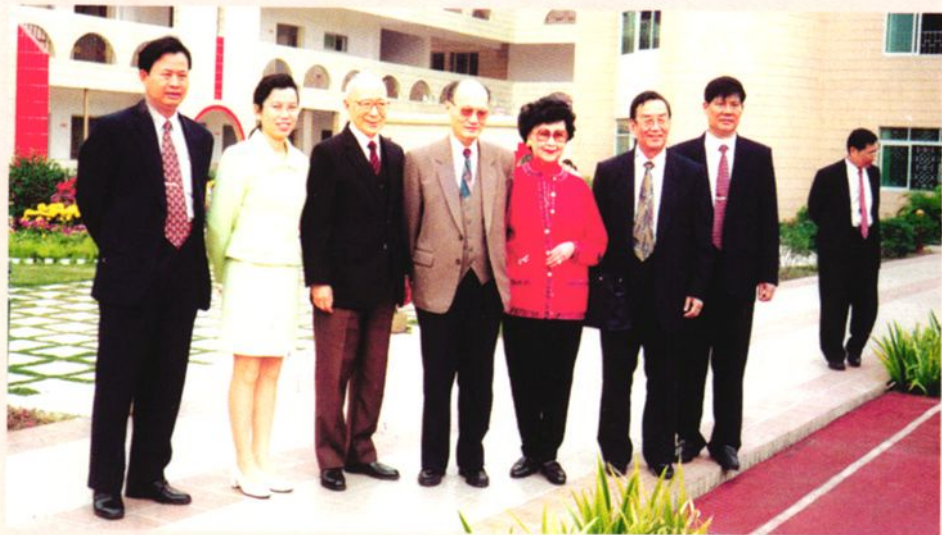
▶1998年1月4日，国家教委主任朱开轩（前排中）等领导视察马兰芳幼儿园，与捐建人伍舜德伉俪（左三、五）及市委常委陈金明（左一）、教育局局长蔡炳乐（前排右一）等合影。