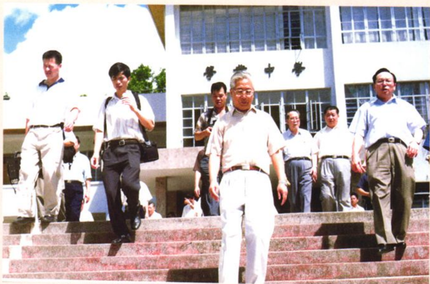
▶1999年6月，全国政协副主席张思卿（前）在市委书记黎力行（右一）陪同下，视察学业中学。