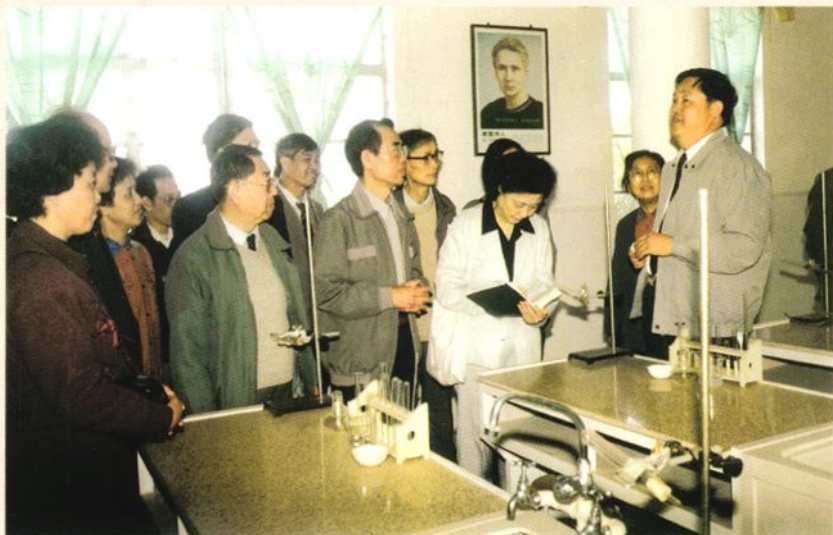
◀1992年11月29日,北京大学等54所大学的领导、教授、专家一行100多人,前来参观中小学校的教学设施设备。