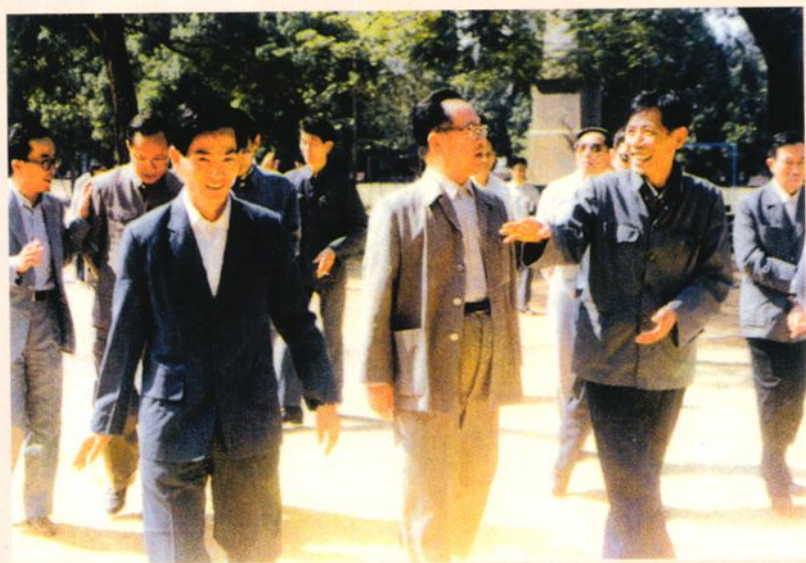
▶1985年11月11日，国务委员谷牧（前排中）视察台山一中。