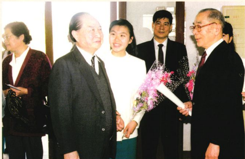
▲1993年3月,上海市原市长、海协会会长汪道涵(左二)在教育局副局长蔡炳乐(右二)陪同下视察市少年宫。图为汪道涵与少年宫捐建人伍舜德亲切交谈。