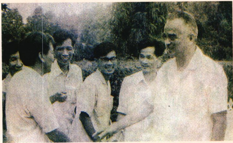
（右一）视察台山一中。 ▶1984年7月24日，广东省省长梁灵光