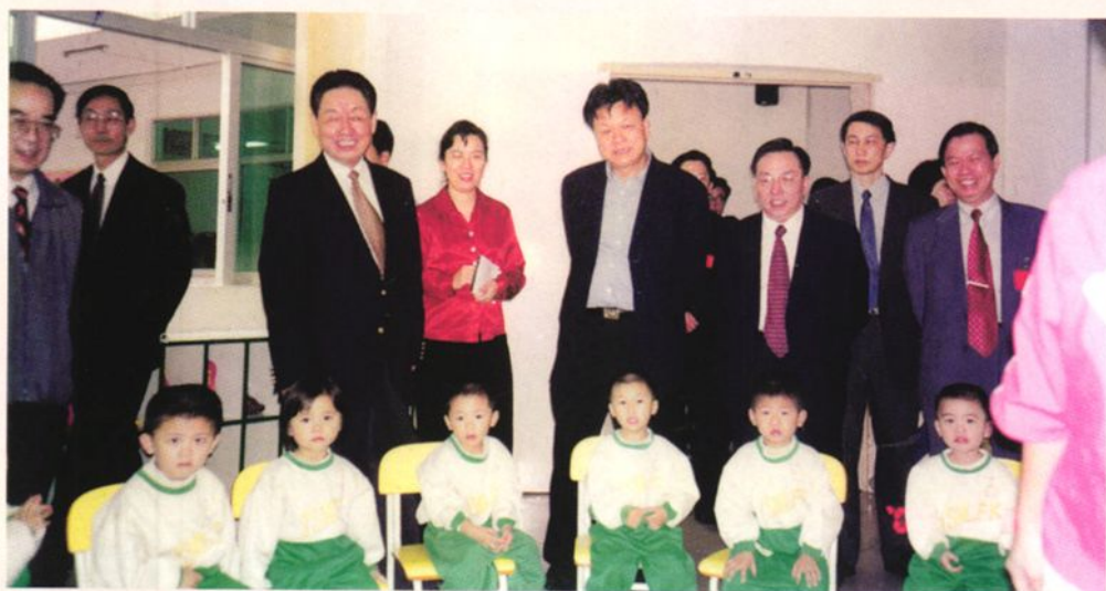
▶2000年4月12日，国务院侨务办公室主任郭东坡（立左三）一行视察马兰芳幼儿园，与小朋友合影。