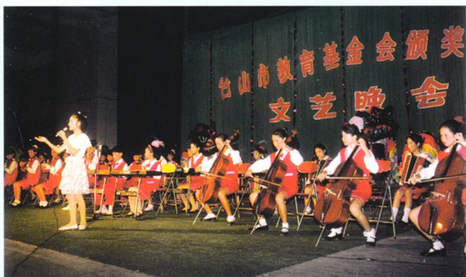
市教育基金颁奖大会文艺晚会