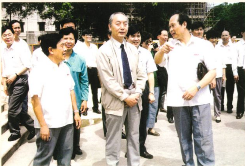
◀1994年10月,国家教委师范司副司长孟吉平(前排中)视察台山师范学校。