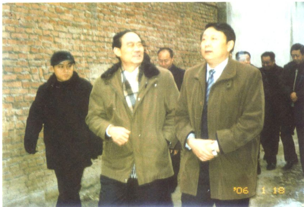
济南高新区党工委书记、管委会主任孙晓刚来村视察工作