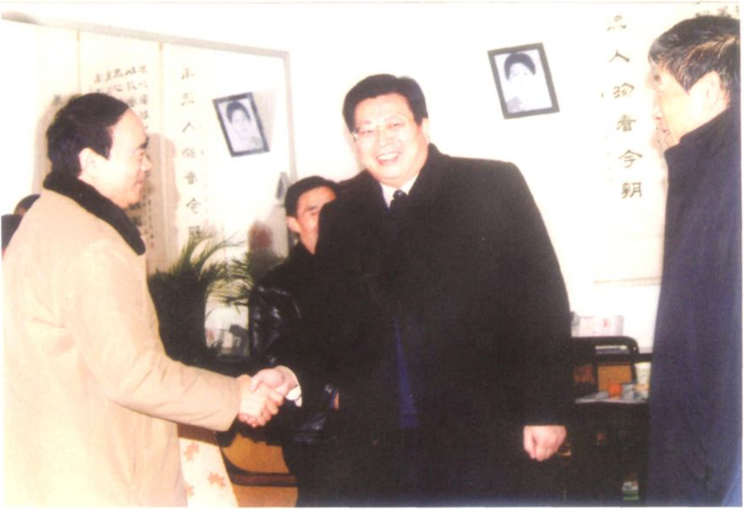
济南高新区党工委书记、管委会主任苏树伟来村视察工作