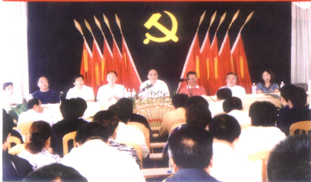
旧村改造、庆六一大会会场