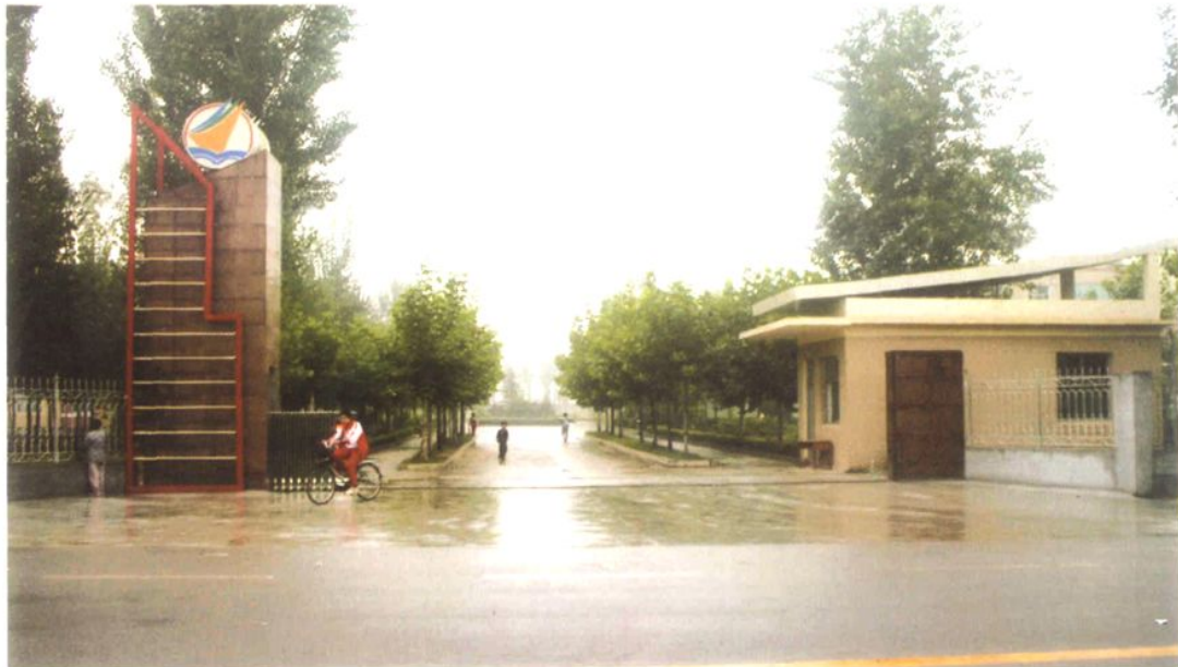
济南高新区孙村小学