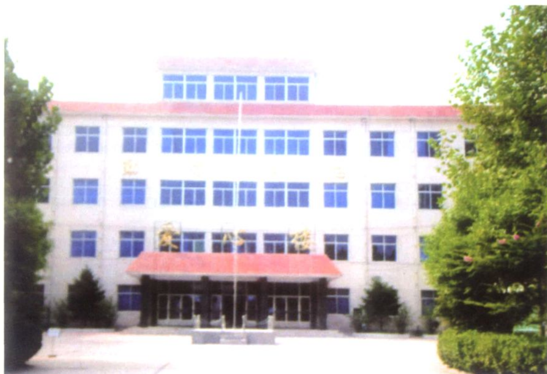
济南高新区孙村中学