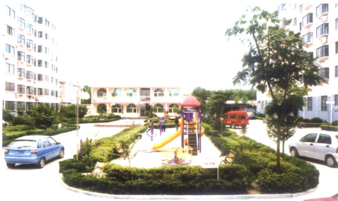
永兴天地园小区内景