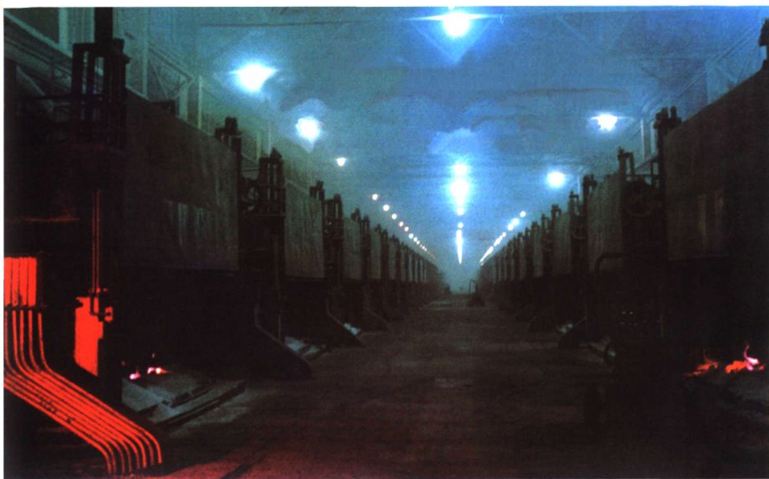
兰州铝厂使用干法烟气净化装置后的电解车间