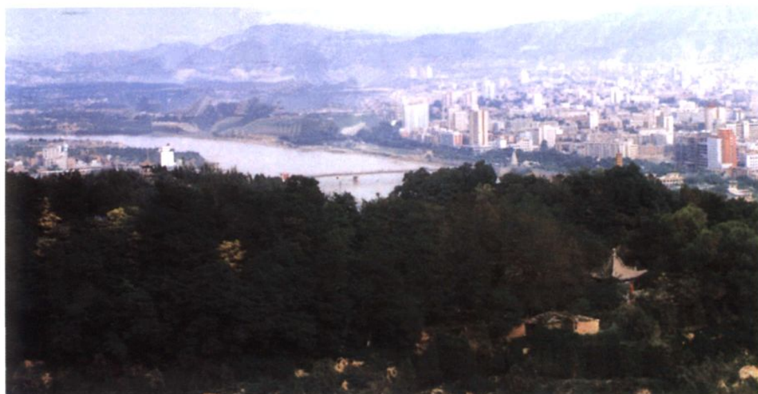
20 世纪 80 年代兰州市全景