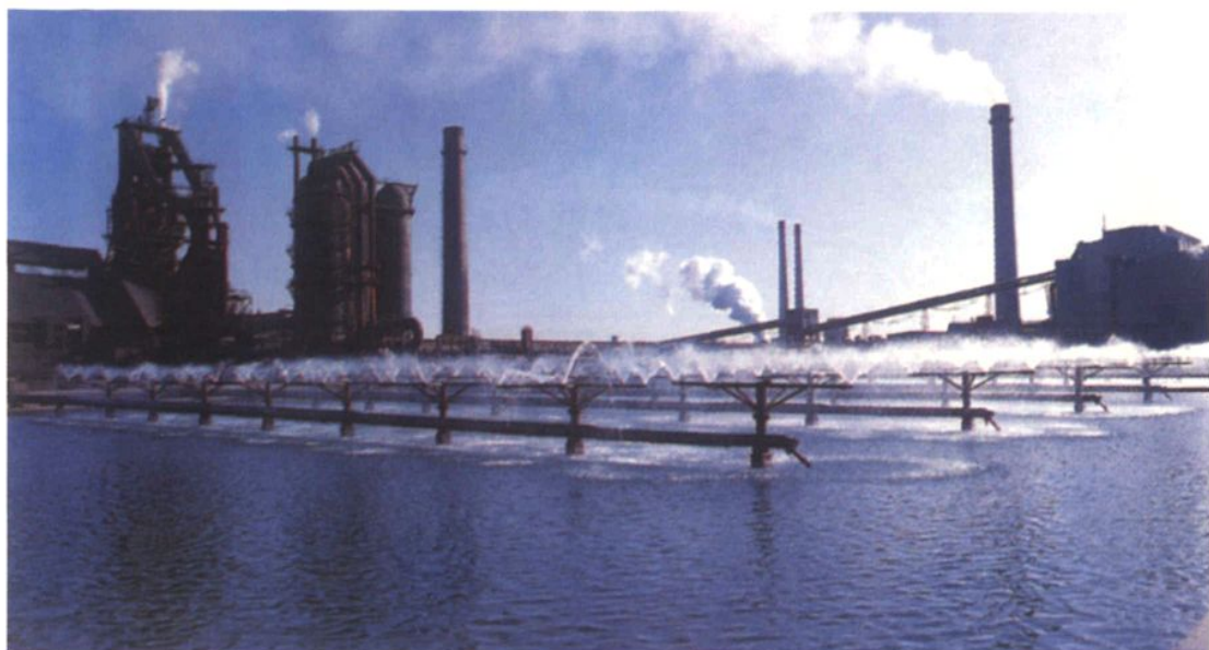
玉门石油管理局炼油化工总厂循环水处理装置