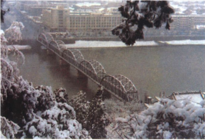
20世纪80年代兰州市黄河中山桥雪景