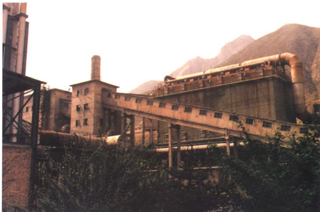
西北铁合金厂硅铁电炉大布袋除尘器