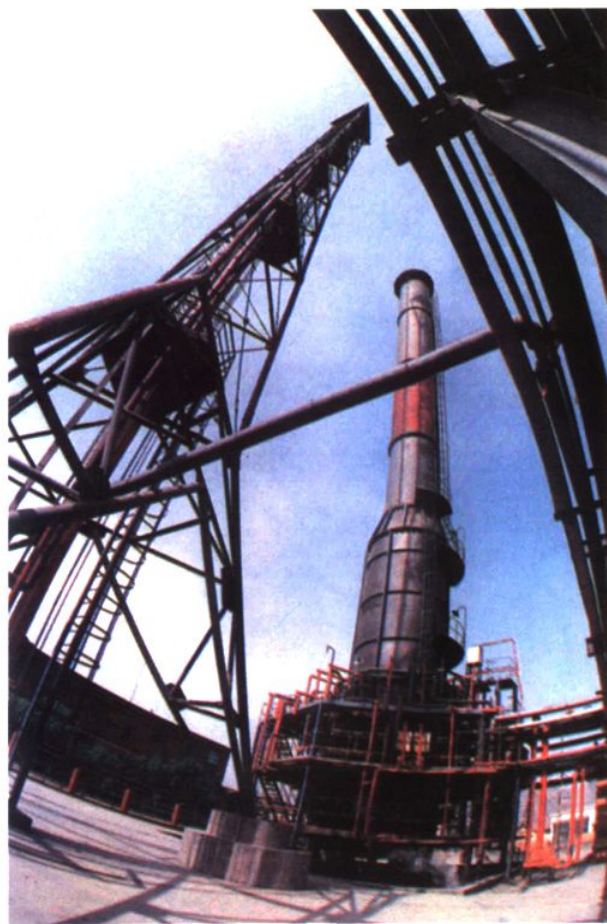
兰州石油化学工业公司丙烯腈处理含氮污水焚烧装置