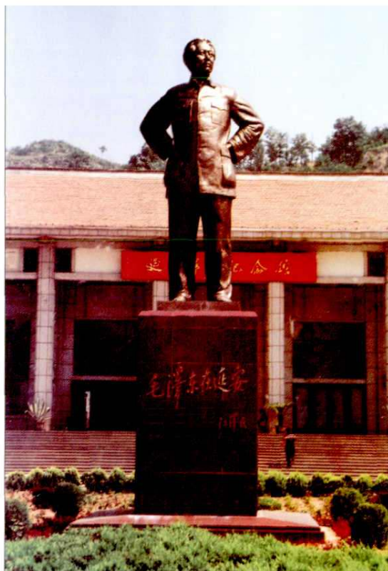
延安革命纪念馆毛泽东铜像