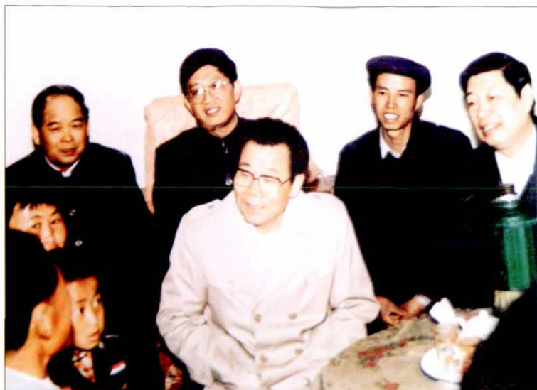
1990年4月，中共中央政治局常委、书记处书记李瑞环（中）来延安视察