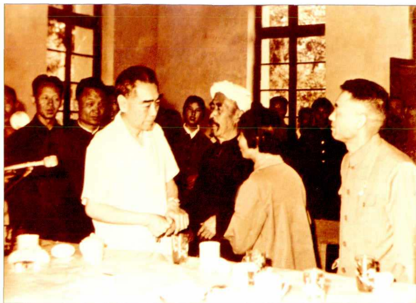
1973年，国务院总理周恩来(左前一)回延安，和枣园群众在一起