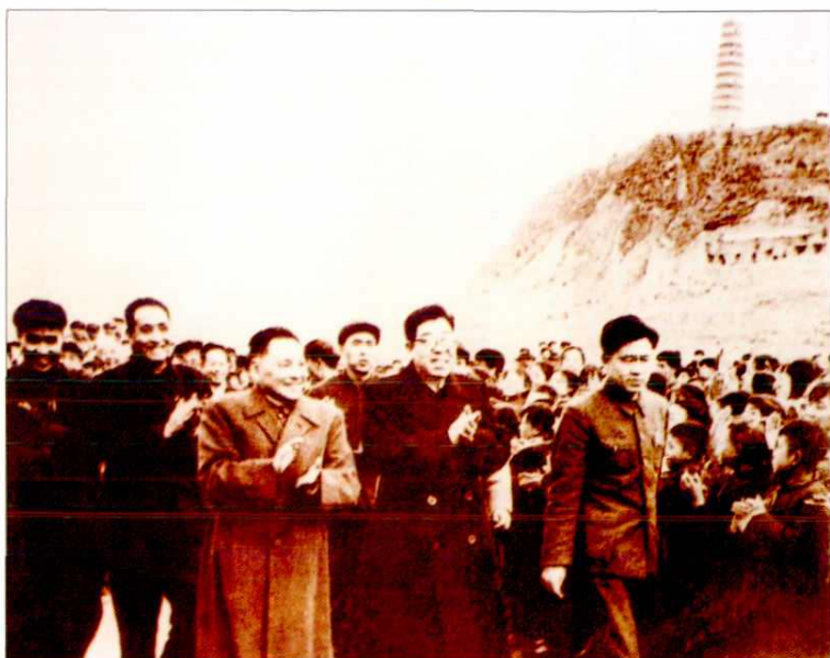
1966年3月，中共中央委员会总书记邓小平(左三)来延安视察