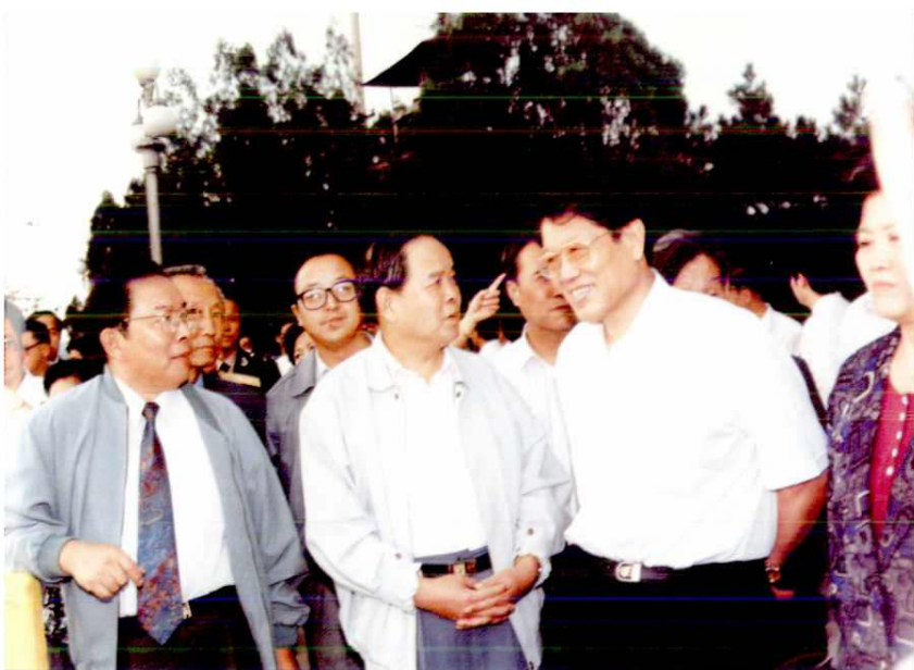
1995年7月，中共中央政治局委员、国务委员李铁映（右二）来延安视察