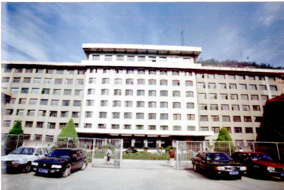
延安地委行署办公大楼