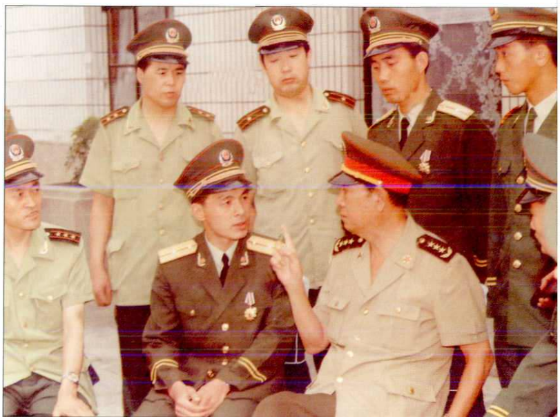
1995年8月，中央军委副主席张万年（前左三）来延安视察