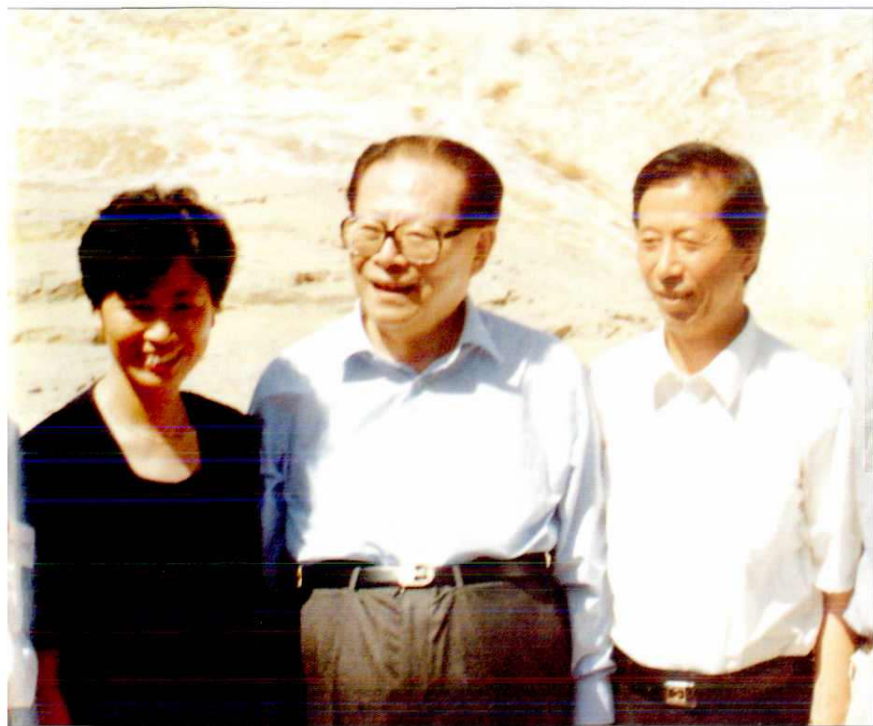
1996年2月，国务院总理李鹏（左一）来延安视察与群众共度春节