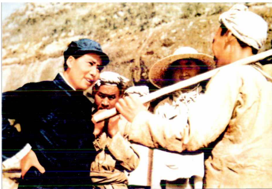
1939年，毛泽东同 杨家岭农民谈话