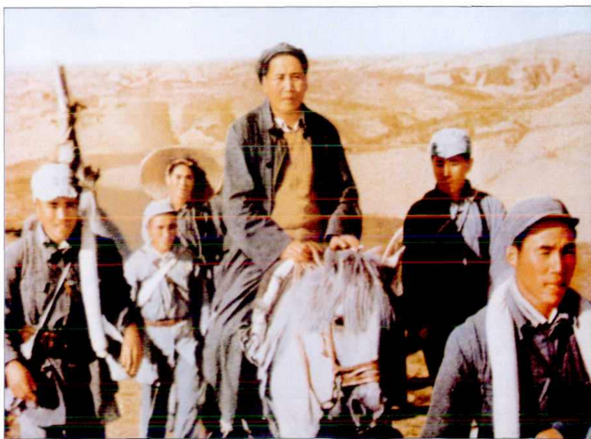
1947年，毛泽东 转战陕北途中