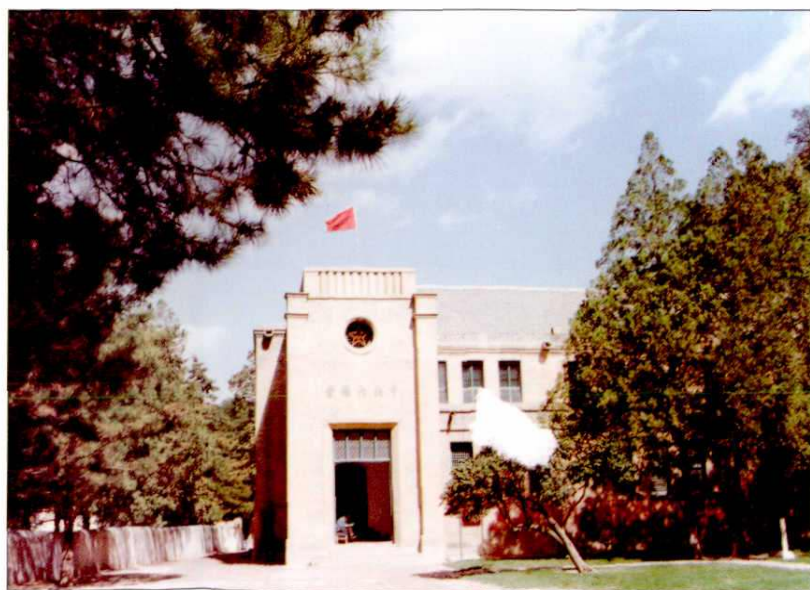
杨家岭中央大礼堂