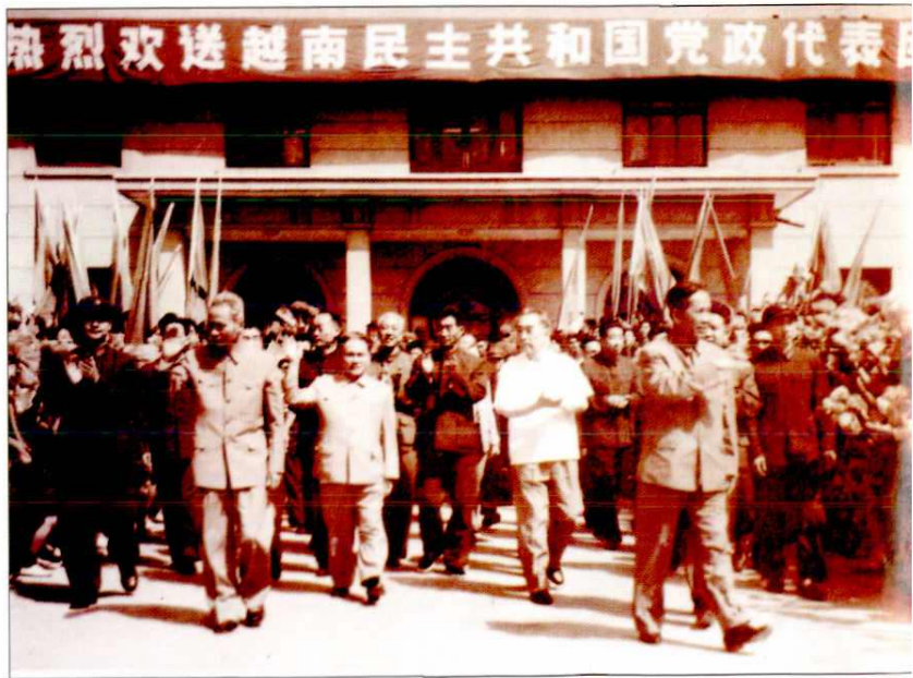
1973年，国务院总理周恩来陪同越南党政代表团访问延安