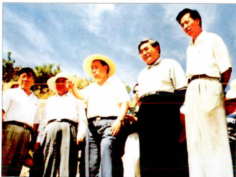
1996年8月，中共中央政治局委员、国务院副总理姜春云（右三）来延安视察