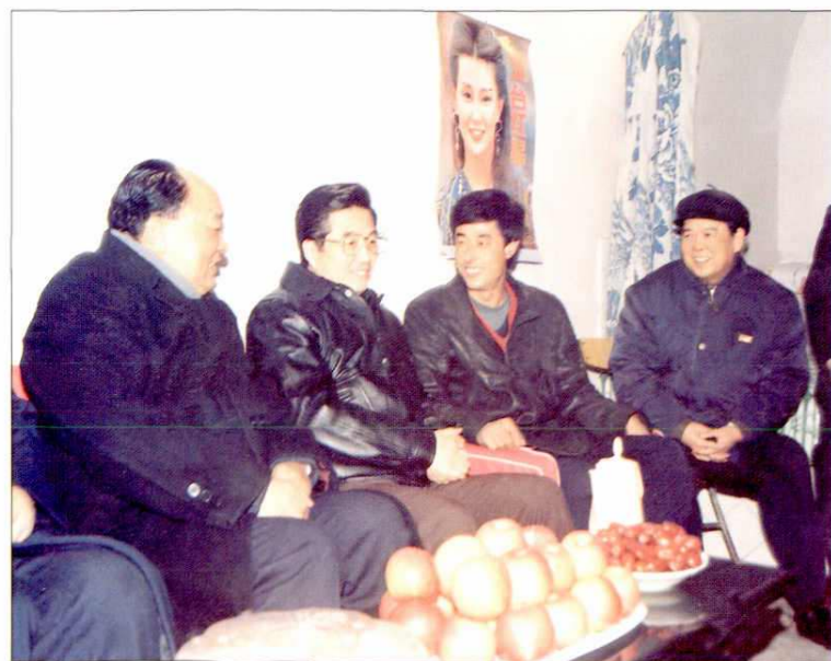
1995年12月，中共中央政治局常委、书记处书记胡锦涛（左二）来延安视察