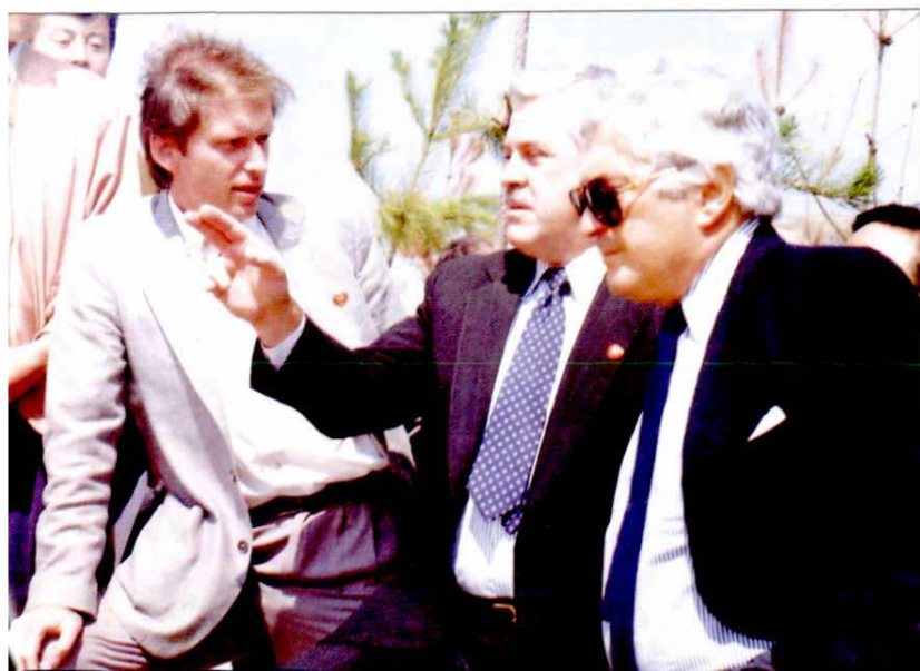
1995年，世界银行行长沃尔芬森(右一)来延安检查延河流域贷款项目