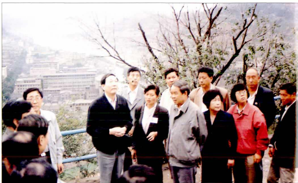
1992年8月，国务院副总理朱镕基（左二）来延安视察