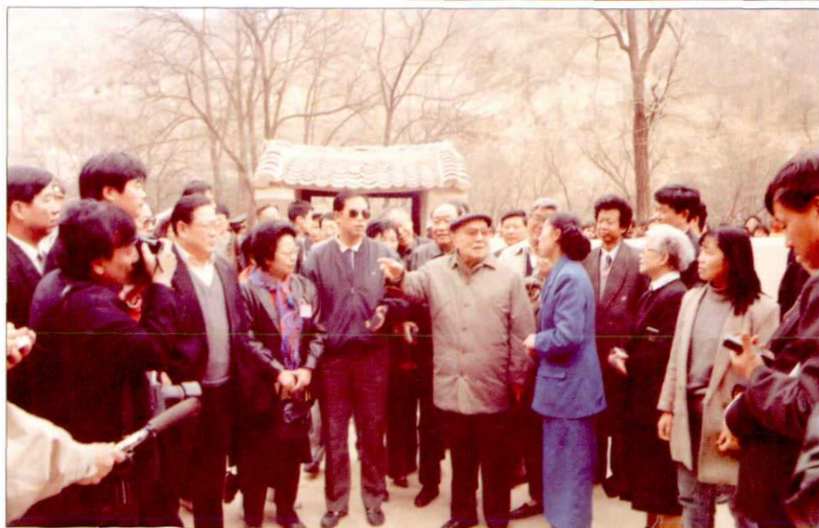
1996年4月，原国家主席杨尚昆(前右五)来延安视察工作