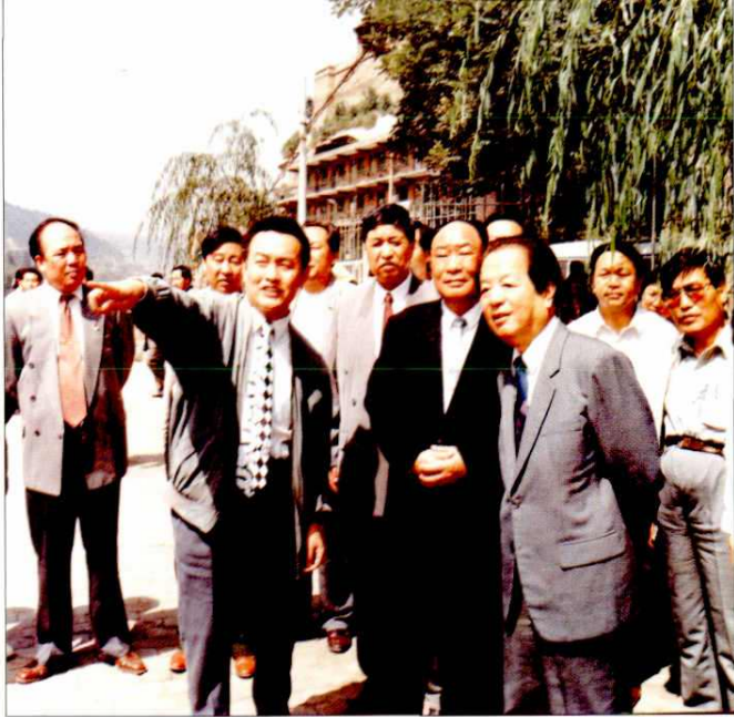
1997年7月，中共中央政治局委员、国务院副总理钱其琛(前排右一)来延安视察