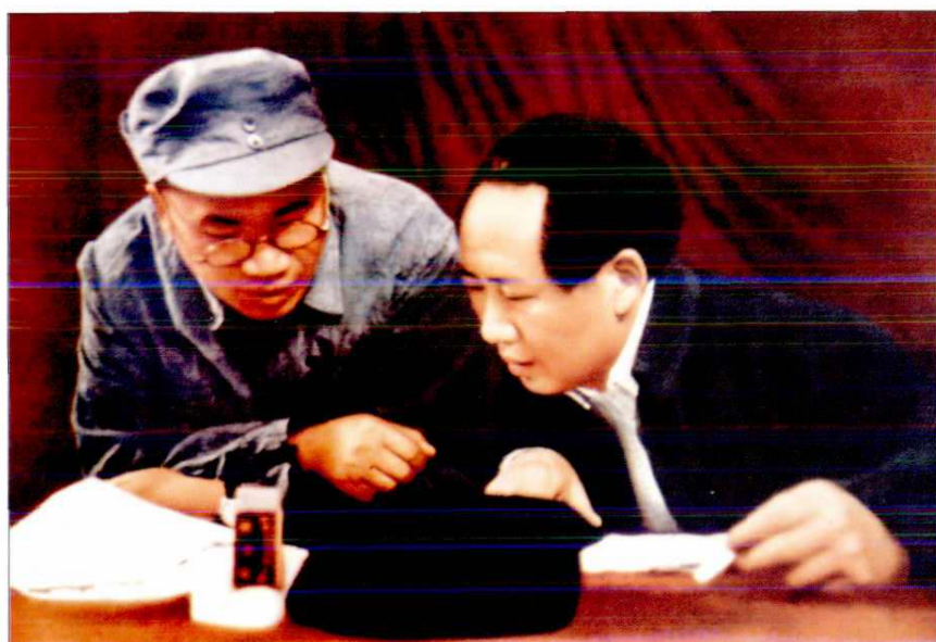
1945年，毛泽东、 朱德研究作战问题