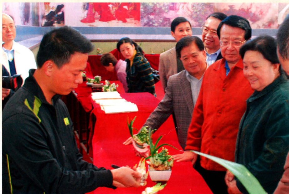
原国家副主席曾庆红，原福建省人大常委会副主任曹德淦，原漳州市委书记刘可清等领导参观水仙花雕刻艺术。