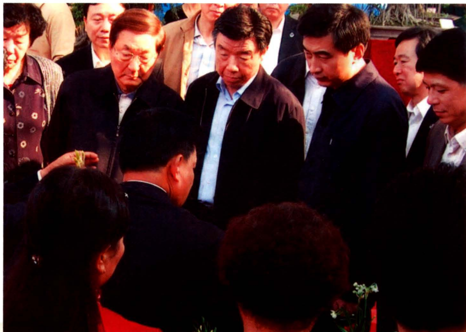
原中共中央政治局常委、国务院总理朱镕基，原福建省委书记卢展工等领导参观视察水仙花产业