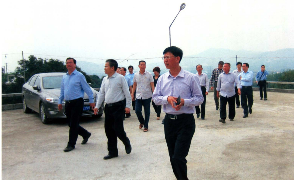
漳州市市委书记陈家东等领导莅临琵琶岩考察调研