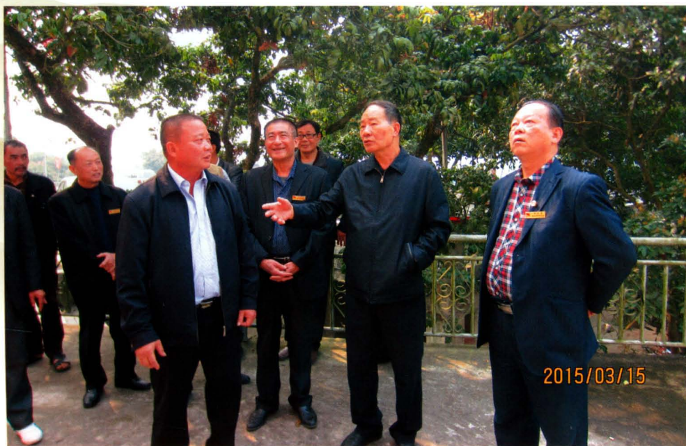
漳州市新四军研究会有关领导莅临琵琶岩参观指导