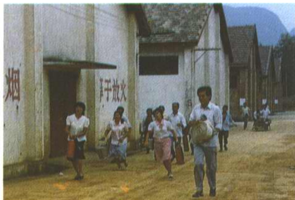
火警就是命令，义务 消防队员奔赴火区情景