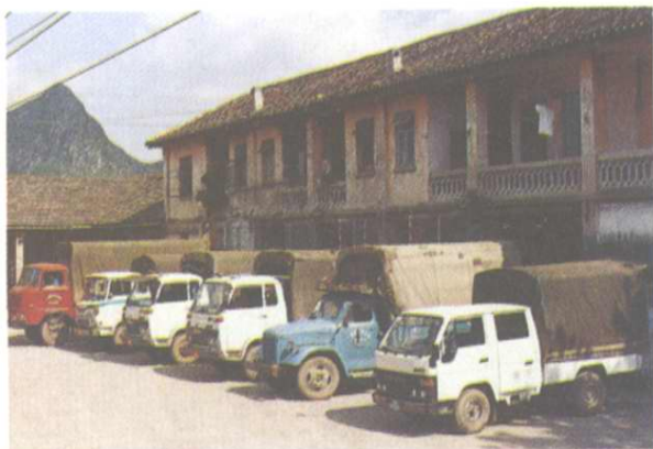
桂林纺织品批发站铁路专用线商品直接装卸月台仓