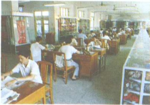
针织品科样品间（3、4图） 商品琳琅满目、供顾客挑选