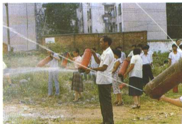
众雾齐发，防范于未然