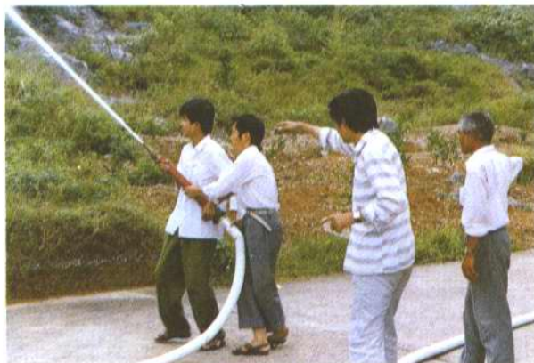
练出一身消防过硬本 领确保仓库安全