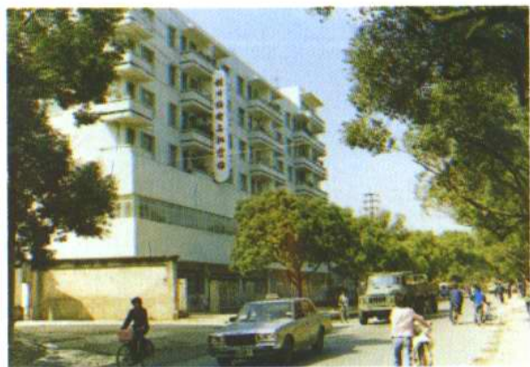
桂林纺织品批发站综合大楼 (1、2图)