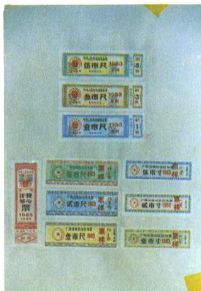
1983年最后一年使用的 军（上）、民（下）定量布 票