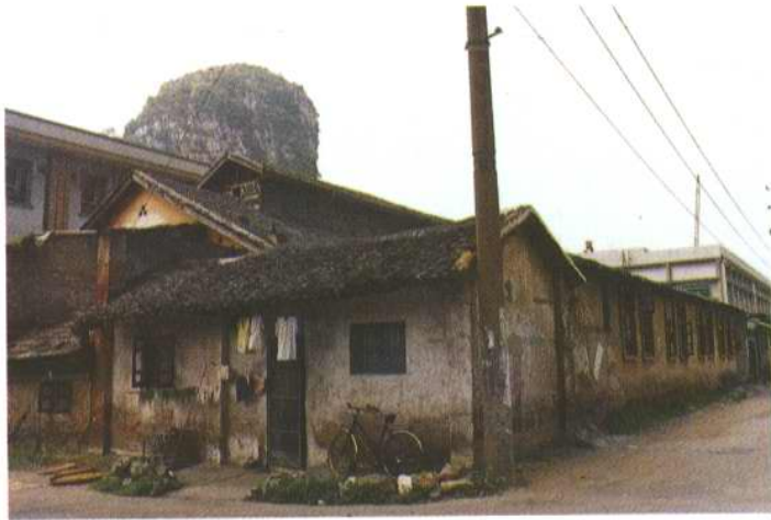
五十年代租用民 房作仓库部份旧址 (1,2,3 图)