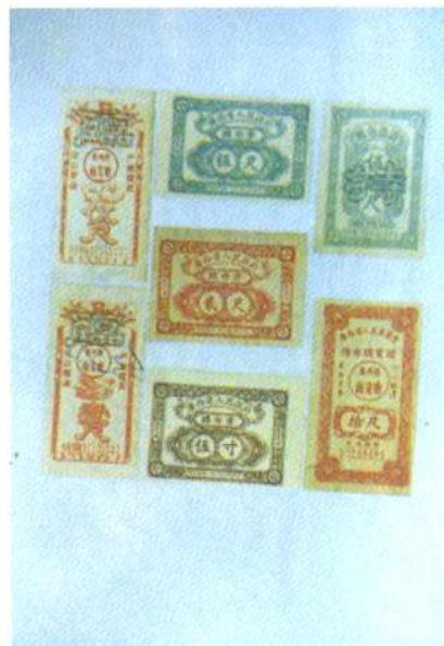
1955—1956年使用的 民用定量布票