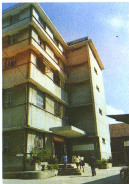
桂林市芦笛路51号 桂林纺织品批发站办公大楼