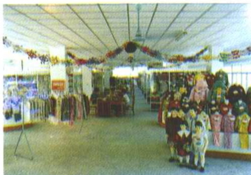
服装科样品间宽敞明亮 五光十色