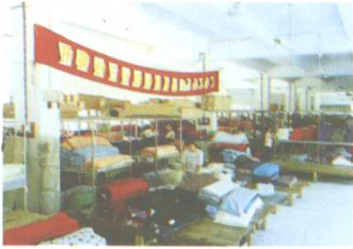
纺织品科样品间（1、2图） 品种齐全颜色鲜艳