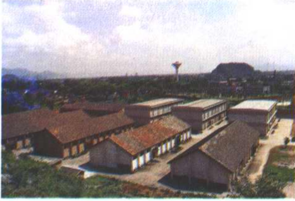
今日换新颜鸟瞰扁山 仓库全貌