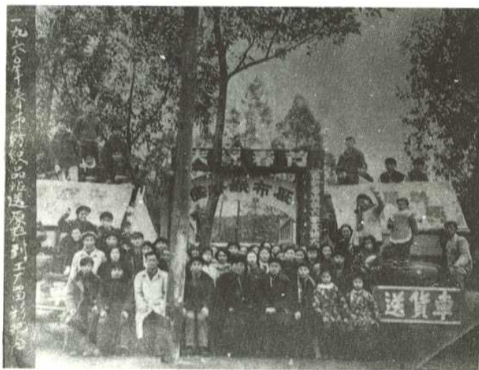
工商鱼水情，桂林站送原料到工厂