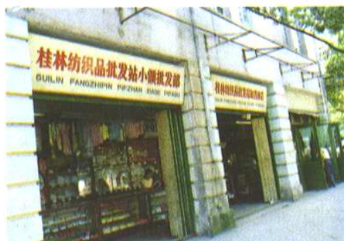
针织品小额批发兼零售 地址 处闹市乐群路口