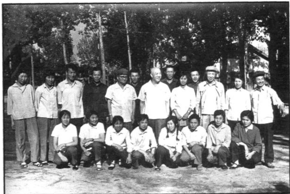
▲ 原吉林省省委书记王恩茂等同志视察我校