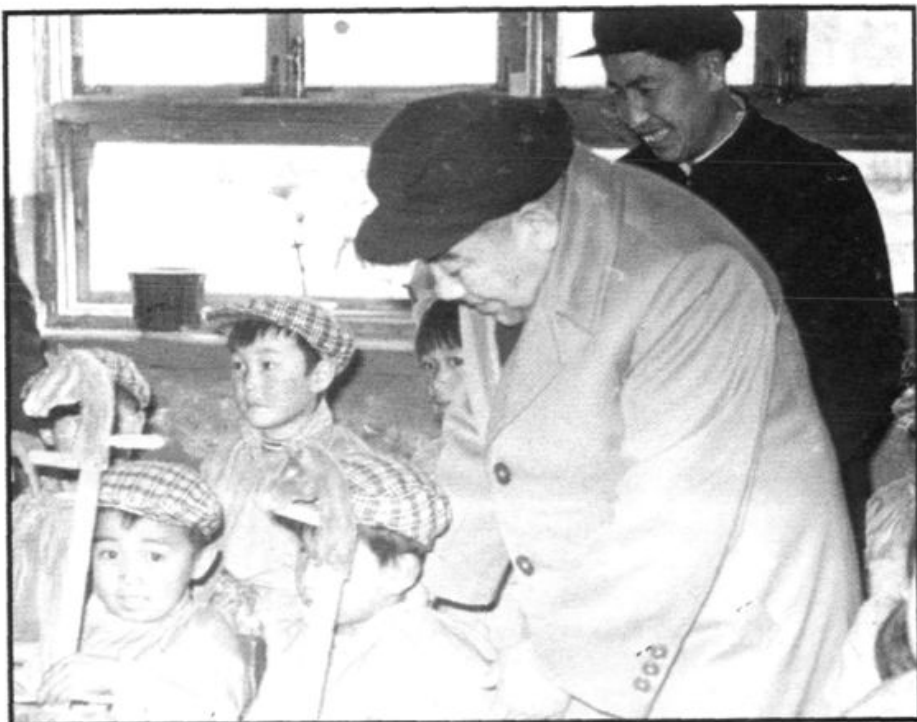
▶ 原自治区主席布赫到我校视察工作