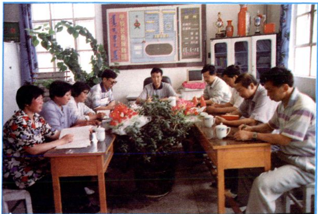
▲ 现任领导班子研究工作