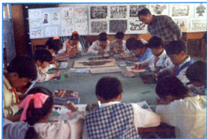
◀ 美术兴趣小组活动