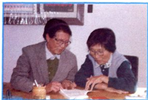
▲ 我校原两位老校长 研究工作