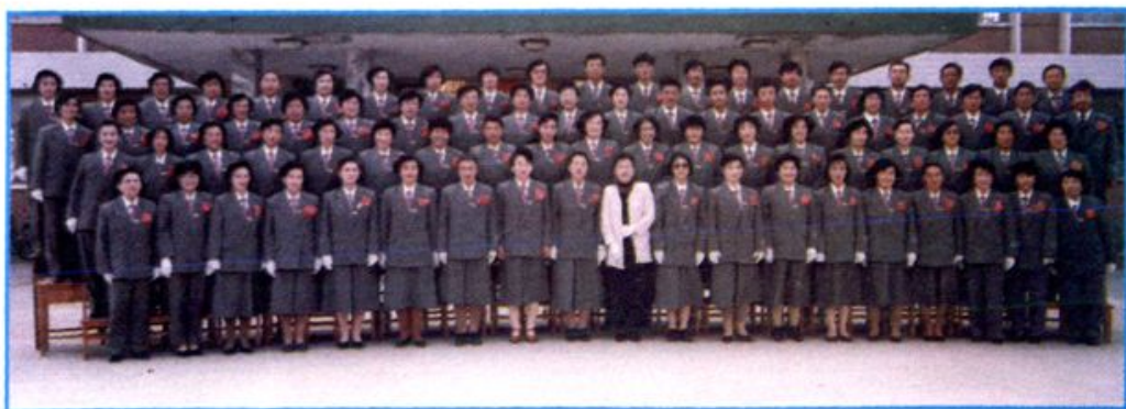
▲ 一九九五年十月在全旗第二届职工合唱比赛获团体第一名