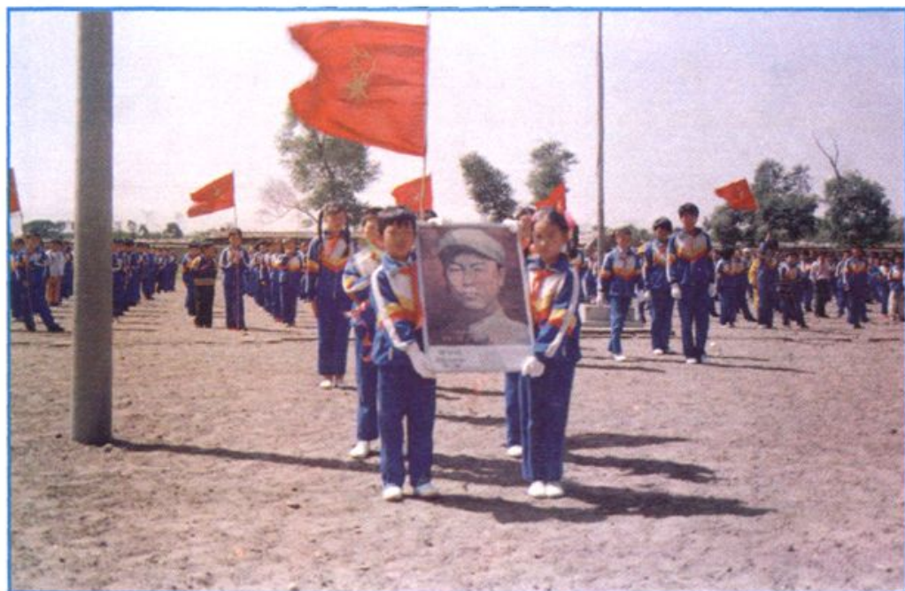
▲少先队大队部开展“向董存瑞学习”活动