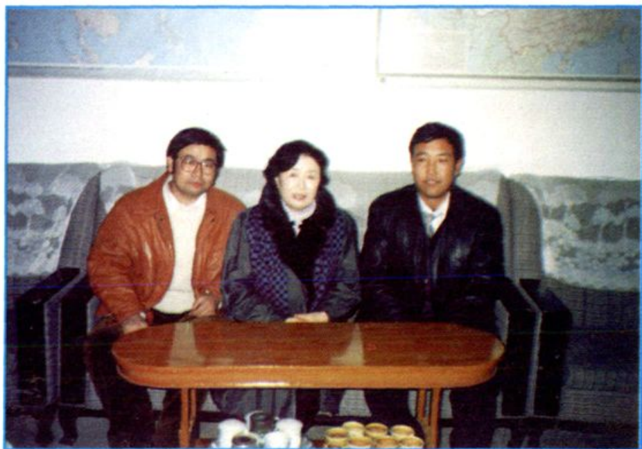
► 南朝鲜汉城女子大学医学博士