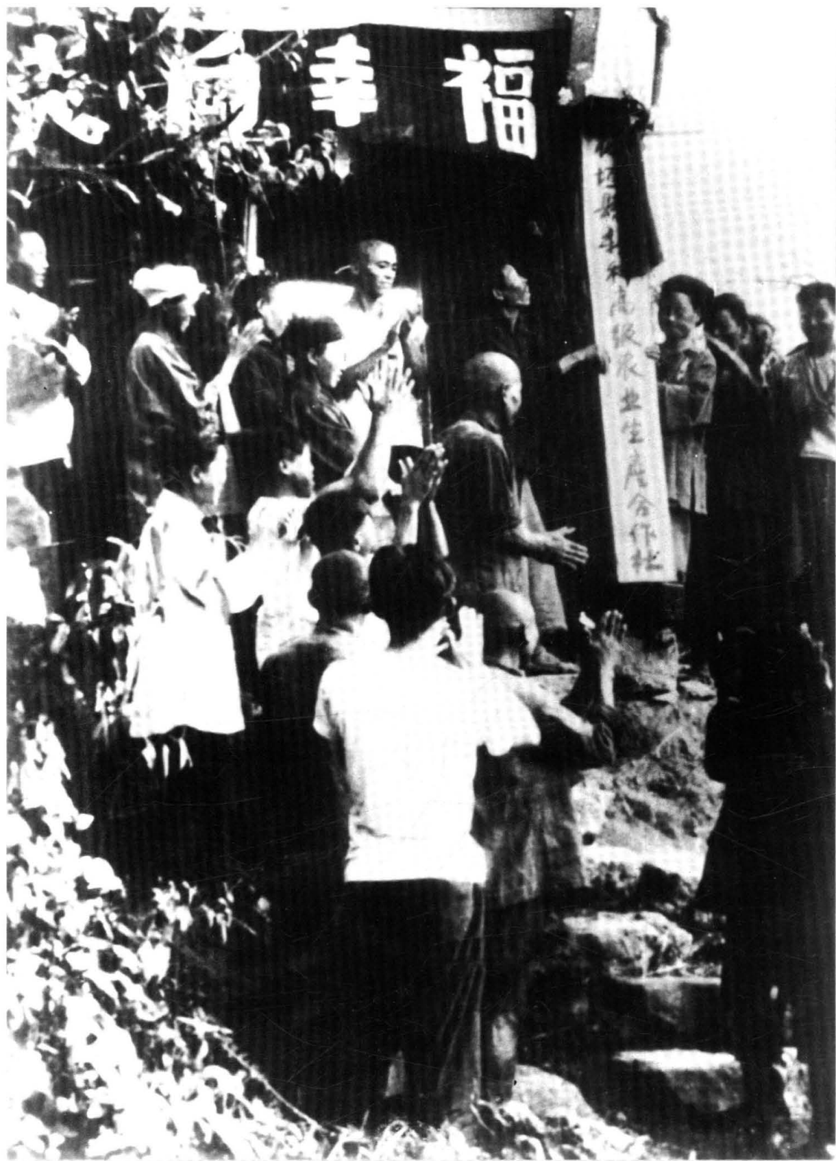
花垣县成立高级农业生产合作社