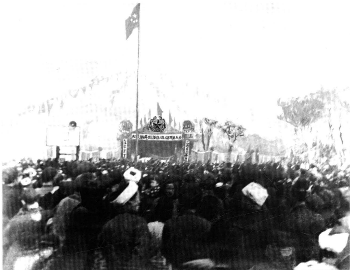
1956年12月，新晃侗族自治县成立，图为成立大会会场