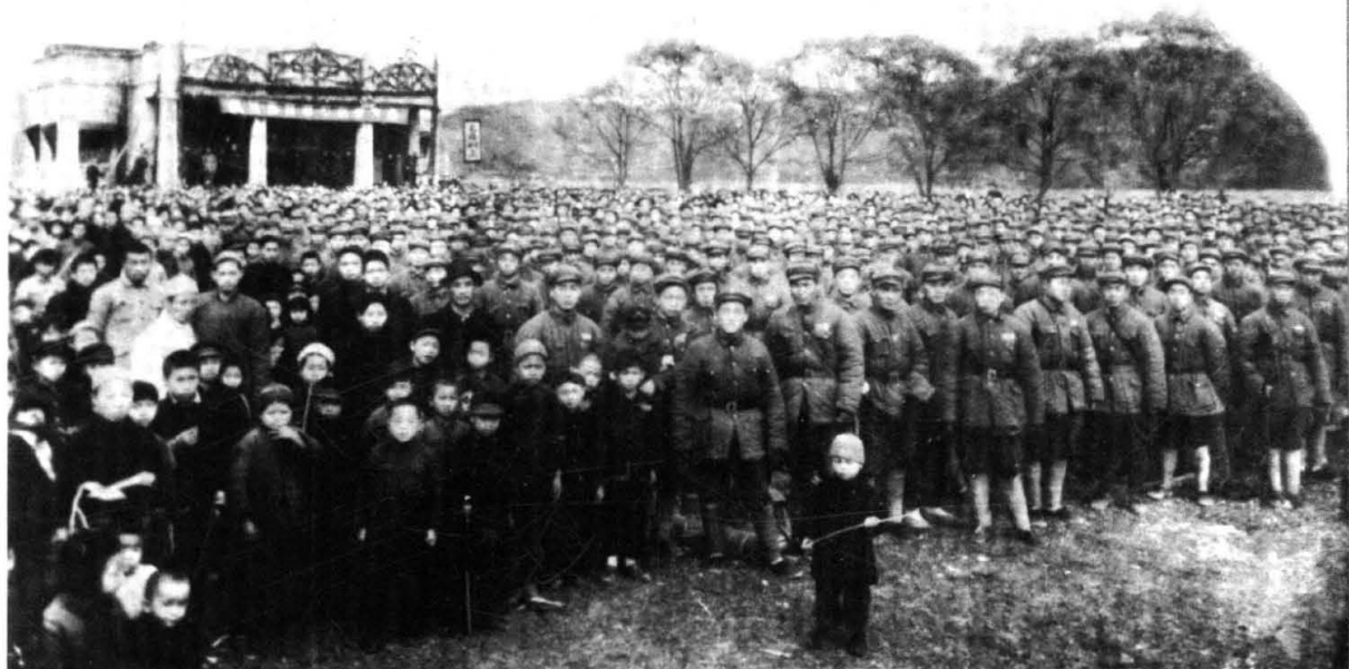
1949年11月，群众庆祝解放晃县，图为大会会场