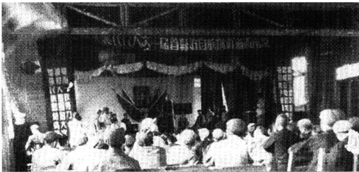
1954年5月，通道侗族自治县成立，图为第一届人民代表大会会场场景