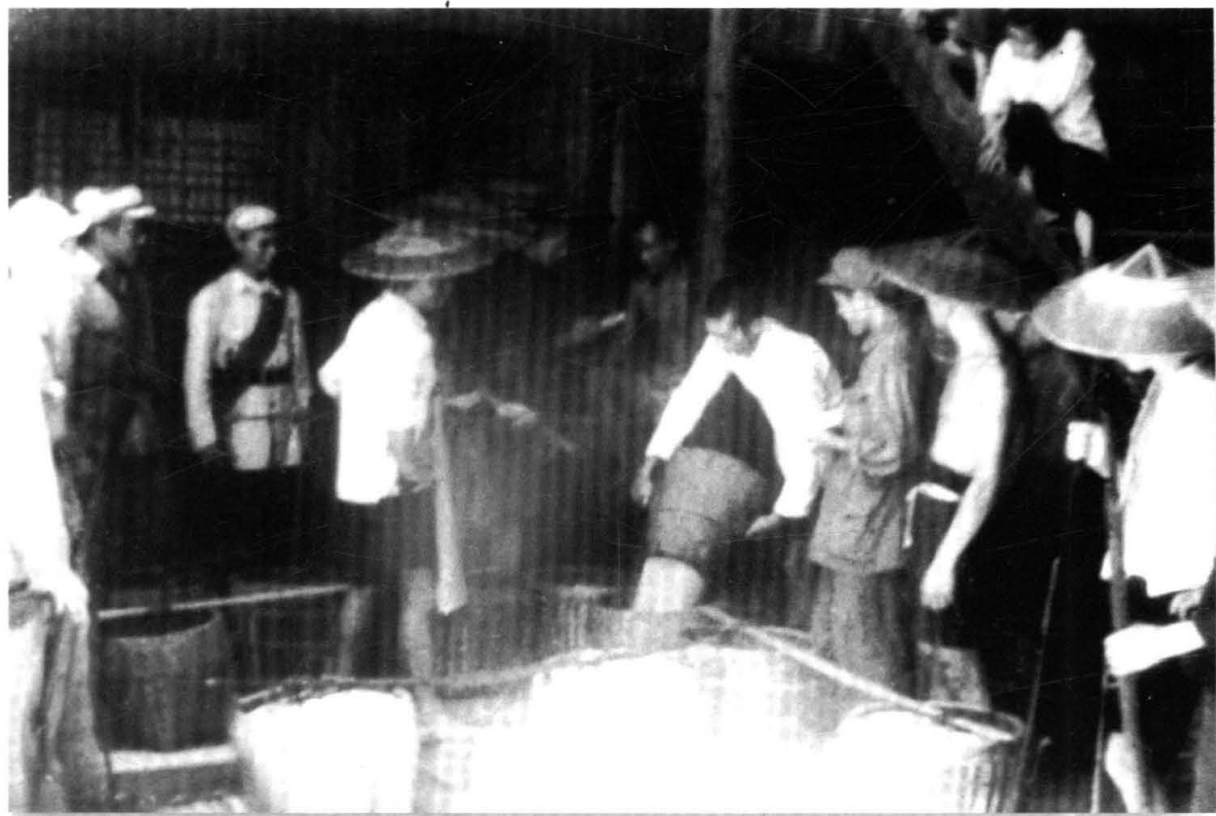
龙山县各族群众踊跃交纳公粮