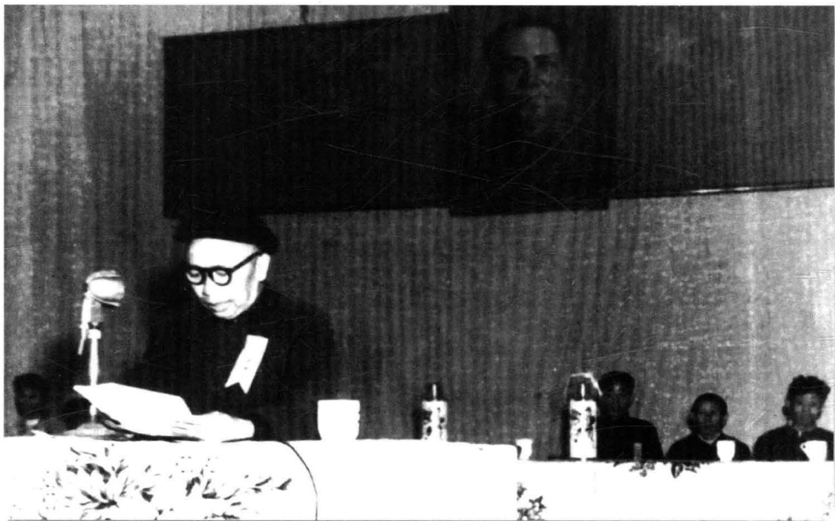
江华瑶族自治县第一任县长赵自现（瑶族）在成立大会上讲话