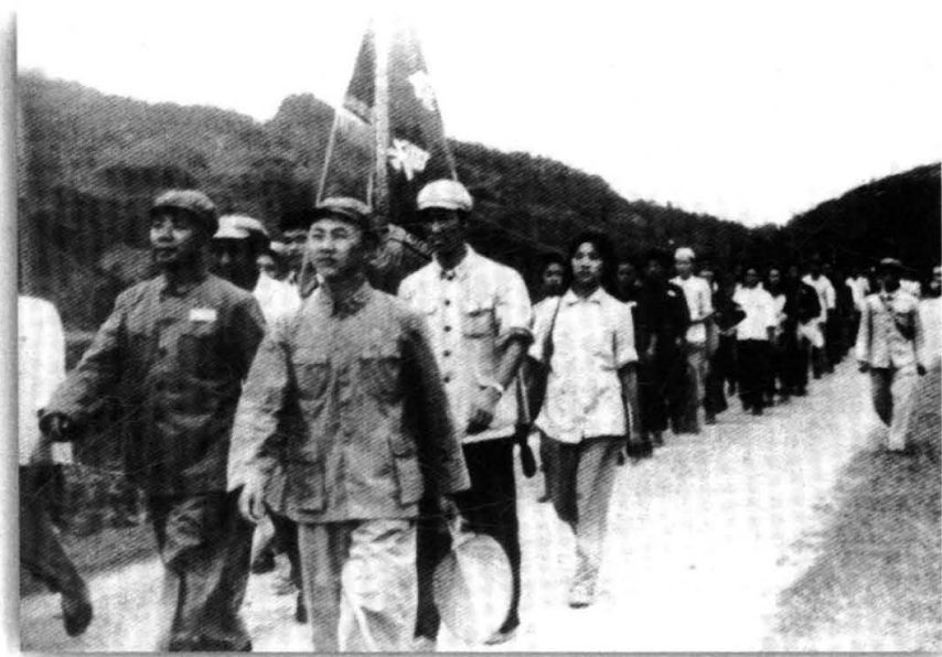
1957年5月，湖南省土家族访问团在湘西州访问