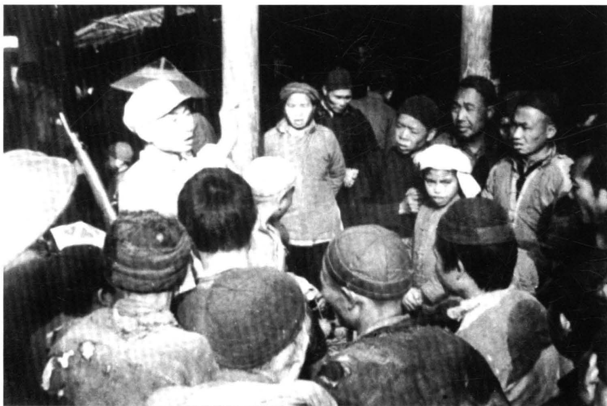
解放军发动群众配合剿匪