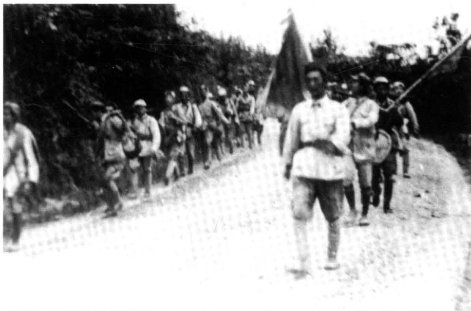
1949年9月，中国人民解放军第二野战军挺进湘西