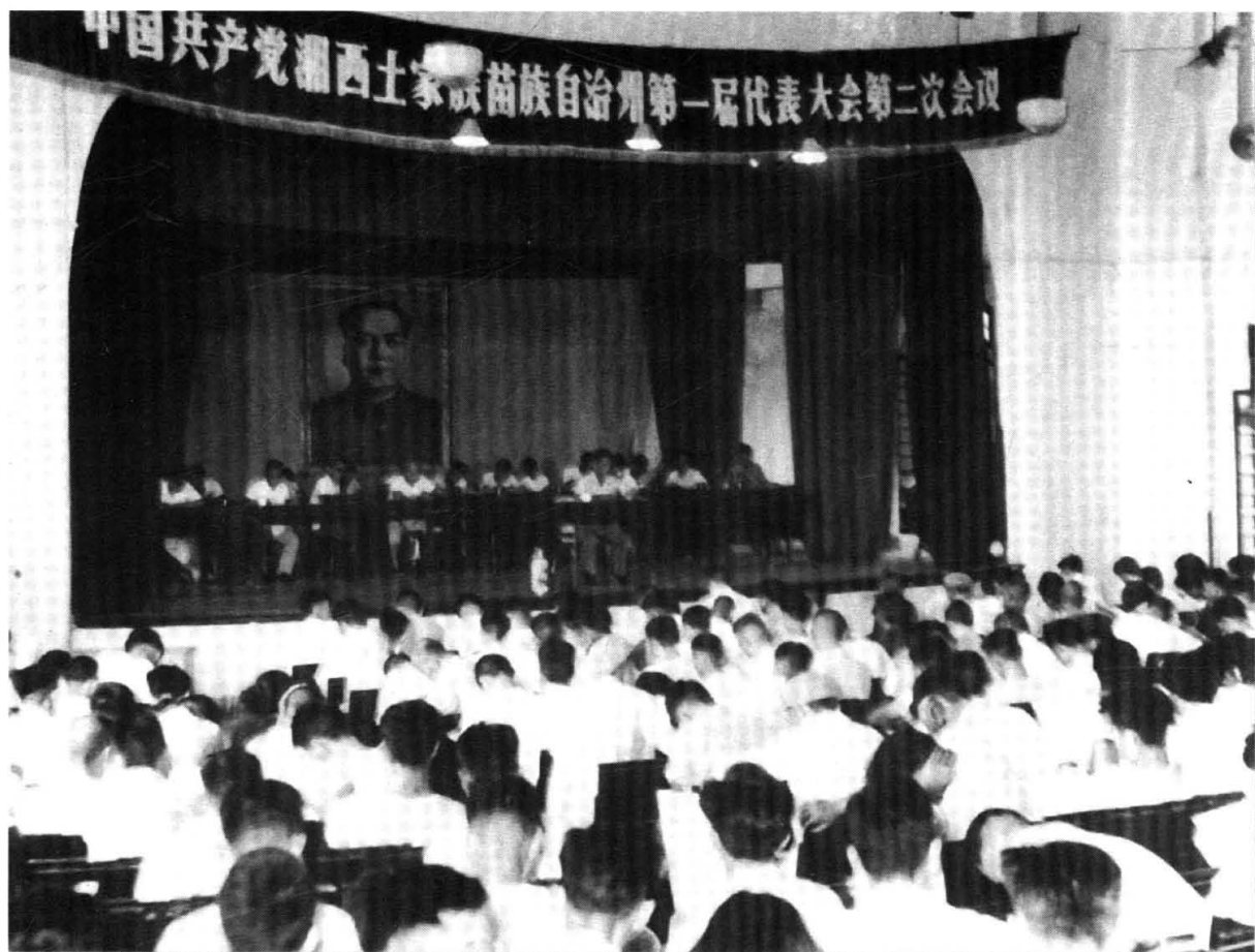
中国共产党湘西土家族苗族自治州第一届代表大会第二次会议会场