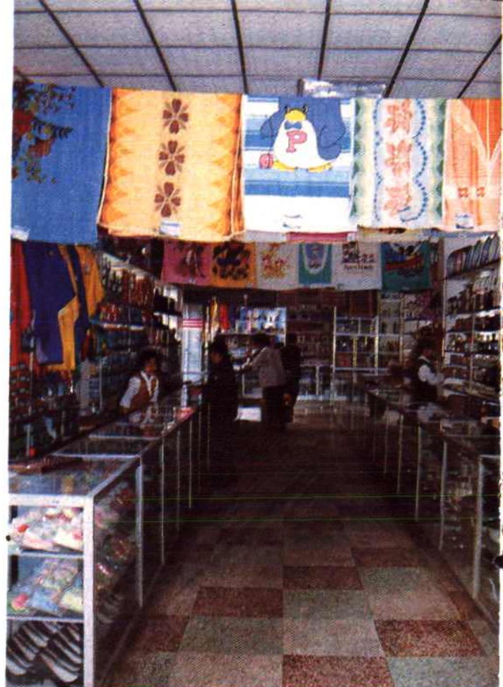
秀山百货公司商品柜台之一部