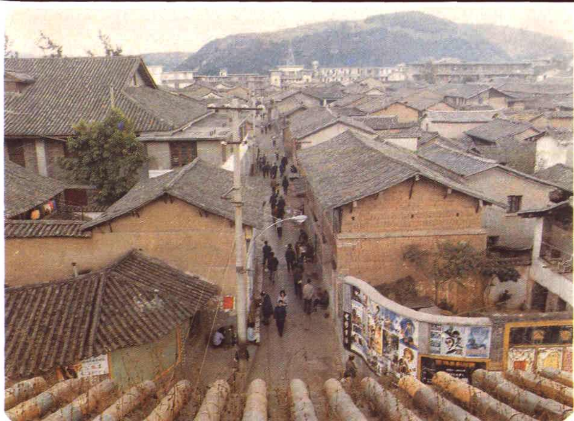
秀山镇老城区一角