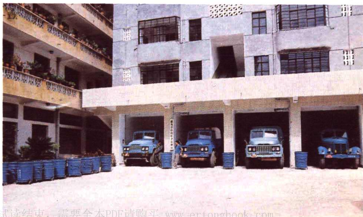
通海县环境卫生管理站