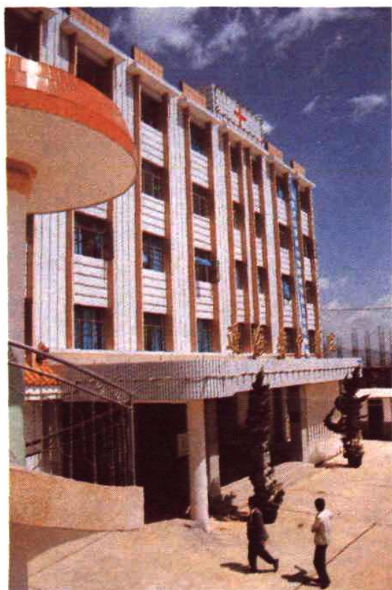
新建的通海县中医院