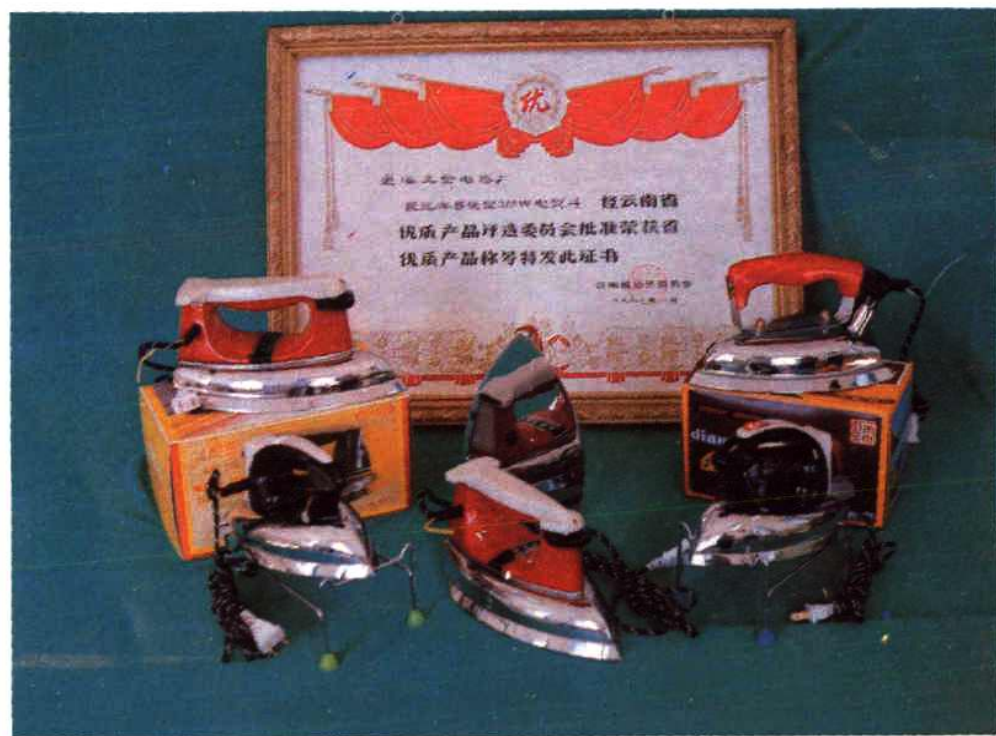
优质产品晨光牌电熨斗