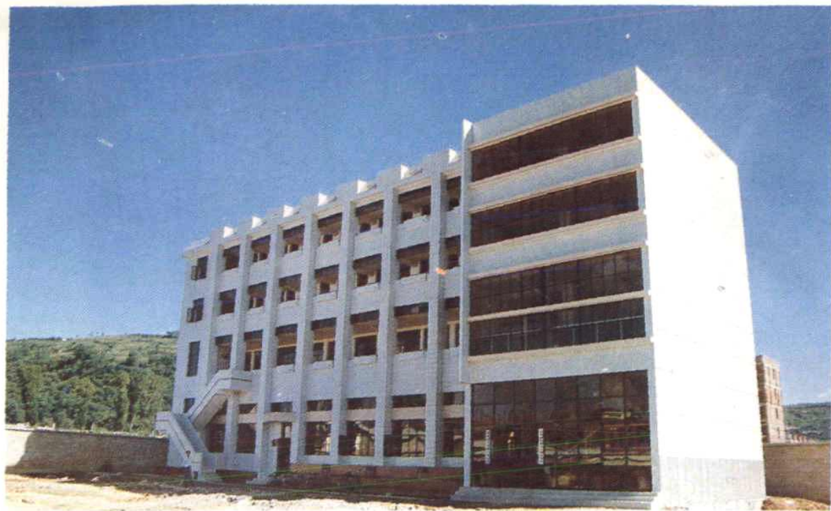
新建的镇党委、镇人民政府办公大楼（上）