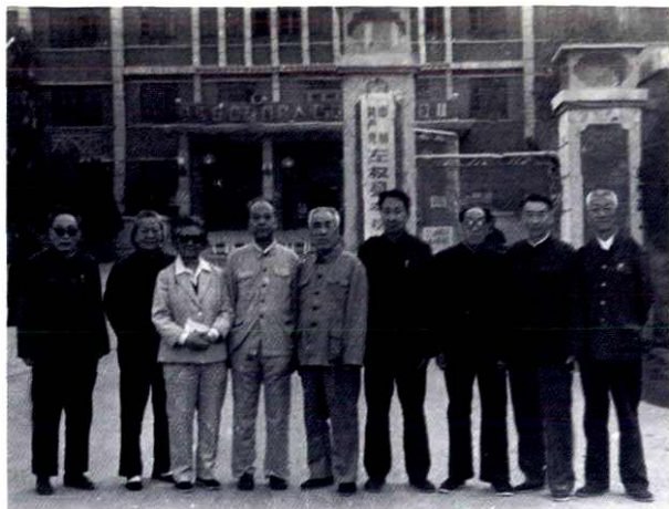
左权县九届县委书记合影。