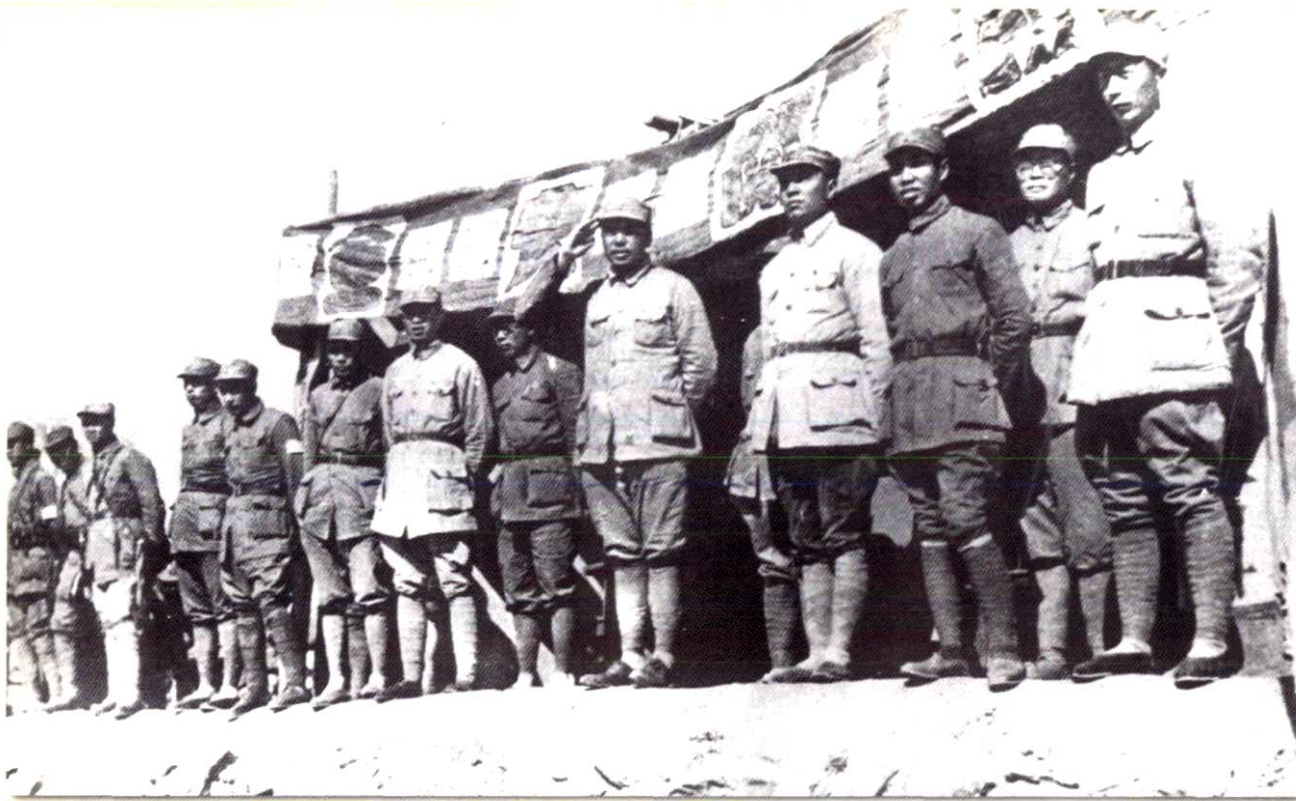
1940年春，八路军首长在辽县（今左权）桐峪镇检阅部队。右起：聂荣臻、刘伯承、左权、杨尚昆、彭德怀、陆定一。