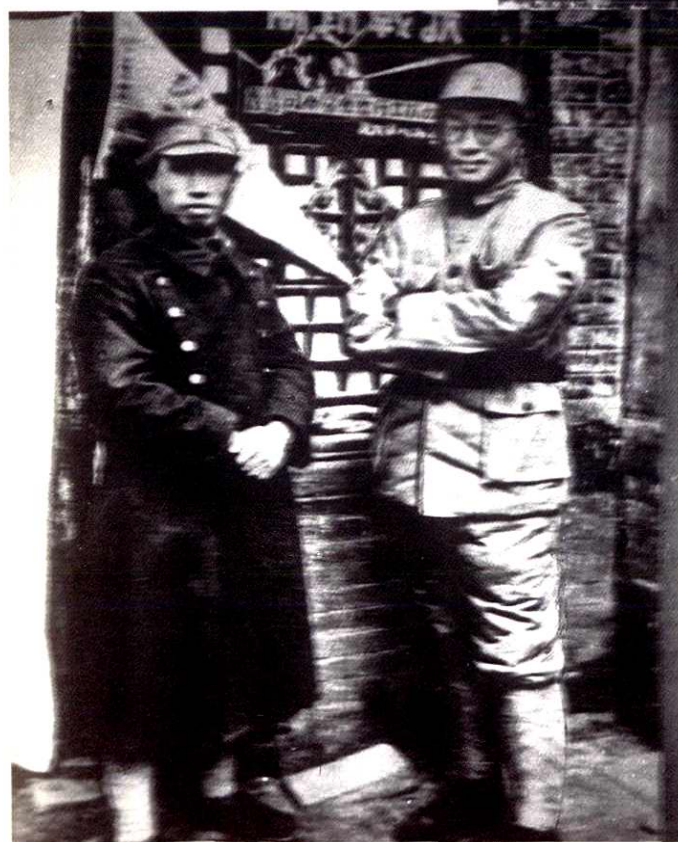
刘伯承师长(右)与左权副参谋长在这县桐峪镇合影。