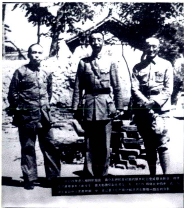
彭德怀副司令员与鹿仲麟在辽县下庄村谈判后合影。