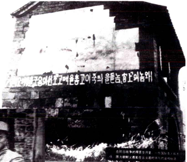
朝鲜义勇军在太行的驻地云头底村书写的宣传标语。