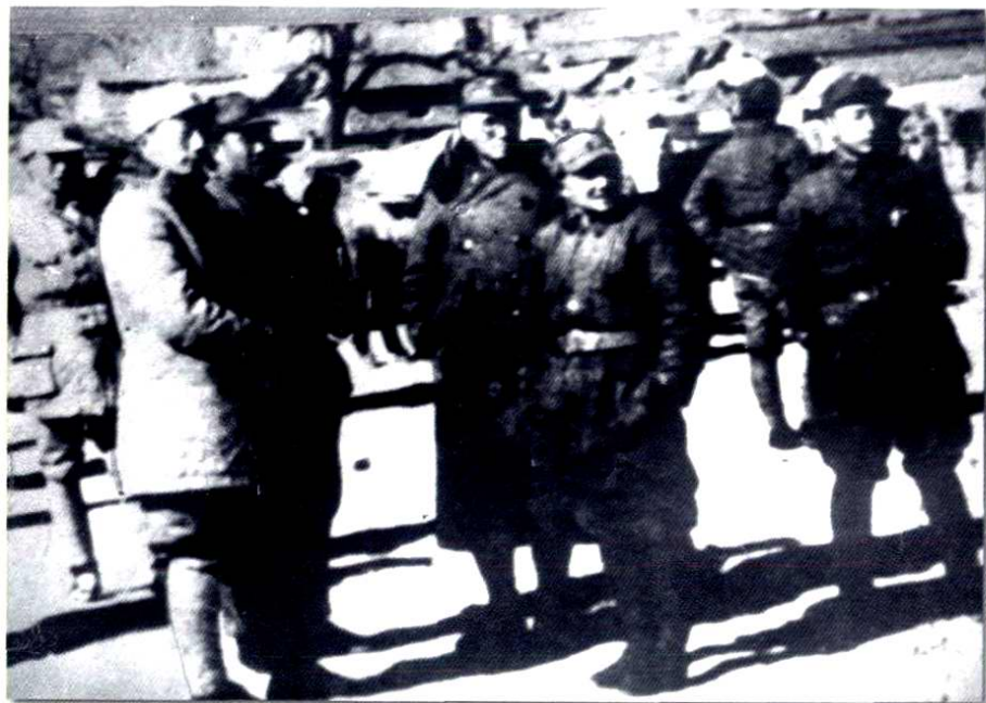
左起：聂荣臻、朱德、刘伯承、邓小平在左权县桐峪镇合影。