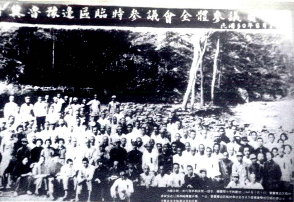
一九四一年七月七日，晉冀魯豫邊區臨時參議會在這縣桐峪鎮隆重召開。