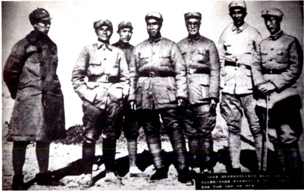
右起：聂荣臻、罗瑞卿、刘伯承、朱德、蔡树藩、邓小平在辽县桐峪镇。