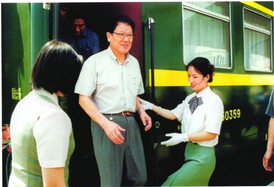
2001年6月1日，中共中央政治局委员、中国社会科学院院长李铁映（中）乘坐北京至威海旅客列车抵达威海视察工作