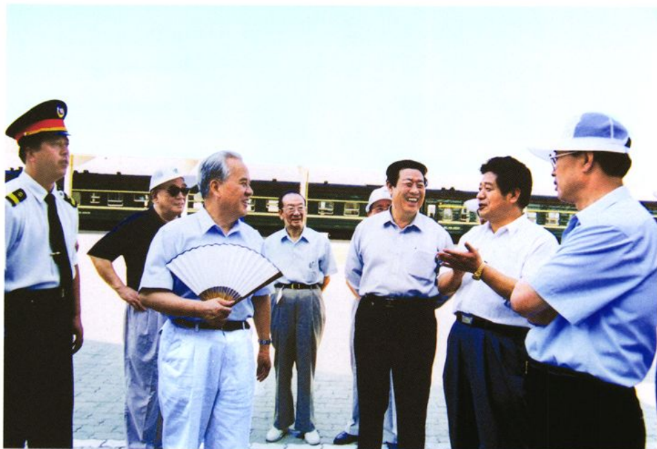
2001年7月26日，全国政协副主席陈锦华（左三）带领全国政协常委视察团视察威海站