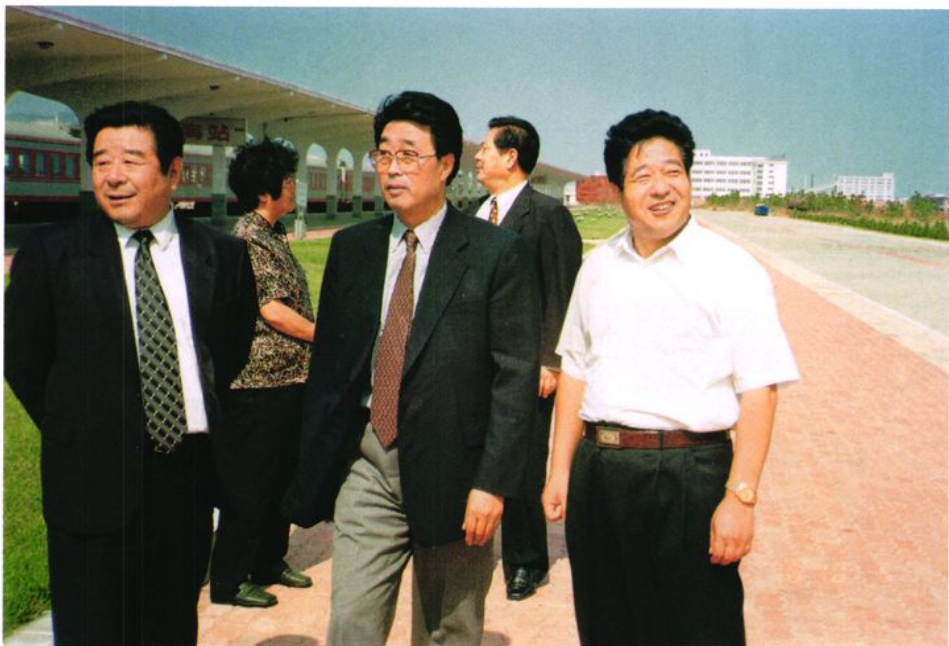
2000年10月6日，中共内蒙古自治区党委书记、人大常委会主任刘明祖（左一）参观威海站，中共威海市委书记、市人大常委会主任孙守璞（左三）陪同参观