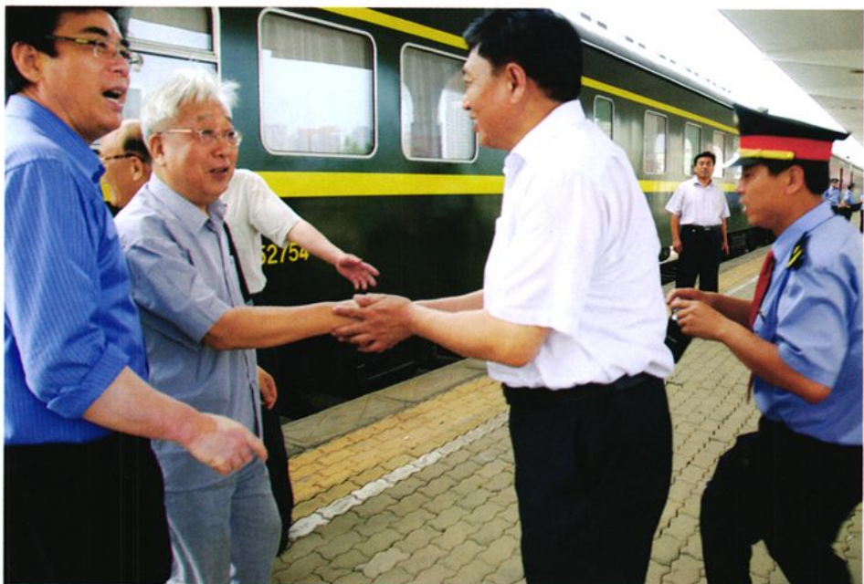
2010年6月28日，全国政协原副主席张思卿（左二）乘坐北京至威海旅客列车抵达威海视察工作