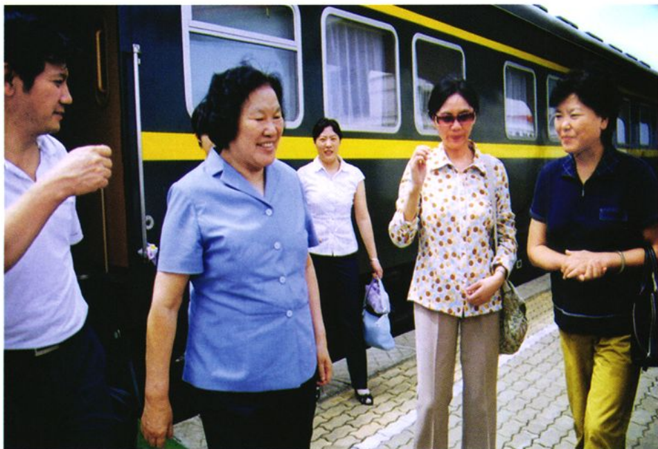
2006年8月6日，全国政协副主席郝建秀（左二）乘坐北京至威海旅客列车抵达威海视察工作