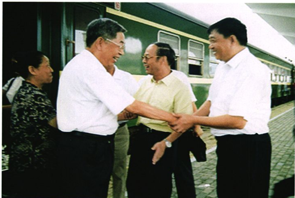
2005年8月7日，全国人大常委会副委员长许嘉璐（左二）乘坐北京至威海旅客列车抵达威海视察工作