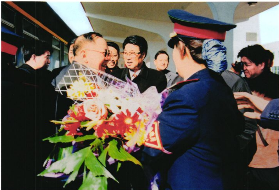
2002年2月13日，全国政协副主席、中国工程院院长宋健（前左一）乘坐北京至威海旅客列车抵达威海视察工作