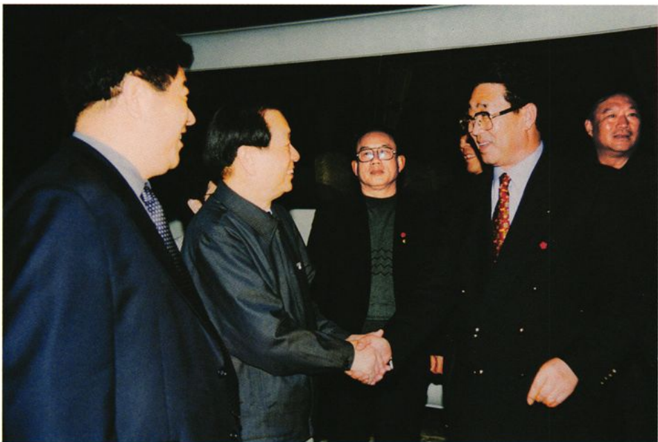
2001年5月4日，中共中央政治局委员、国务院副总理钱其琛（左二）乘坐威海至北京旅客列车返京，中共威海市委书记、市人大常委会主任孙守璞（右二）前往车站送行