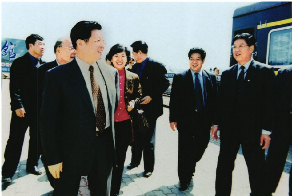
2002年5月1日，全国政协副主席、中共中央统战部部长、中国光彩事业促进会会长王兆国（前左一）乘坐北京至威海旅客列车抵达威海，参加东北亚经济论坛