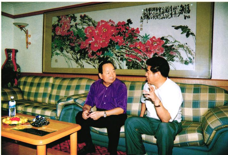
2000年7月31日，中共中央政治局委员、全国人大常委会副委员长田纪云（左）听取威海市地方铁路管理局工作汇报