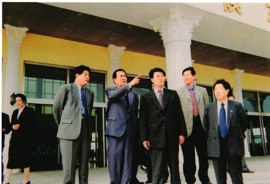
2000年10月20日，全国人大常委会副委员长铁木尔·达瓦买提（前左二）视察威海站，中共威海市委书记、市人大常委会主任孙守璞（前左三）陪同视察