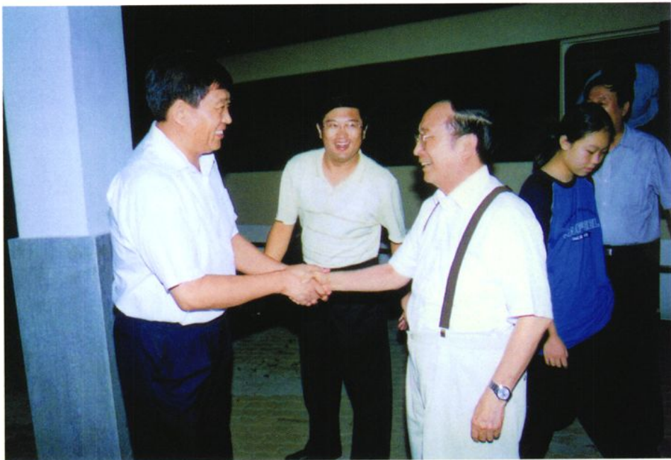
2007年8月15日，全国人大常委会副委员长蒋正华（左三）乘坐威海至北京旅客列车返京