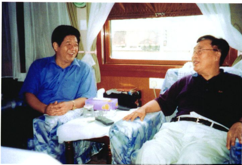
2001年9月8日，全国政协副主席李贵鲜（右）乘坐北京至威海旅客列车到威海视察工作