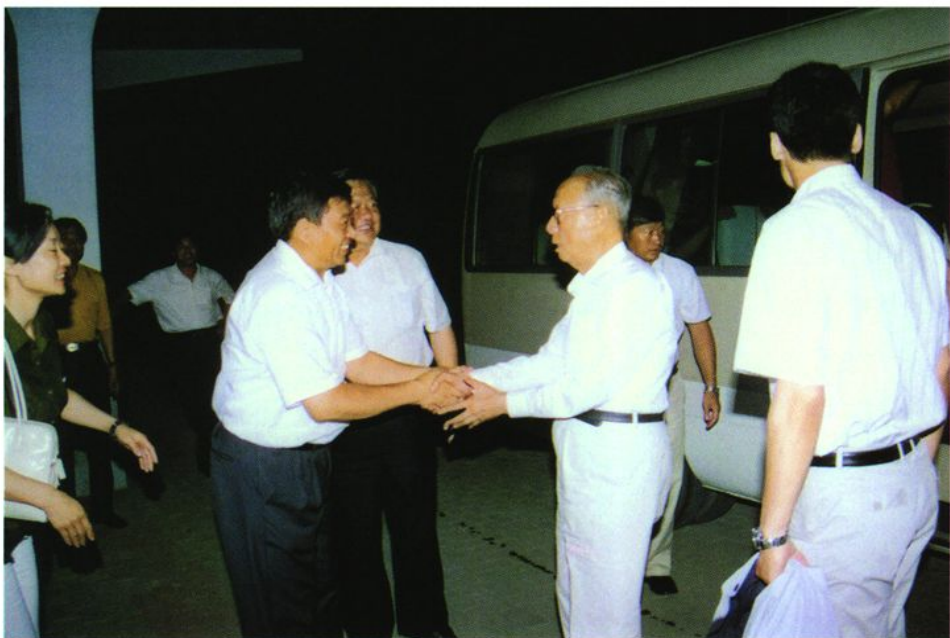
2007年6月6日，全国政协原副主席任建新（右二）乘坐北京至威海旅客列车抵达威海视察工作