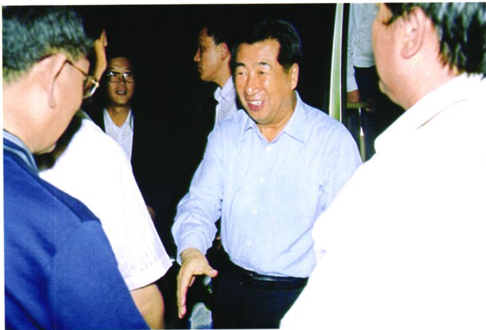
2006年9月17日，中共中央政治局委员、国务院副总理回良玉（中）乘坐威海至北京旅客列车返京