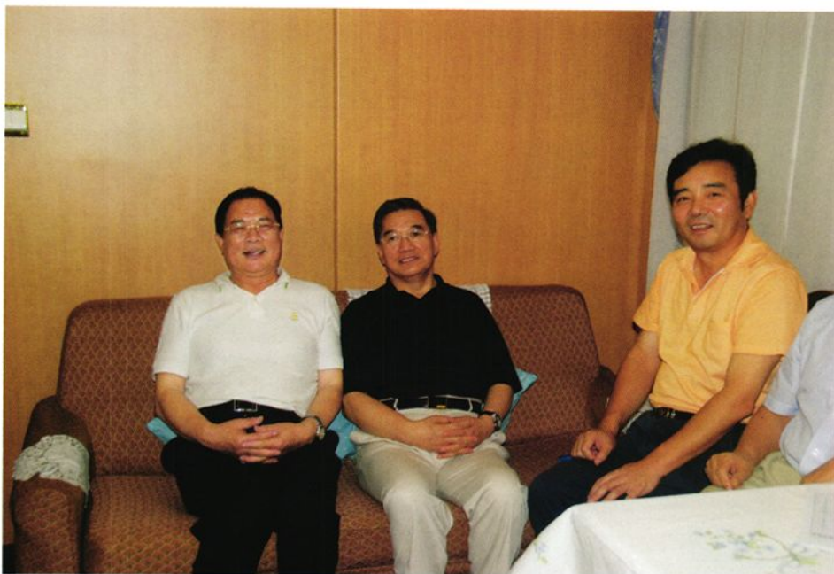
2009年8月6日，全国政协副主席李金华（中）乘坐威海至北京旅客列车返京，中共威海市委书记、市人大常委会主任王培廷（左一）到车站送行