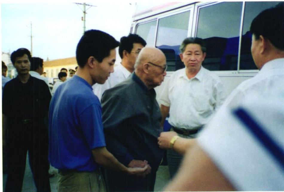
1996年9月4日，全国政协原副主席、铁道部原部长吕正操（中）视察桃威铁路