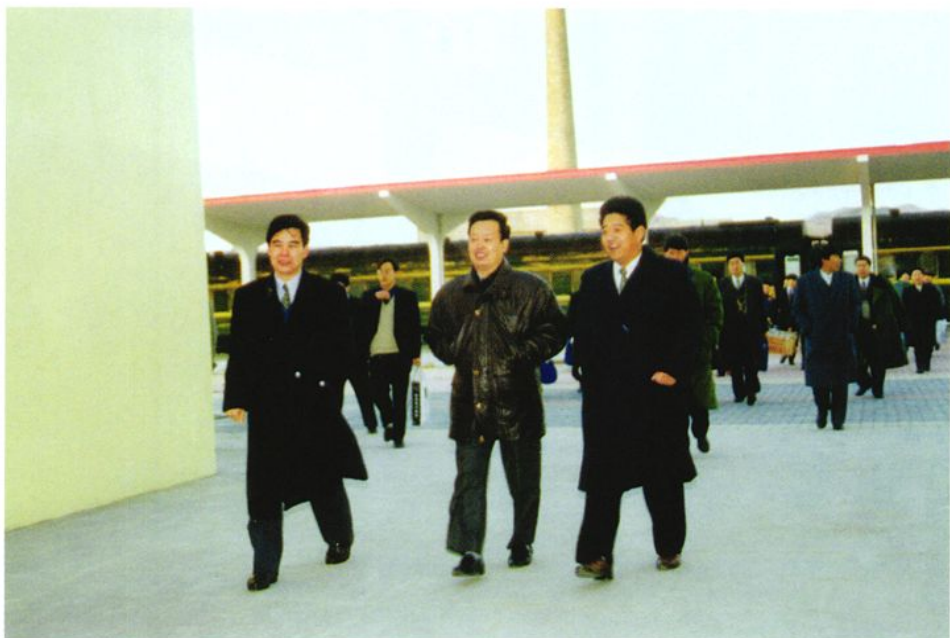
1998年12月6日，中共山东省副书记陈建国（中）乘坐济南至威海旅客列车抵达威海视察工作