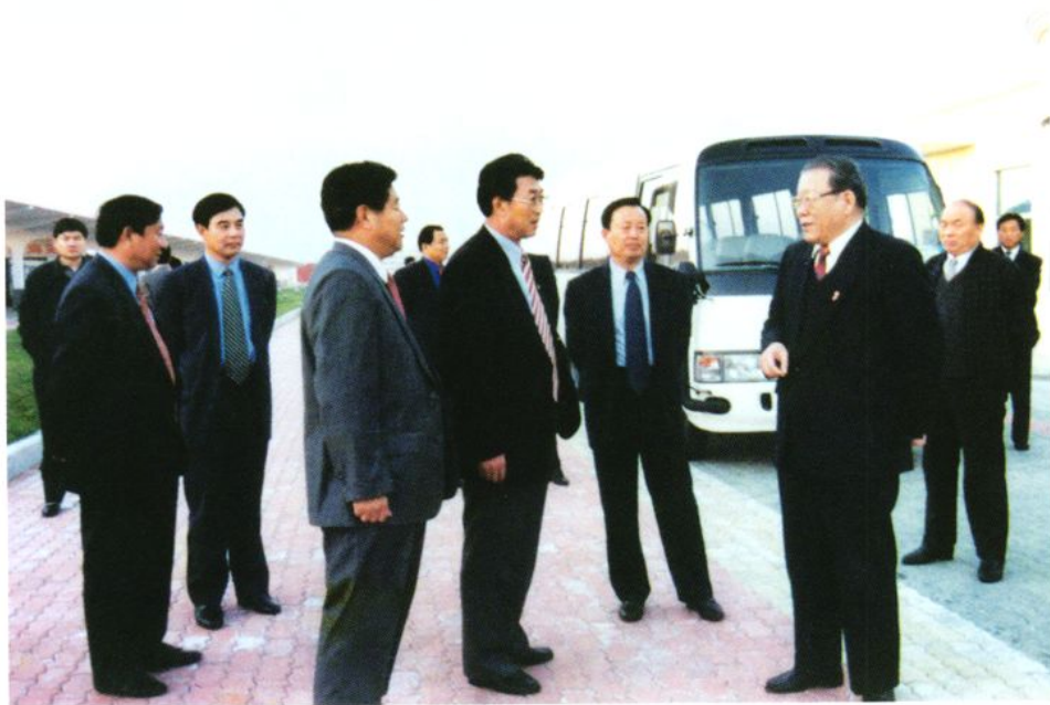
1999年11月9日，中共中央党建工作领导小组副组长、中央“三讲”教育联席会议负责人张全景（前右一）视察威海站，中共威海市委书记、市人大常委会主任孙守璞（前右二）陪同视察